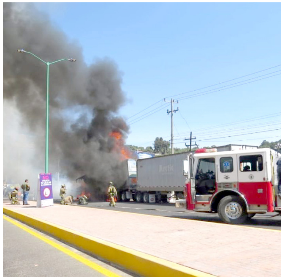
Cerca de las 14 horas se reportó que miembros del Ejército Mexicano repelieron a un ataque armado.

Minutos después se reportó la quema de vehículos en las carreteras Apatzingán -Aguililla, Apatzingán -Buenavista, y de manera