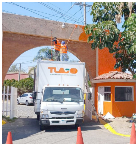
Gobierno de Tlajomulco

Se han realizado diferentes trabajos de mejora.