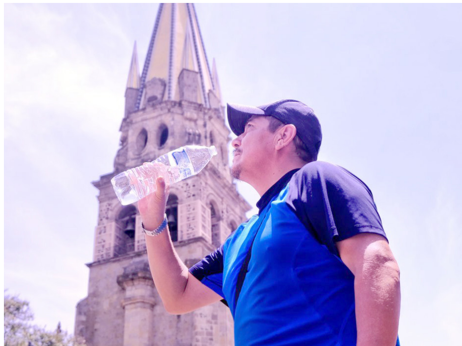
Recuerda mantenerte hidratado durante esta temporada de calor.

Con las altas temperaturas, los alimentos se descomponen más rápido, por lo que se deben extremar precauciones