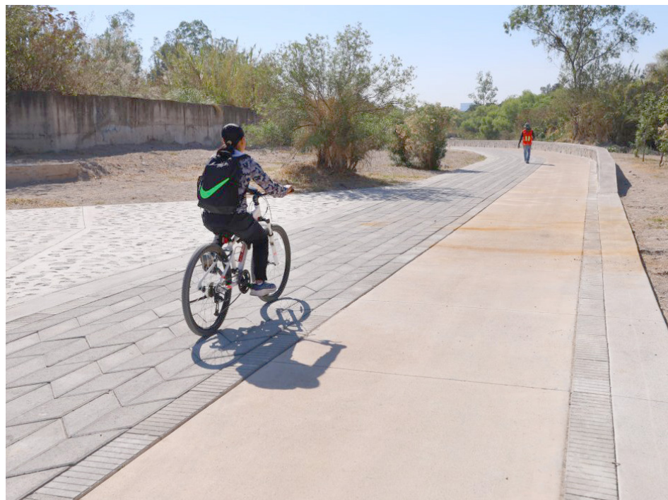
La inversión para estos trabajos fue de 11.45 millones de pesos.

“Este proyecto es muestra de lo que se puede lograr cuando hay continuidad y visión a largo plazo. Este bosque es ya un pulmón de nuestra ciudad y lo seguiremos fortaleciendo para que sea un espacio digno de convivencia,