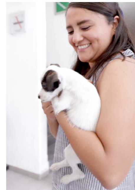
Gobierno de Guadalajara

Agregó que los grupos más vulnerables en esta temporada son las y los menores de cinco años, personas adultas de 60 años, mujeres embarazadas, y adultos con alguna comorbilidad sujeta a múltiples medicamentos.