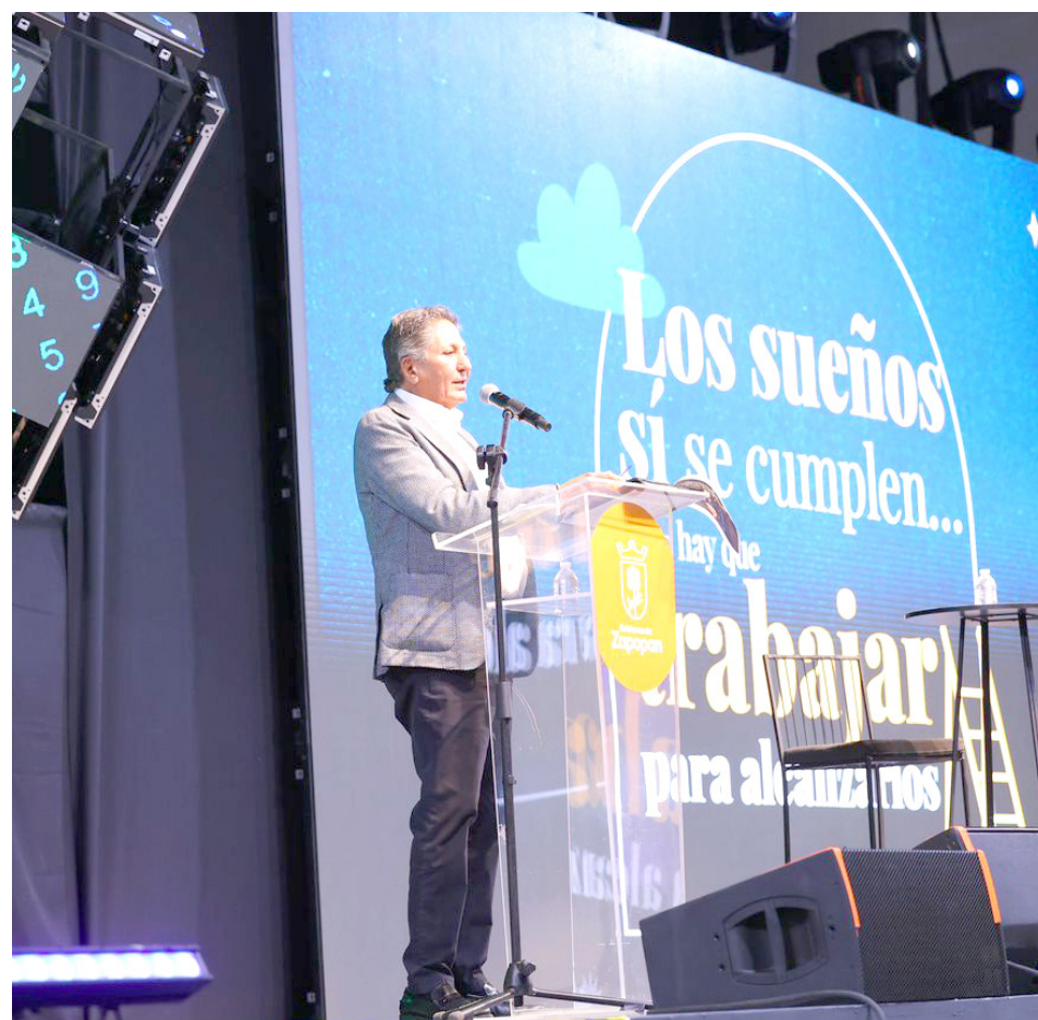
Gobierno de Zapopan

“Si no tienes un buen equipo, jamás vas a triunfar. Muestra de ello es el equipo que formé junto al Gobernador Pablo Lemus; llevamos