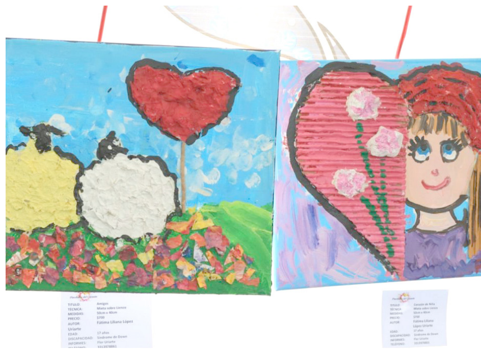
La exposición ofrece un espacio a talentosos artistas del municipio.

Estas piezas fueron realizadas en su mayoría por personas con alguna discapacidad; se exponen en el Centro de Atención al Turista