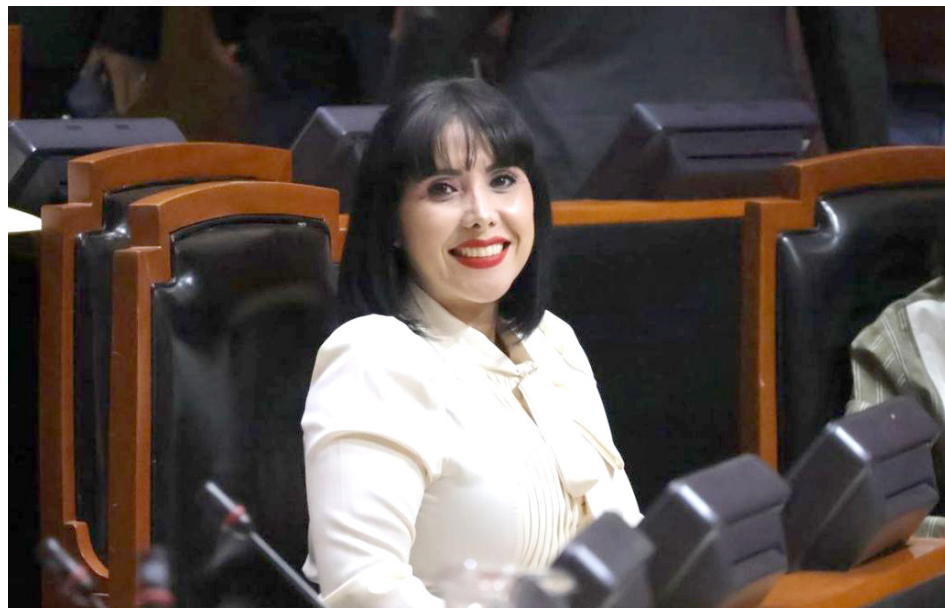
La diputada aseguró que mantendrá un diálogo plural con todas las fuerzas políticas.

Asimismo, reiteró su compromiso de "trabajar con profesionalismo, responsabilidad y con la frente en alto, representando al Congreso con dignidad, como lo merece el