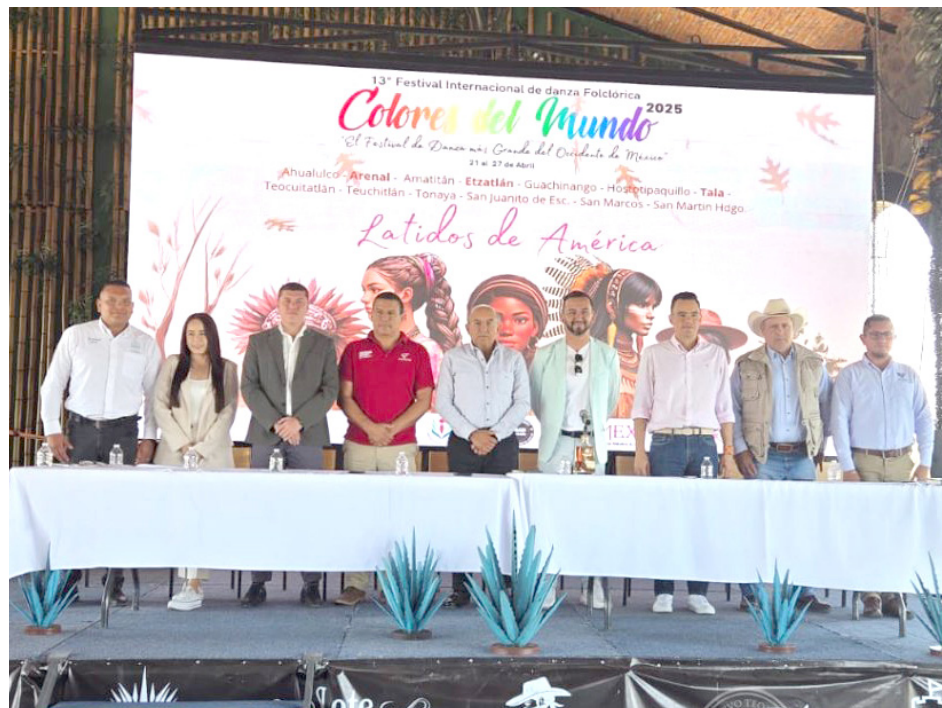
La presentación del evento se realizó en el Castillo de Tequila.

Con la presentación del presidium inició el anuncio de las actividades del festival siendo el primero en hablar el presidente del municipio de Tala,