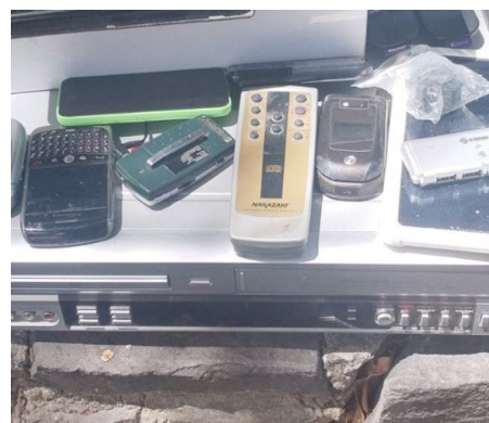
Concluyó la campaña de acopio de estos productos.

Añadió que, el 26 por ciento del total de residuos electrónicos recibidos en esta campaña se logró en dos centros de acopio: Colomos Providencia y El Sauz.