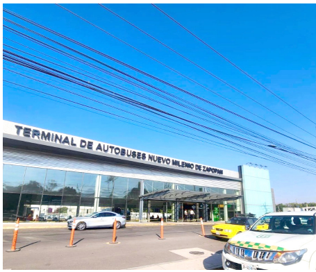
Gobierno de Jalisco

En los primeros 120 días reporta mil 558 infracciones viales.