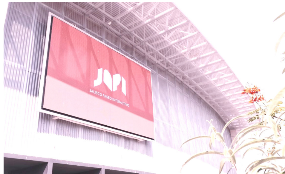
En Zapopan el Museo Jalisco Paseo Interactivo, será una opción clave en vacaciones.

También todos los domingos de abril, a las 13:00 horas, se contará con