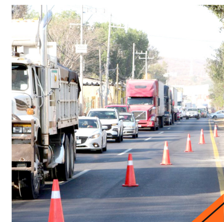
Se realizan recorridos en puntos conflictivos para salvaguardar a la población.

Como parte de este operativo, se están realizando recorridos de prevención en las zonas boscosas del municipio para exhortar a los visitantes a que no enciendan fogatas o detectar algún incendio, adicionalmente se establecieron módulos de seguridad en los ingresos por parte de las diferentes dependencias de atención de emergencias.