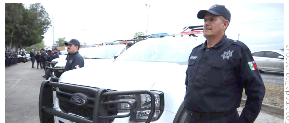
Estas dos semanas se reforzará la seguridad en distintos puntos.

colindante con el municipio de Tonalá. En esta zona estarán desplegados los agrupamientos Cobras y Jaguares para brindar apoyo inmediato ante cualquier eventualidad.