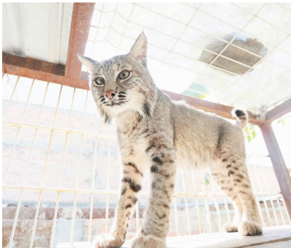
Con estas obras se fortalecerá la atención médica y el rescate temporal de los ejemplares.

El municipio de Tlajomulco invierte 8 millones de pesos en esta obra que realiza una importante labor; se han rescatado 10 mil animales