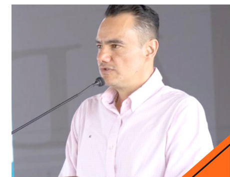
El alcalde de Tala, invitó a la feria de su municipio y a Colores del Mundo.

“Sí, creo que esto nos va a marcar. Esperemos que sea la punta de lanza de muchas cosas. Yo creo, soy un firme creyente de que debemos de enfocarnos a este tipo de eventos como es la cultura, el mismo deporte, todo lo que sea eventos, para cambiar el chip a la ciudadanía, para que nuestras generaciones futuras se den cuenta de que hay algo más allá, que podemos apostar por la cultura, pero que realmente se involucren”, dijo.