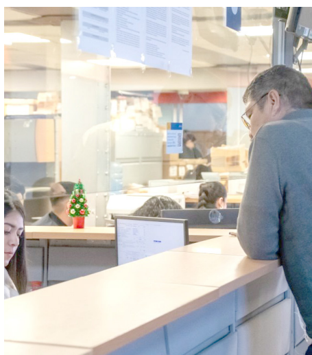
Jalisco cuenta con 138 recaudadoras estatales.

Estos espacios son La Moreña, en La Barca; el Museo Interpretativo del Paisaje Agavero y la Minería, en Magdalena; el Museo y Centro Regional de las Artes, en Autlán de Navarro; la Casa Taller Literario Juan José Arreola, en Zapotlán el Grande; y el Centro Cultural José de Jesús González Gallo, en Chapala.