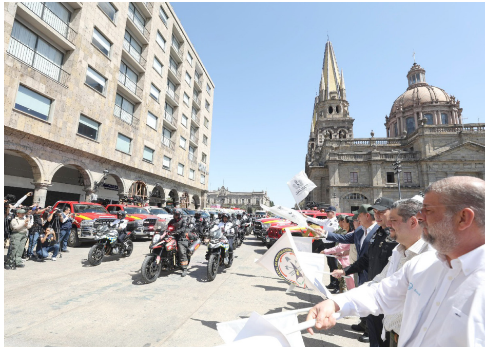
Las ocho comandancias regionales fungirán como puestos de comando.