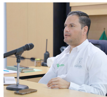
Gobierno de Zapopan

“Con el objetivo de restaurar áreas afectadas por incendios o que necesitan de una vegetación forestal y plantar durante el año 100 mil árboles, además de esparcir o lanzar 200 mil bombas de semilla en zonas forestales o áreas naturales protegidas que fueron siniestradas por incendios y que se complica el acceso para poder plantar de manera tradicional.