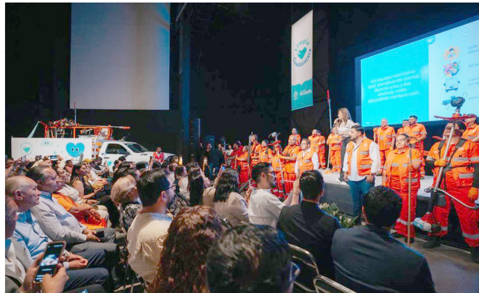
En la reunión estuvieron presentes más de 600 ciudadanos.

La alcaldesa destacó que se trata de dos fondos, Guardianes de la Ciudad y Programas de Corresponsabilidad, destinados para apoyar proyectos e incentivar a las y los tapatíos a mantener limpia la Ciudad.