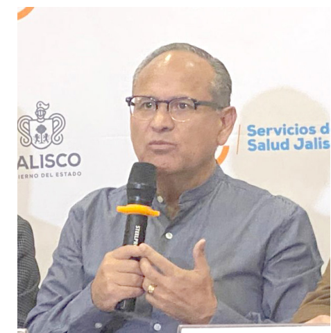
Enfermedades gastrointestinales también se incrementan con el calor.

En cuanto a enfermedades, con 28 casos nuevos de dengue en el estado de Jalisco y 515 acumulados en lo que va del año, el secretario de Salud, Héctor Raúl Pérez Gómez admitió que ante el inicio de la temporada de calor se preparan para intensificar acciones preventivas para erradicar el mosquito transmisor, porque está relacionado con otras enfermedades como Sika, chikungunya e incluso la fiebre del valle de Rift.