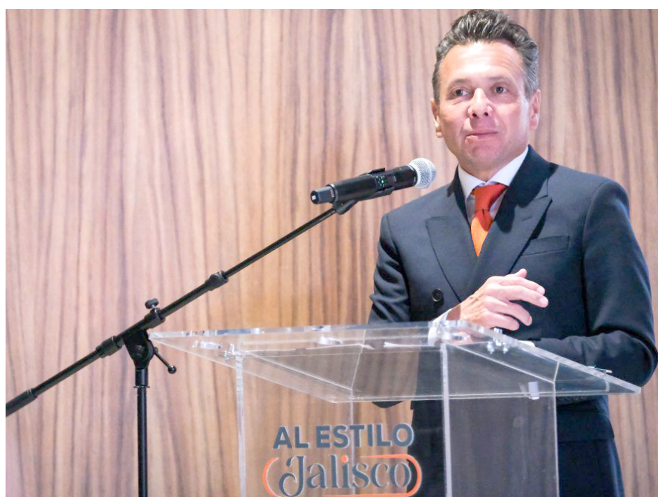
Pablo Lemus reveló que la meta principal es impulsar un crecimiento económico del PIB.

El Gobernador dio a conocer las 12 políticas públicas que potenciarán al Estado como un motor económico y que aumentarán la calidad de vida de las y los jaliscienses