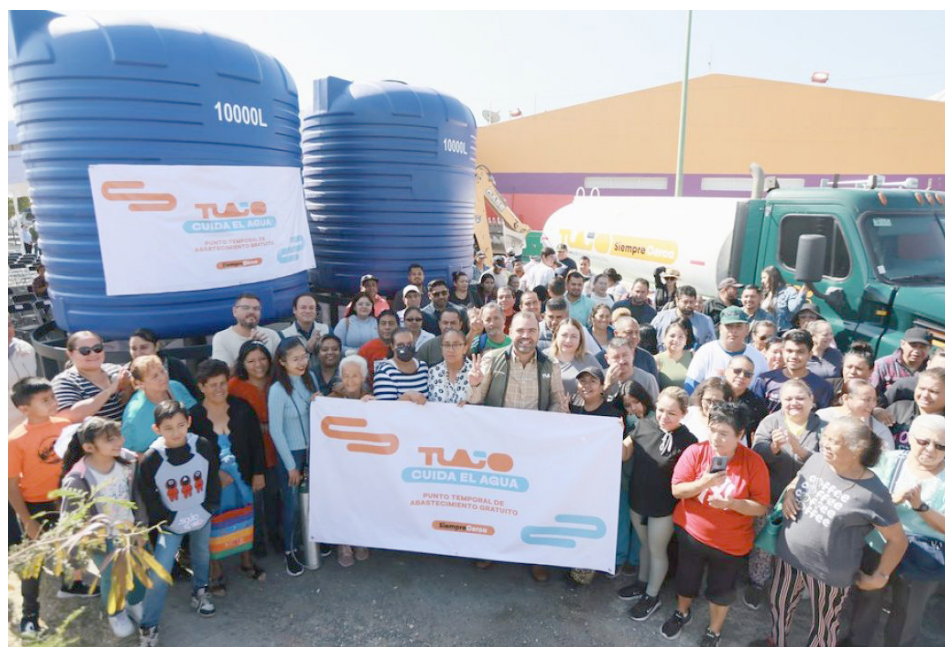
Tlajomulco también promueve el uso responsable del recurso.

Explicó que esta estrategia tiene como objetivo llevar agua a los hogares durante los meses más críticos y fomentar el uso responsable del recurso. El arranque de esta estrategia tuvo lugar en el fraccionamiento Los Cántaros con el banderazo de inicio de las obras de rehabilitación de la línea de