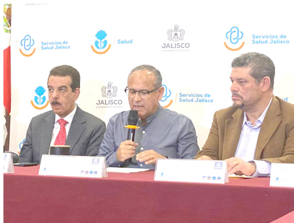
Las medidas se toman luego del caso registrado en Coahuila.

Para que un humano se contagie es porque tuvo contacto directo con un ave y le ocurre normalmente a quienes trabajan en granjas