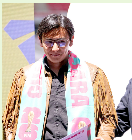
Mario Cortés Cuemanche fue el creador de la imagen.

Por tercera ocasión en la historia de esta competencia, Jalisco será sede mundialista, tras fungir como anfitrión en los Mundiales de Fútbol de 1970 y 1986.