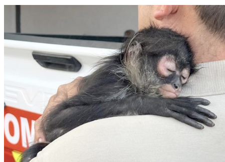
El animalito está en buenas condiciones de salud.

Posteriormente, el ejemplar, de al parecer unos ocho meses, fue entregado a las autoridades de la Procuraduría Federal de Protección al Ambiente (Profepa), quienes se encargarán de su resguardo y reubicación en un entorno adecuado para su especie.