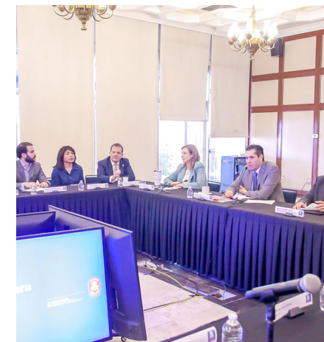
Su objetivo es cambiar de raíz la forma en la que se emprende.

“Nada más para que se den una idea: hay más de 200 pozos. Para su mantenimiento, para el tema de la vigilancia, para el consumo eléctrico... un chorro de cosas y elementos que hacen muy difícil, muy complicada nuestra forma de estar abasteciendo el agua. Pero la vamos a ir mitigando, y para que esto suceda tiene que ser con recursos, ¿verdad? Porque con pura saliva está difícil”.