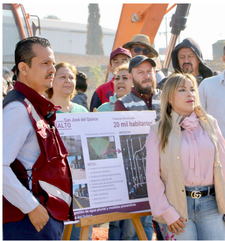
Gobierno del El Salto

La alcaldesa inauguró obra en San José del 15.