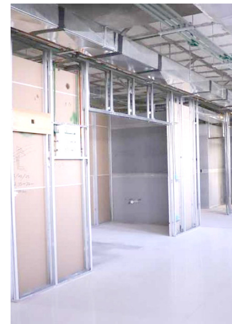
El municipio invierte 38 mdp en estos trabajos.

“Hay una alta expectativa, se espera mucho de nosotras, y además a veces se nos mire con otra vara. Se espera capacidad, talento, compromiso. Se espera que resolvamos problemas que otros no fueron capaces de resolver. Se espera que seamos sensibles, que lo demos todo, que nuestra vida personal deje a un lado. Y a lo mejor también se nos califica por apariencia y no por el fondo de lo que hacemos. Ser la primera implica una gran labor, porque es abrir un camino para no ser las últimas”.