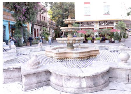
Se rehabilitará la fuente, un símbolo de la zona.