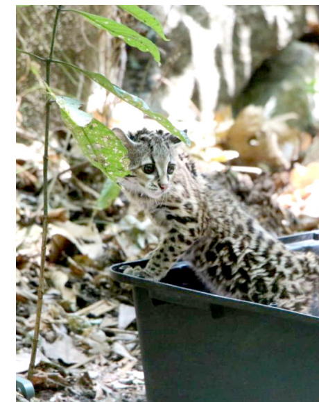
El animalito fue rehabilitado por la Unidad de Rescate de Fauna de Tlajo.