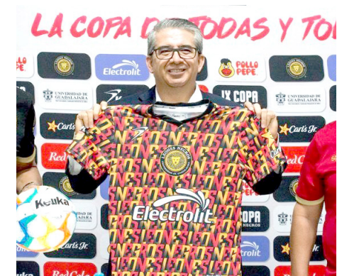
Jóvenes desde los 8 hasta los 18 años competirán.

Indicó que también contaban con la venta en línea a través de la página oficial https://comudetlaquepaque.com