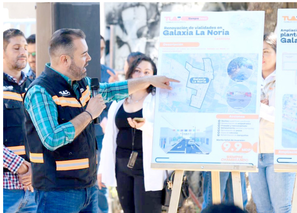
La obra contribuirá además a mitigar inundaciones.