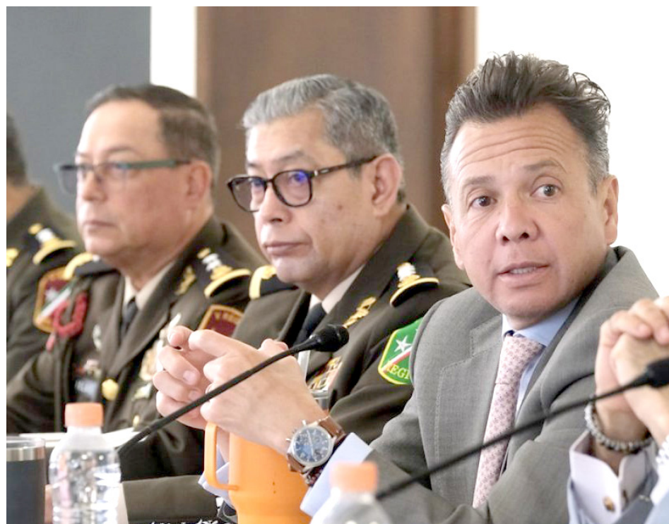
Pablo Lemus encabezó la sesión de la Comisión Ejecutiva Estatal de Seguridad.

Durante la sesión de la Comisión Ejecutiva Estatal de Seguridad, autoridades ven bien el impedir que ningún cantante o grupo enaltezca a criminales