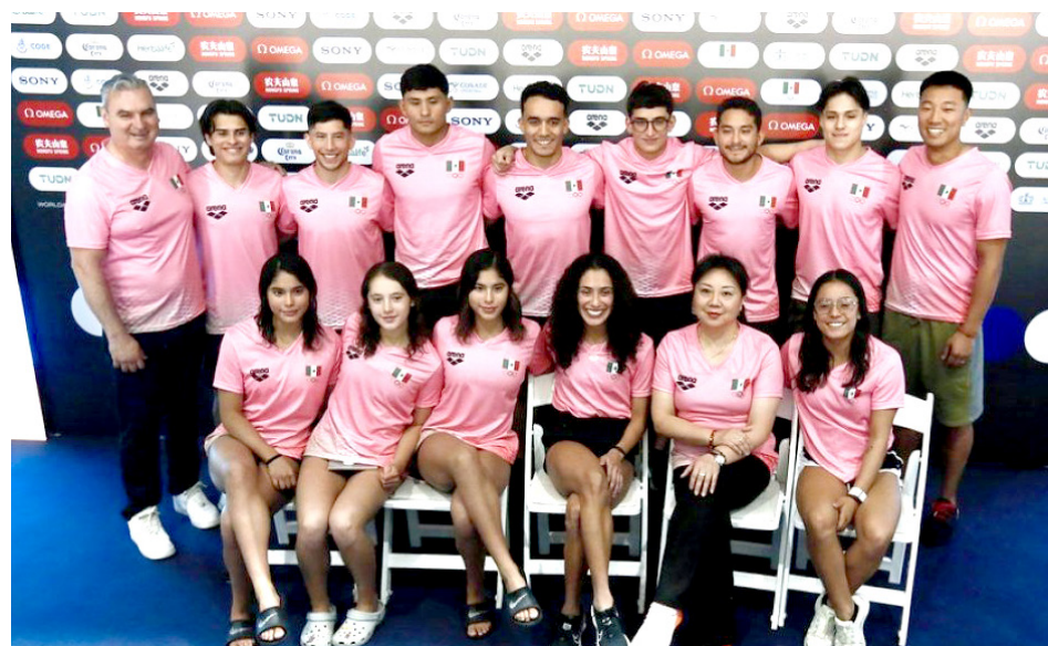
Los clavadistas están con el ánimo arriba para conquistar podios.