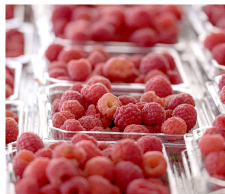
Buscan abrir mercado en Corea, China, Taiwán y Tailandia.

En estos días el stand jalisciense recibió a miles de personas con degustaciones y muestras de mixología, mientras que representantes de la agroindustria participaron en mesas de negociación para posicionar nuestros productos a nuevos mercados y estrechar lazos comerciales.