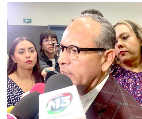
En Jalisco, 5,800 personas necesitan un trasplante de riñón, dijo el secretario.

Finalmente, visitaron la Asociación Casa de la Misericordia de Santa Isabel de Hungría, donde residen 130 pacientes psiquiátricos mientras que, en San Juanito de Escobedo la presidenta del DIF estatal acudió a las instalaciones del DIF municipal, la Unidad Regional de Rehabilitación y el comedor comunitario, donde cerca de 70 personas reciben diariamente alimentación nutritiva y balanceada.