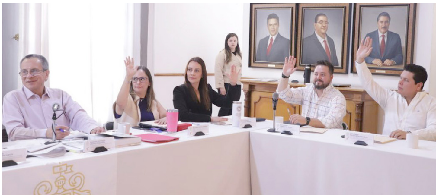
Esta herramienta mejorará la calidad de vida de los tapatíos.

El municipio busca que las calles sean un espacio público más democrático y sobre todo seguro para todos