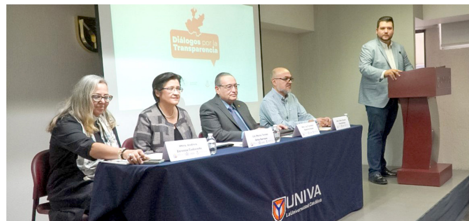
Buscará fortalecer los mecanismos de acceso a la información.

reforma en materia de transparencia buscará fortalecer los mecanismos de acceso a la información, fomentar la