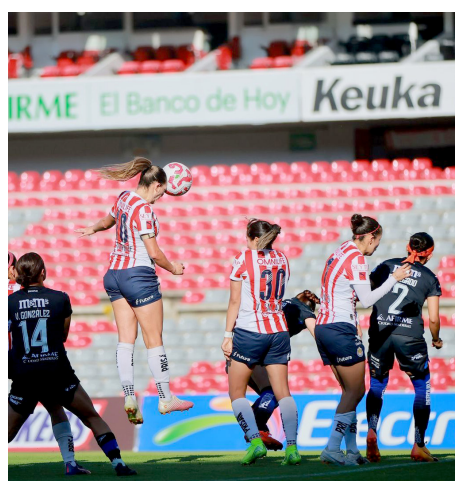
Chivas Femenil apenas logró sumar.

Con sus ocho tantos, Djuka está a solamente dos del líder de goleo individual. Atlas nunca ha tenido un campeón en ese rubro. El serbio no se obsesiona con lograrlo. “Sí, me comentaron. De verdad que no lo sabía. Yo, como siempre, voy partido a partido. Nunca pienso más lejos. Ahora solo pienso en el hoy, estoy a dos goles del primero. Pero estoy más enfocado en el siguiente partido y cómo vamos a enfrentar a América el sábado”, concluyó.