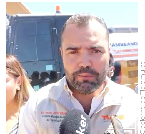
El alcalde ya se reunió con el titular de Setran.

El alcalde subrayó que esta obra beneficiará directamente a más de 200 mil habitantes de comunidades como El Zapote, El Capulín, La Alameda, Los Agaves y todo el corredor Chapala, incluyendo fraccionamientos como Paseos del Valle, Sendero Real, Valle Dorado y Lomas del Mirador.