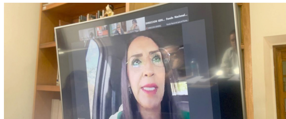
La alcaldesa destacó que se busca la participación de artesanos de todo el país.

Las y los integrantes del Consejo de Premiación son la directora