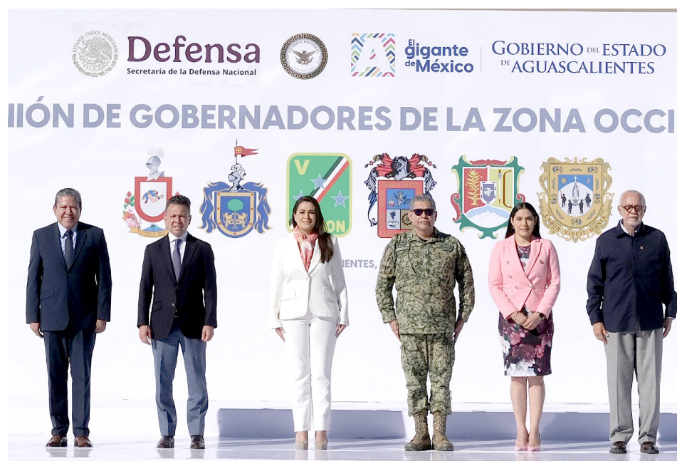
La reunión se realizó en las instalaciones de la XIV Zona Militar, de Aguascalientes.