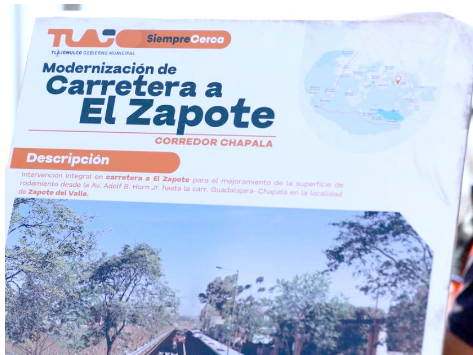
La obra forma parte del nuevo acceso sur al Aeropuerto Internacional de Guadalajara.

“Agradecerles la oportunidad de estar aquí juntos, arrancando esta obra importantísima para nuestro municipio, para el Sur de nuestra ciudad, esta avenida de El Zapote, conocida como El Canal, es una vía