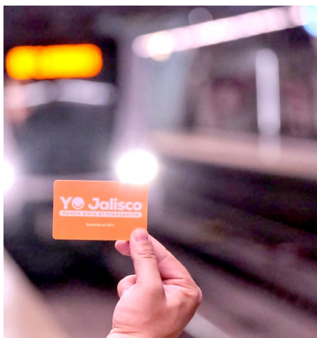
Gobierno de Jalisco

El presupuesto para este programa este año es de 160 millones de pesos.