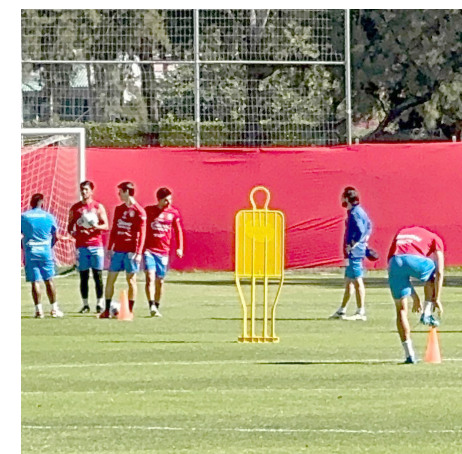
El equipo rojiblanco realizó la práctica en Verde Valle.