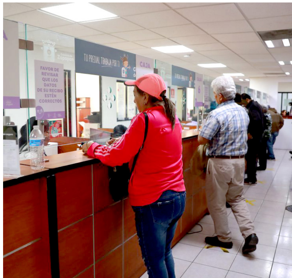
Gobierno de Zapopan

En cuanto a la contratación de seguro para la vivienda, que tiene un costo de 199 pesos anuales y cubre afectaciones en casos de terremoto, incendio y explosiones, además de asistencia médica y servicios del hogar, la directora confirmó que también se