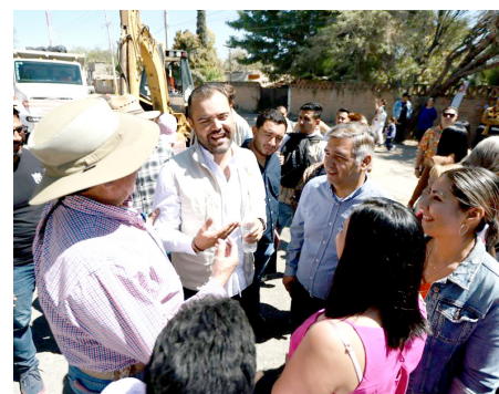
Gobierno de Tlajomulco

“Con calles pavimentadas, con mejores sistemas de drenaje y con alumbrado público de calidad, garantizamos espacios más seguros y funcionales para las familias de Tlajomulco”, señaló el primer edil.