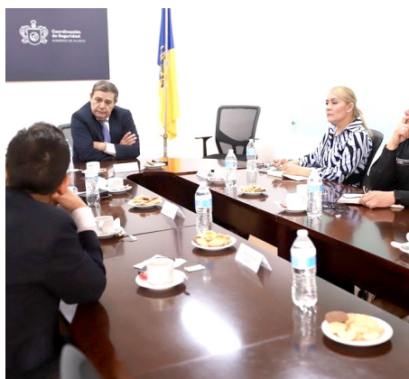
Gobierno de Jalisco

En estas reuniones las y los participantes expresaron sus principales preocupaciones y una de las más recurrentes fue la necesidad de que mejore la calidad en la atención que brindan servidoras y servidores públicos.