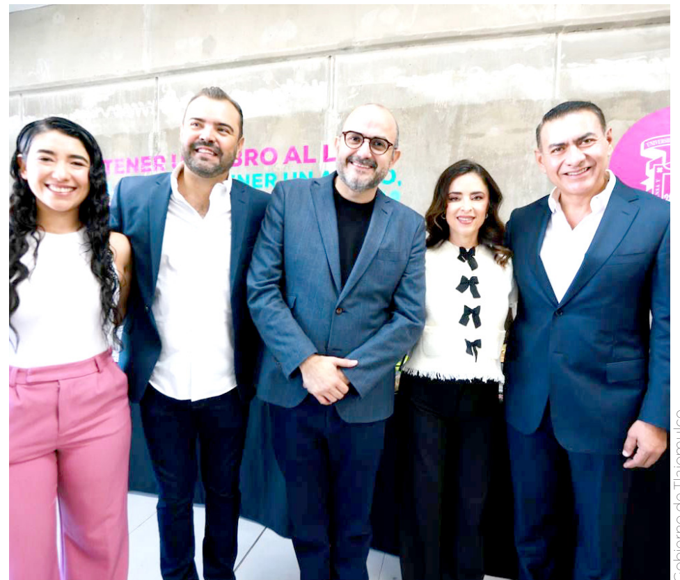
Gobierno de Tlajomulco