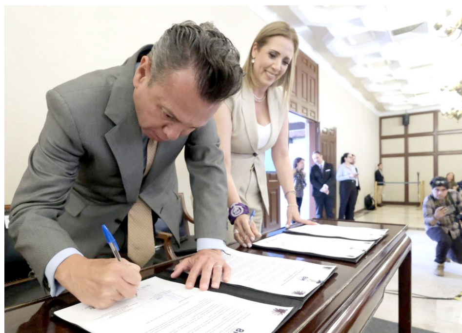
Gobierno de Jalisco

El acuerdo consta de 10 puntos centrales; se busca garantizar las protecciones necesarias para entornos sanos de mujeres, niñas y adolescentes