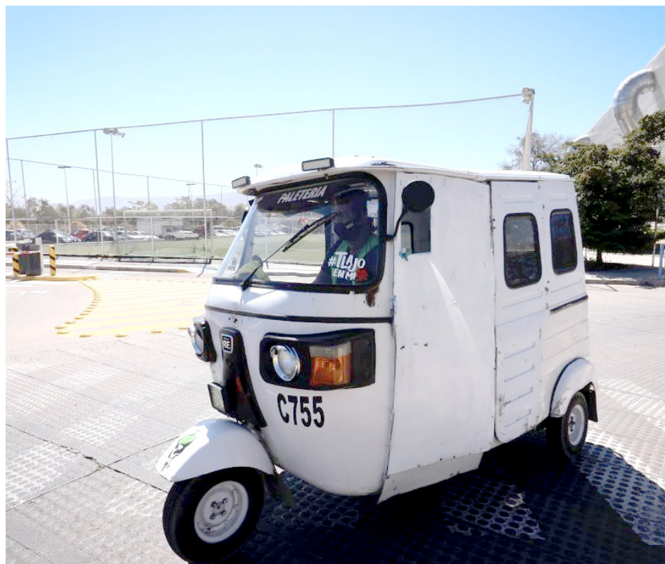
Diego Monraz aseguró que darán continuidad al programa de regularización de mototaxis.

En los municipios de Zapopan y Tlajomulco ofrecen incentivos económicos a los transportistas para unidades más seguras