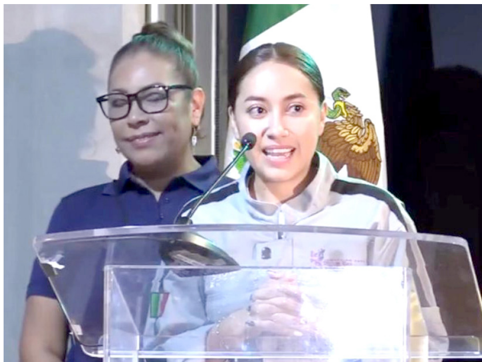
El reconocimiento se entrega a mujeres que contribuyen a una sociedad más igualitaria.