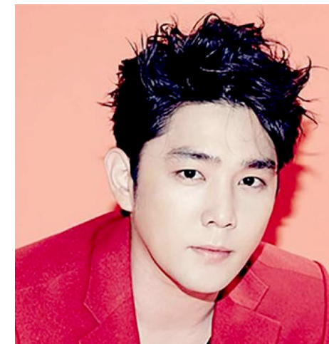
El artista inició su carrera en el grupo de K-pop Super Junior.

lo que nos corresponde para poder tratar de manera adecuada y con mucha dignidad a todas las y los fans de Kang-in. Sabemos que este va a ser un gran evento, es el primero que se hace en nuestra ciudad, el primero que recibimos en Zapopan y esto, ya saben que en Zapopan nos gusta hacer las cosas grandes y pensar siempre un paso adelante, pues queremos posicionarnos como municipio, como una de las ciudades que más promueve las culturas coreanas, con Kang-in vamos a inaugurar”, confirmó la coordinadora.