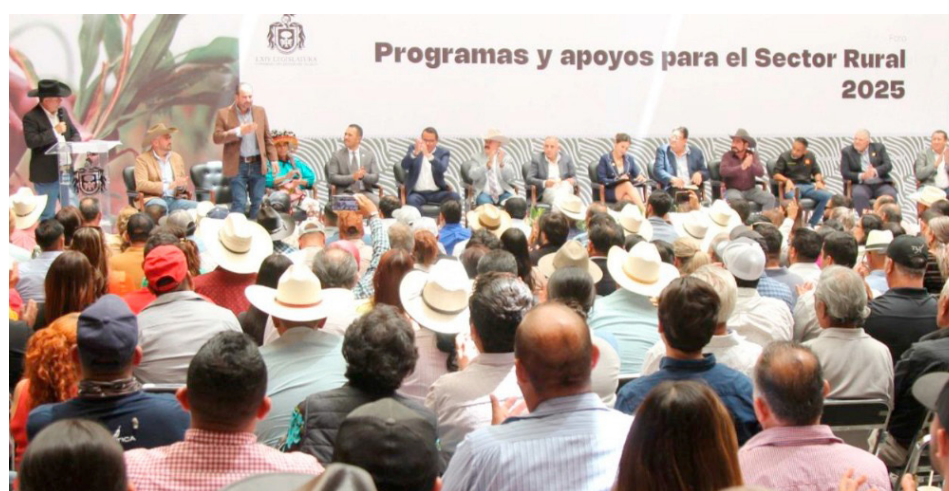
Los temas tratados incluyeron apoyos para unidades de producción.

Por su parte, la diputada Mónica Magaña Mendoza, presidenta