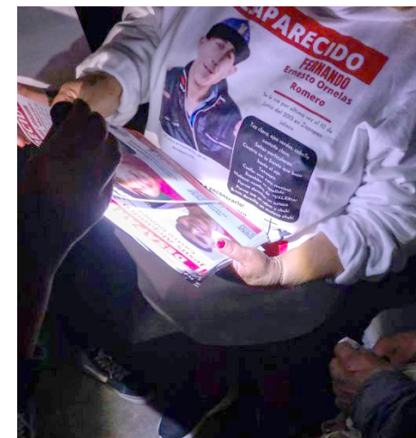
La Comisión mantiene su compromiso de garantizar respuestas rápidas y eficaces.

Además, incorporan un código QR como parte de las medidas de seguridad exigidas a nivel nacional, lo que permite proteger la información de los vehículos y sus propietarios.