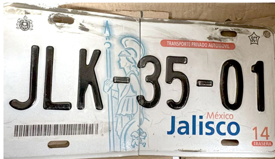
El trámite es obligatorio y gratuito a través del paquete 3x1.

Para hacer la sustitución es necesario cumplir la Verificación Jalisco, sin importar que se apruebe o no, y posteriormente agendar una cita en cualquiera de las 138 oficinas recaudadoras del estado a través de la página: https://sefinenlinea.jalisco.gob.mx/agendarecaudadora/agenda.aspx .