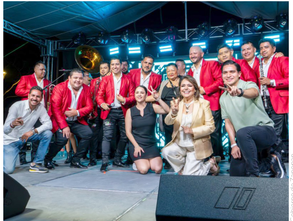
Gobierno de Zapopan

Entre las actividades que se incluyeron en esta fiesta fueron: música, teatro, danza y exposiciones, en un claro ejemplo de la apuesta por el acceso a la cultura para todos. Se informó que, durante los seis días de