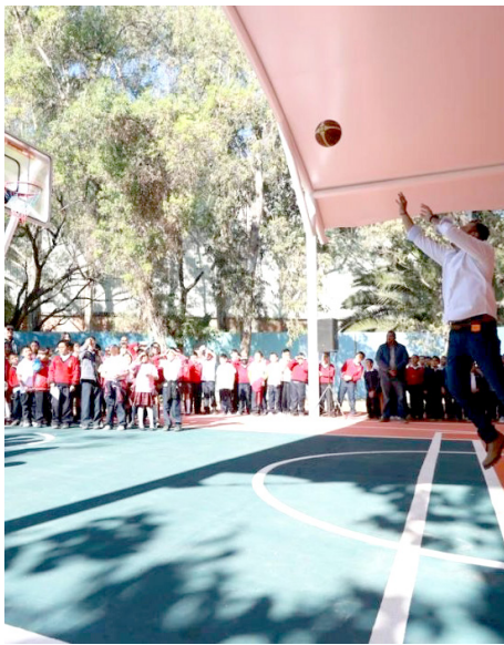
Gobierno de Tlajomulco

La intervención tuvo una inversión de 2.1 millones de pesos.