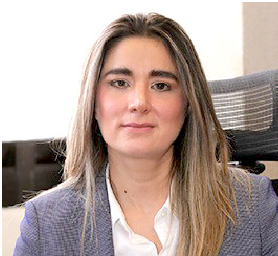
En las pasadas elecciones hubo casos de simulaciones, en Oaxaca, Nayarit, Hidalgo y Michoacán.