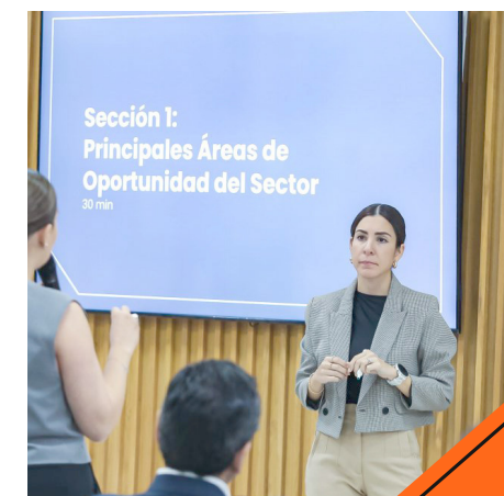
Concluyeron las sesiones plenarias con más de 80 empresas.

“Con este ejercicio, no solo logramos familiarizarnos más con cada uno de los sectores, sino identificar gestiones puntuales que hay que hacer con el Gobierno Federal —sobre todo en materia de regulación—, así como las oportunidades estratégicas donde pondremos nuestros esfuerzos, considerando el contexto actual, como una visión estratégica de largo plazo para nuestro estado”, dijo.