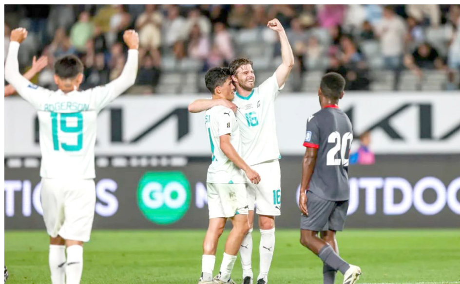
Nueva Zelanda se impuso a Nueva Caledonia.