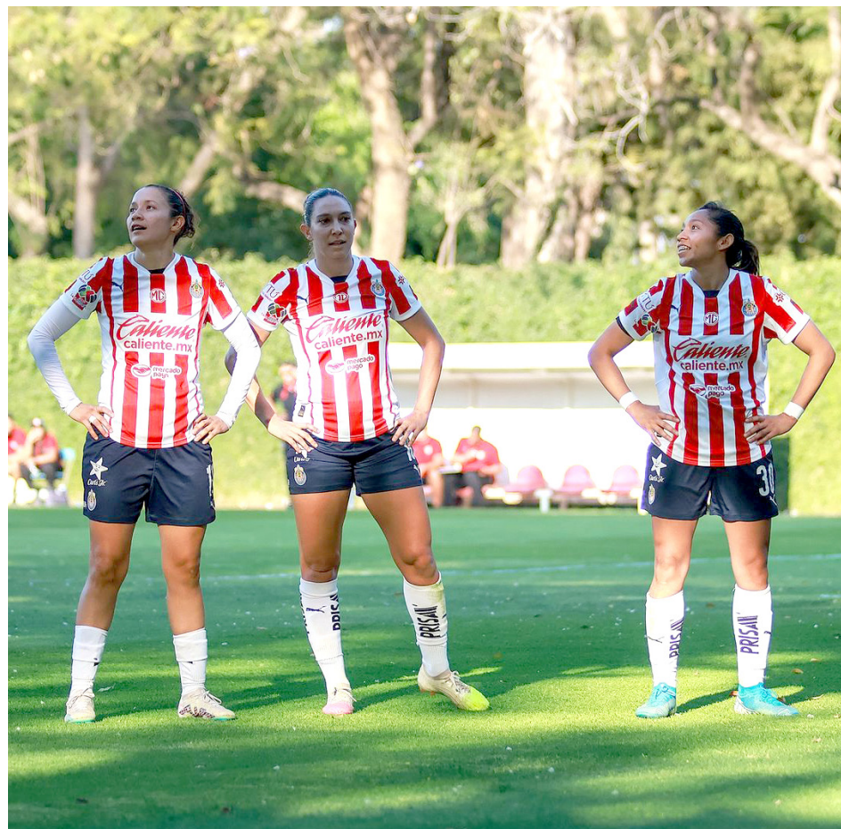
El domingo derrotó por 2-0 a las Rojinegras.