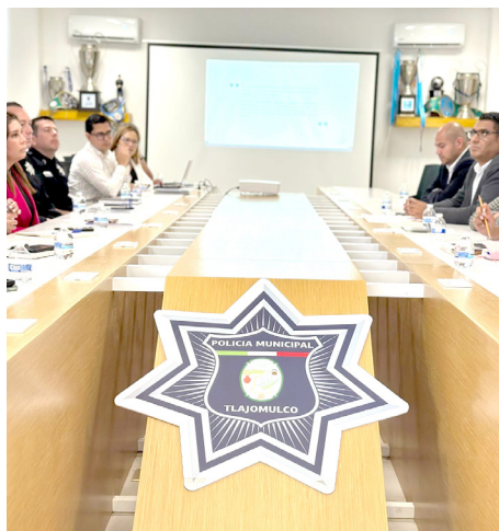
Gobierno de Tlajomulco

Empresarios de Tlajomulco ofrecen trabajo.