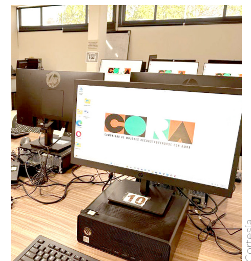
CORA ofrece cursos de capacitación y desarrollo personal en diversas áreas.