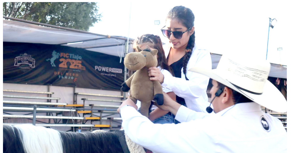
La equinoterapia contribuye al desarrollo del equilibrio.