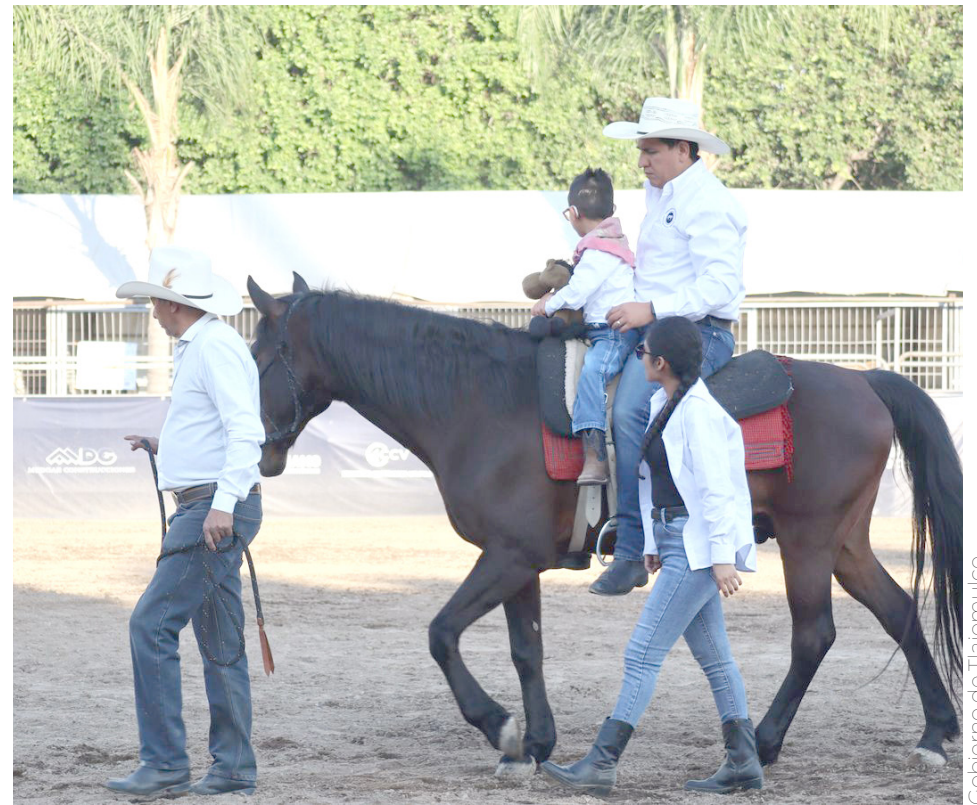
Grupo Macel compartió los resultados notorios en los pacientes.

Grupo Macel compartió con las asistentes a la Fiesta, los resultados notorios en los pacientes, quienes han mostrado un fortalecimiento físico y emocional a través del manejo del caballo, adaptando en el ritmo y los movimientos del animal a las necesidades de los pacientes.