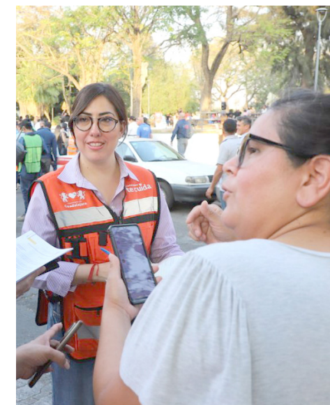
Se rehabilitarán calles, un parque y se construirá una pérgola.

Agregó que como parte de la estrategia de proximidad y de fomento a la Cultura, se darán clases de música, una vez por semana, a los niños y niñas de la colonia. “La Comisaría va a implementar, un día a la semana, clases de música para los niños y niñas aquí, en el parque. Estamos trabajando a través de una policía de proximidad y eso es una forma de cuidarlos”, apuntó Delgadillo García.