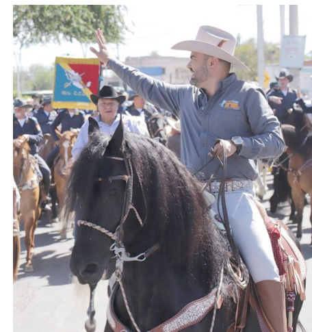
Gobierno de Tlajomulco

destacó la importancia del caballo para Tlajo, pues su industria es una de las principales actividades económicas y culturales del municipio.