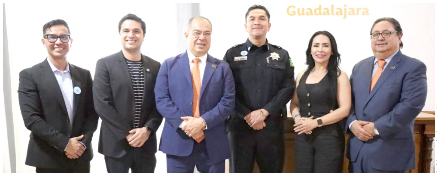
Esta actividad surge del convenio firmado hace unos días con el Gobierno tapatío.

El Instituto de Justicia Alternativa busca prevenir casos de violencia y conflictos escolares en escuelas públicas tapatías