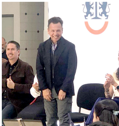
Pablo Lemus aseguró que continúan los operativos de búsqueda.