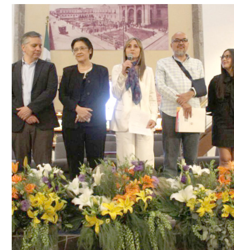
La Consulta Pública realizará en las 12 regiones del Estado.

“Esperamos contar con un sistema que sea digno de los jaliscienses y que permita no dar un paso atrás en la transparencia en nuestro estado y, como lo comentamos en la Mesa de Gobernanza, establezcamos los irreductibles, lo que ya hemos ganado no dejemos que se quite”, reiteró.