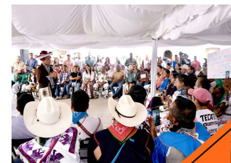
Pablo Lemus Navarro visitó comunidades de la Región Norte de Jalisco.

En esta visita, también expresó su gratitud por la hospitalidad de las comunidades y la apertura para construir, a través del diálogo y la colaboración, un futuro mejor para todos.