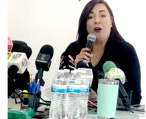
Hay casos en que mujeres buscan escapar del crimen organizado.

Red de Centros de Justicia para las Mujeres