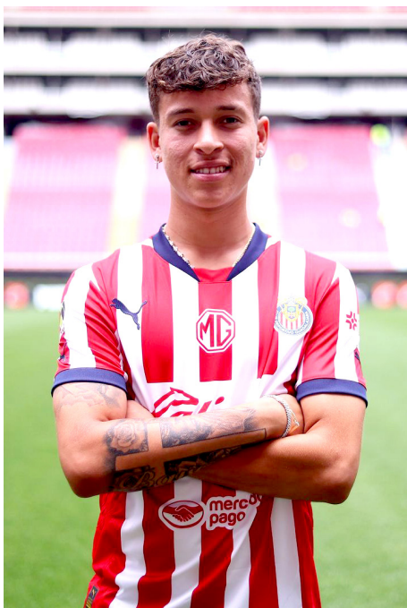
En los próximos días Fidel dejará al equipo.