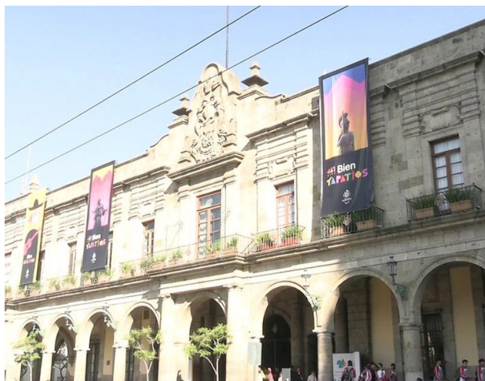
Gobierno de Guadalajara

Se realizarán 11 foros comunitarios y mesas de trabajo desde el 21 de febrero hasta el 10 de marzo; también habrá una consulta digital