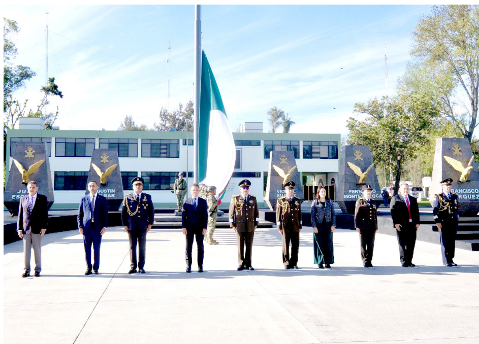
Pablo Lemus habló de su relación constante con las Fuerzas Armadas.

El Gobernador participó la conmemoración de los 112 años del Ejército Mexicano; expresó su agradecimiento por el respaldo de las Fuerzas Armadas