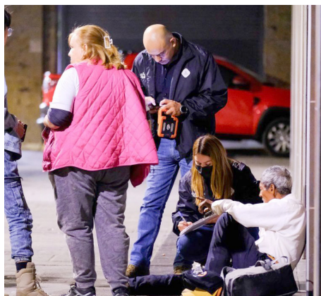
Gobierno de Jalisco

En el recorrido participaron 71 personas, entre familiares y servidores públicos.