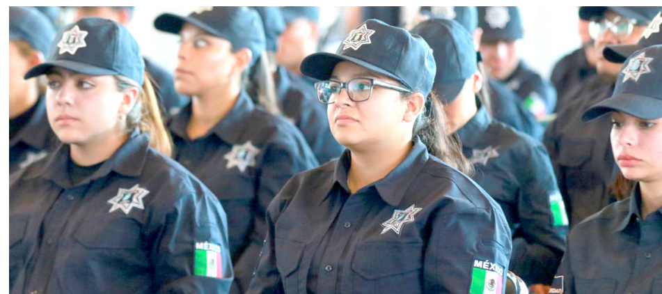
Buscan incrementar la seguridad en Tlajomulco.

Los aspirantes a policías de Tlajomulco, deberán someterse a los exámenes