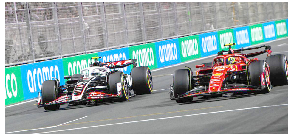
Las regulaciones que contemplan el motor V6 híbrido turbo de 1.6 litros han estado en vigor en 228 GP.

sido todo un reto para los equipos y pilotos, pero ha dejado enormes emociones para los aficionados, así como carreras que pasarán a