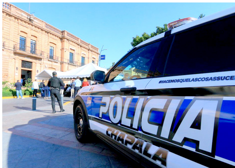
Las unidades cuentan tecnologías de vanguardia para confort y seguridad del policía.

Los 93 paquetes de vestimenta están integrados por camisolas, pantalones, chamarras y botas tácticas