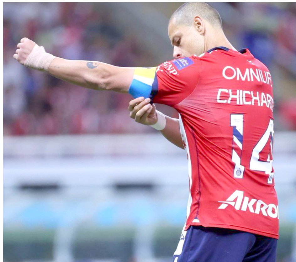
Con la llega de Pulido, Chicharito tiene más competencia.

Desde EU, ha comenzado a sonar la posibilidad de que Javier Hernández regresa a la MLS