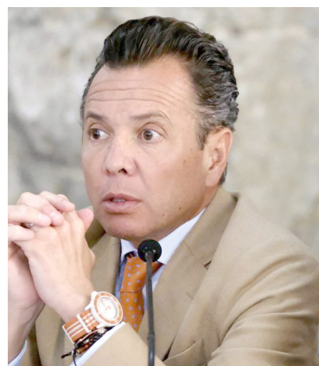
El gobernador Pablo Lemus confirmó la localización de la funcionaria.

Al confirmar que no hay personas detenidas por los secuestros del presidente municipal, su hijo, su esposa y algunos trabajadores, el Gobernador afirmó que en respeto a la autonomía municipal están pidiendo al alcalde de Villa Hidalgo que el nombramiento del nuevo comisario ocurra con el acompañamiento de autoridades federales y estatales.