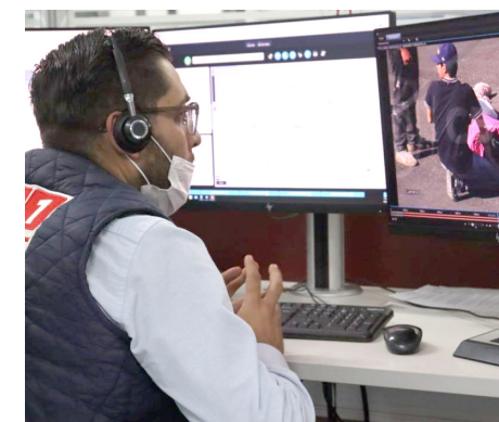
Con apoyo de C5 se logró localizar a 34 automóviles.

Además de estos aseguramientos se consiguieron la s detenciones de 52 personas que viajaban en los automotores para deslindar responsabilidades.