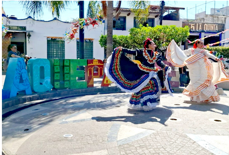
Todos los talleres que se realizan son gratuitos, excepto los talleres artesanales de barro.

Ramos Casas explicó que todas las actividades “se desarrollan a lo largo del andador Independencia, el Jardín Hidalgo, plazoleta de la infancia y plazoleta Springfield”, así como en las calles intermedias que comunican al