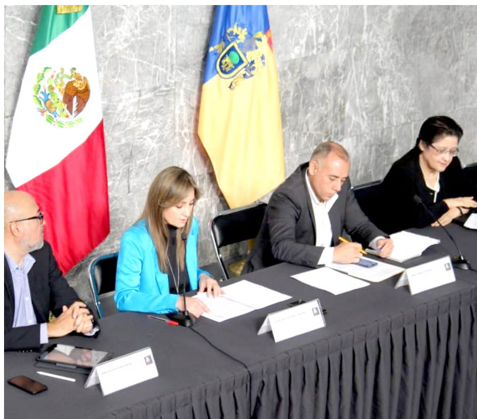
La instalación contó con la presencia de más de 100 presidentes municipales.