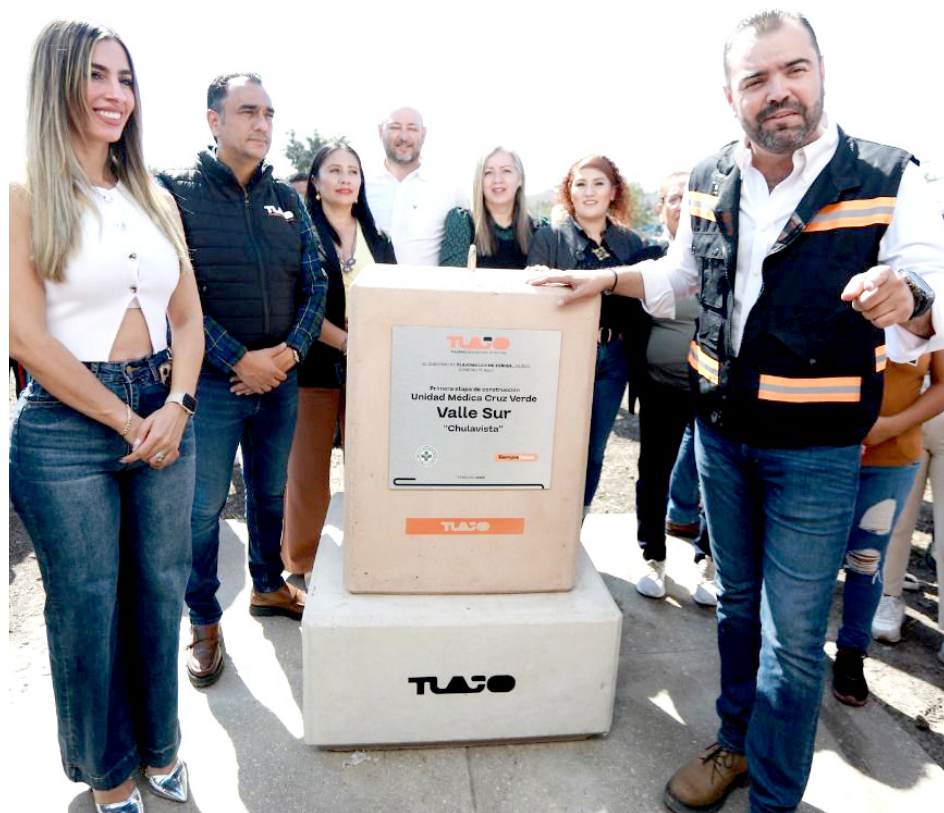
Quirino da cumplimiento a la promesa de contar con servicios de salud accesibles y cercanos.

El alcalde colocó la primera piedra de la que será la nueva Cruz Verde que dará atención a 120 mil personas