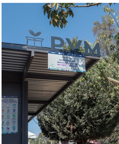
Está ubicado en Ixtlahuacán de los Membrillos.