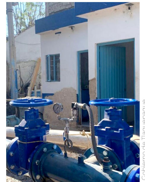
Cubrirá las necesidades de los habitantes de Santa Anita.

“Estamos agradecidos con el Ingenio de Tala, con todos sus directivos, porque están dando las facilidades para todos los productores que decidan hacer este gran cambio”, refirió. Cabe señalar que esta reconversión garantiza para las y los productores la compra de la caña cultivada y la generación de ingresos a partir de este ciclo.