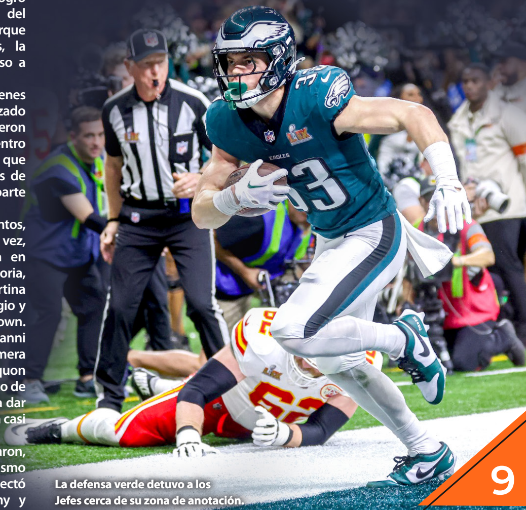
La defensa verde detuvo a los Jefes cerca de su zona de anotación.

Pero ni así los Jefes se dieron por vencido, su líder de los últimos años, Patrick Mahomes, envió un gran pase de 50 yardas para encontrar a Xavier Worthy y demostrando que lucharon hasta el final.