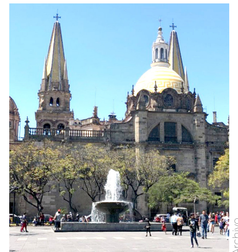
Se busca darles una solución espiritual.

Finalmente, calificó como una desgracia lo ocurrido en el municipio de Jocotepec, donde se derrumbó una barda en un preescolar sobre un menor que perdió la vida, por lo que pidió que las autoridades educativas intensifiquen las acciones preventivas.