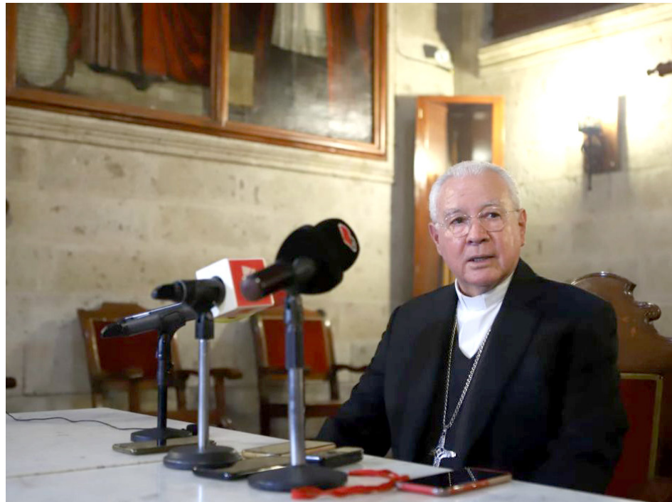
El prelado jalisciense espera que las autoridades atiendan cuanto antes las solicitudes de búsqueda.

“Que a quien secuestraban era a personas, especialmente jóvenes, que eran atraídos por una supuesta oferta de trabajo. Y al ir a atender esa invitación, esa oferta de trabajo, era cuando los detenían y los reclutaban para fines objetivos del crimen organizado, para ser halcones o para ser sicarios, etcétera. Entonces, eso