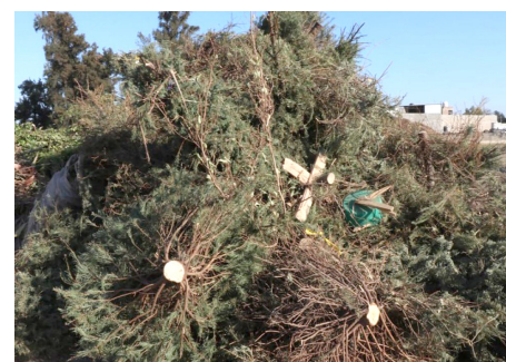
La campaña se mantendrá hasta el 14 de febrero.

La campaña se mantiene vigente hasta el 14 de febrero y no tiene ningún costo. Los centros de acopio se ubican en Soriana Santa Fe; Soriana Nueva Galicia; Walmart López Mateos; y Plaza Las Vírgenes en un horario de las 09:00 a las 21:00 horas.