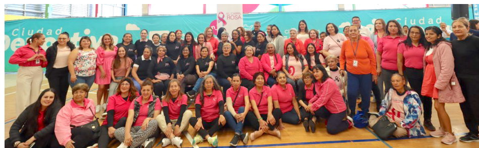
Es para sobrevivientes del cáncer de mama que presentan linfedema.