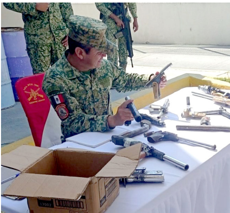
Gobierno de Tlajomulco

El objetivo es reducir las incidencias delictivas y los fallecimientos o lesiones.