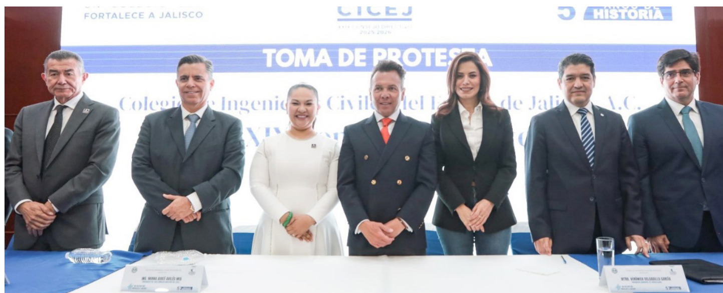
Pablo Lemus Navarro durante el evento del Colegio de Ingenieros.

El gobernador Pablo Lemus solicitó asesoría a integrantes del Colegio de Ingenieros sobre el proyecto