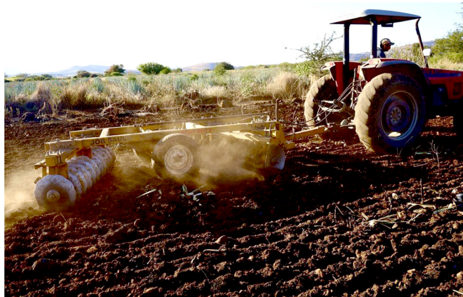
La Sader respalda los cambios de cultivo de agave a caña de azúcar.

“Por parte del Gobierno de Jalisco se aportarán 3 mil 200 pesos por hectárea en beneficio de los productores”, explicó. Este recurso servirá para limpiar las parcelas y dejarlas a punto para su siembra.