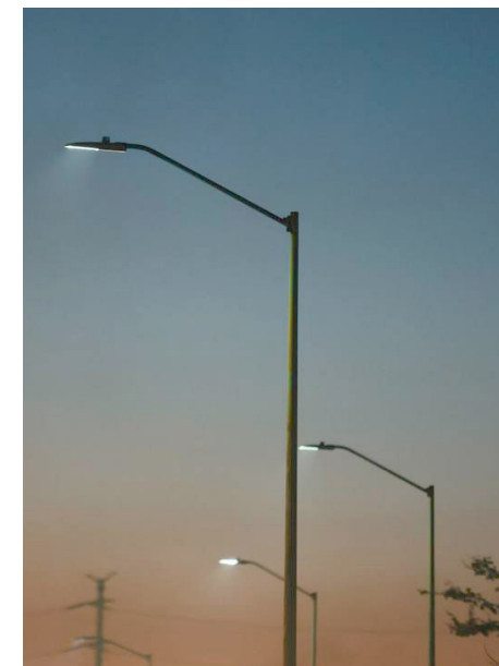
El proyecto Iluminemos Tlajo será desarrollado por la empresa Forlighting de México.