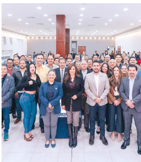
Gobierno de Guadalajara

Anual de Obra Pública ante el Colegio de Ingenieros Civiles del Estado de Jalisco (CICEJ) donde destacó que la inversión está encaminada a generar