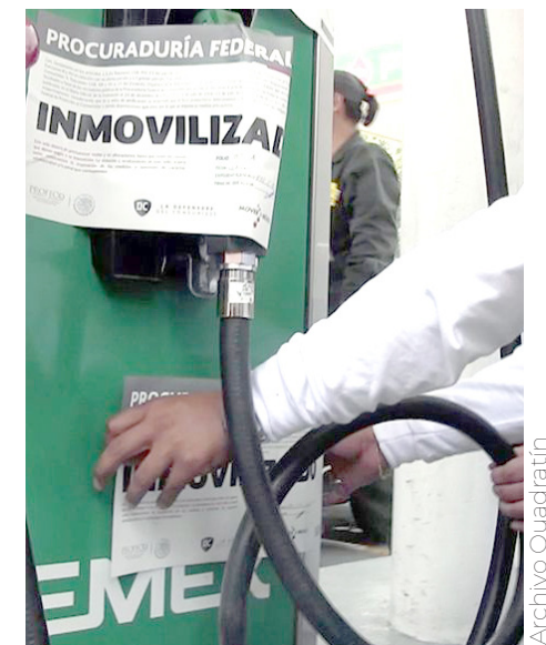
El Gobierno de México busca regular los precios.

Bajo ese marco, sostuvo que su intención es establecer un precio