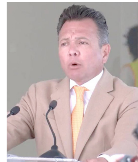
El Estado conservará los 6 mil 500 uniformados.

“Lo que sucedió con la mujer de la policía municipal vial es extraordinariamente lamentable, y muy delicado, le pedí al secretario de Seguridad y a la Guardia Nacional que mantengan un operativo permanente en Teocaltiche, es decir, los elementos que habían sido desplazados desde la semana pasada se van a quedar en la zona de Teocaltiche hasta que la situación pueda ser normalizada.