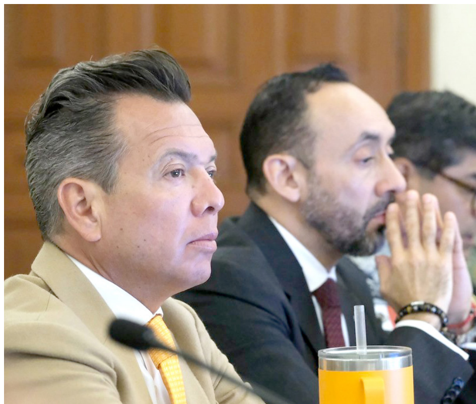
Dependencias informaron los resultados al Gobernador.

Sin embargo, tal como lo informó Quadratín Jalisco, en accidentes carreteros hubo 11 lesionados y una persona fallecida