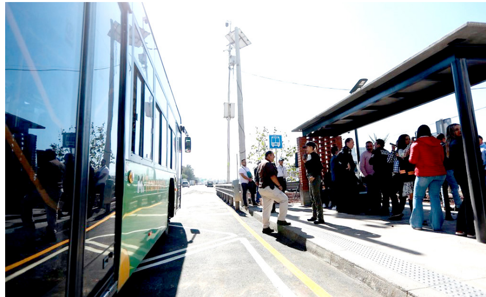
El presidente municipal acudió a la inauguración acompañado de usuarios y vecinos.

“Para nosotros era muy importante que ustedes, como representantes vecinales, nos acompañen y que podamos hacer esta inauguración de un tema que era una demanda permanente en esta zona, los paraderos seguros, en esta carretera, que valga decirlo, la carretera a Chapala es una de las vialidades principales y que mayores bondades nos dan, pero también que tiene las mayores complicaciones de accidentes. Entonces, queremos, en la parte que nos corresponde del municipio, seguir en la prevención, queremos una