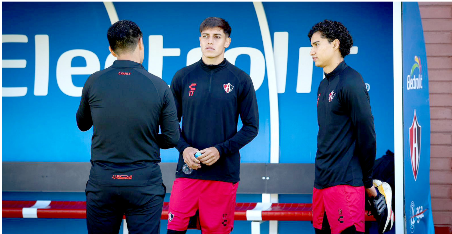
En su regreso a los entrenamientos, de inmediato se pusieron a disposición del técnico Gonzalo Pineda.