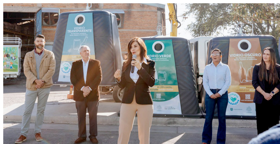
La intención es reducir el desecho de material que puede reciclarse.

directora de Medio Ambiente, explicó que Limpia Guadalajara es la apuesta para reducir la generación de residuos que llegan a los vertederos, ya que la mayoría pueden ser reciclados.