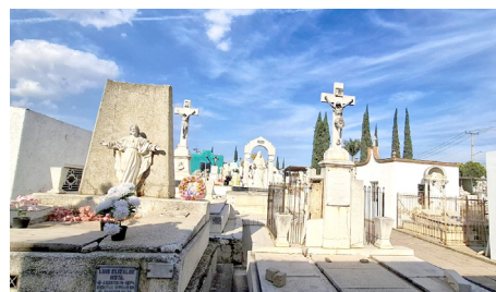
El municipio lanzó una campaña para meter en cintura a deudores.