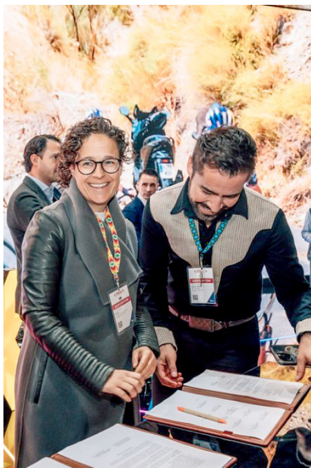
Posicionará a los puertos del Pacífico Mexicano como destinos de clase mundial.