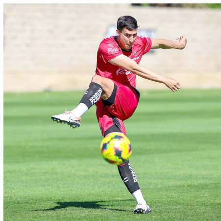
Los jugadores continúan con su preparación de cara al próximo duelo.

Plate de Argentina. Al no tratarse de una Fecha FIFA, el entrenador nacional tuvo que recurrir únicamente a futbolistas del mercado local y algunas de las principales