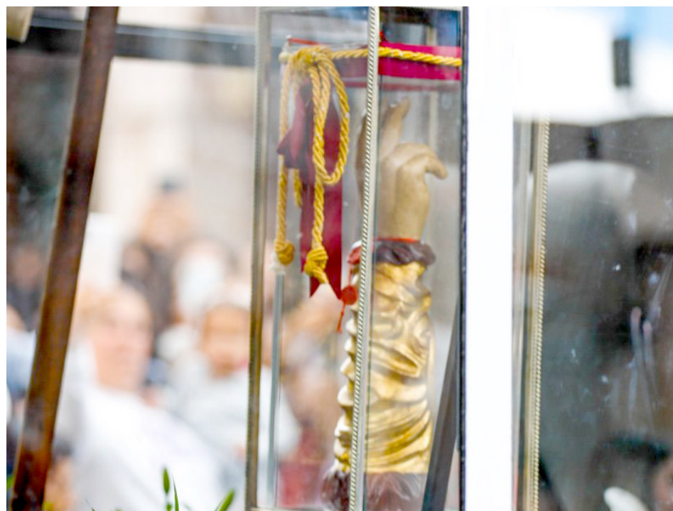
Será a las 9:30 de la mañana cuando la reliquia arribe a la Catedral Metropolitana.

Dependencias tapatías trabajarán para salvaguardar el bienestar de los fieles que acudan a la visita en el Centro