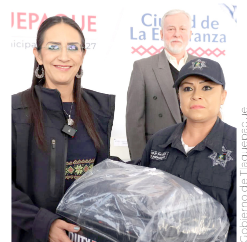
La alcaldesa dijo que esperan dar mejores herramientas a los elementos.