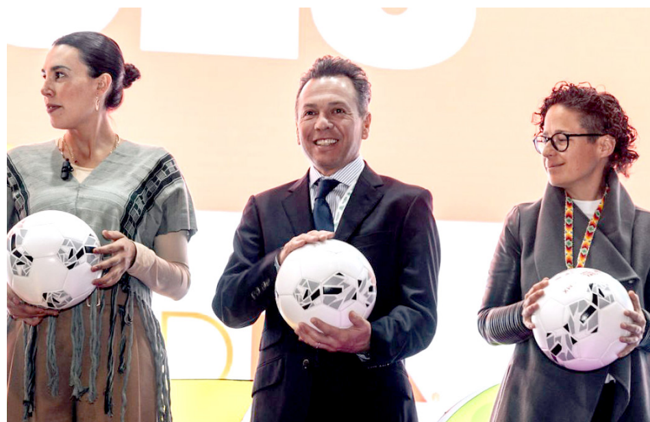
Detallaron que el Estadio Akron albergará cuatro partidos de la Copa Mundial de la FIFA 26.