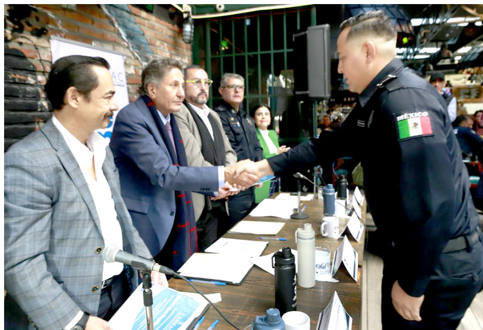
Buscan apoyar a los policías que a diario resguardan estos negocios.

En Puertas Abiertas participan más de 50 restaurantes y establecimientos de comida que se encuentran en el municipio de Zapopan, con los