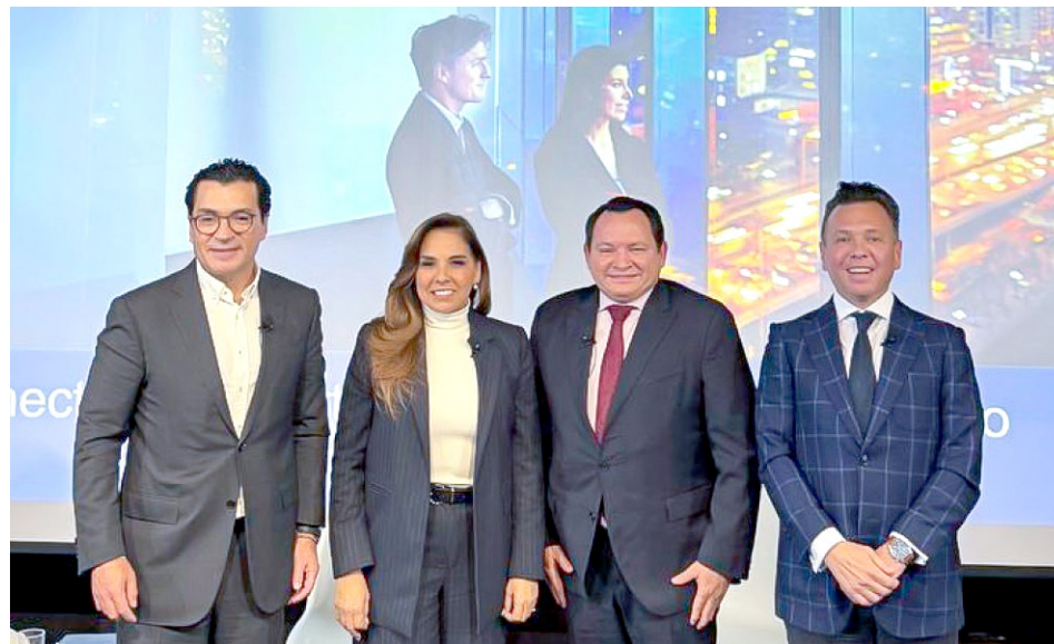
Jalisco lleva una agenda estratégica para consolidar a la entidad como un referente global.

El Gobernador destacó las ventajas competitivas de la entidad por su cercanía con Manzanillo y el crecimiento de la industria de los semiconductores