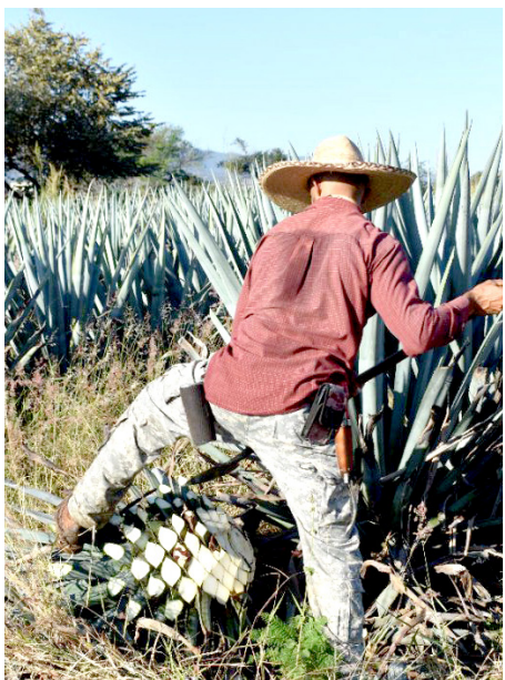
El tequila sigue conquistando paladares en México y alrededor del mundo.