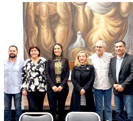
Buscarán gestionar recursos, establecer alianzas y mucho más.