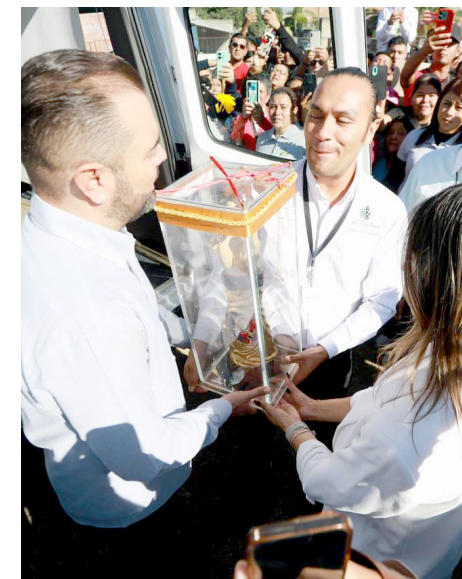
Gobierno de Tlajomulco