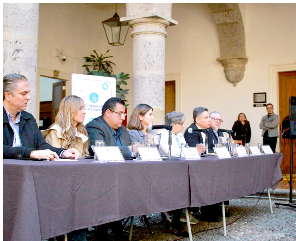
Los diputados tienen contempladas seis acciones para este proyecto.

Se fomentará la cercanía con los legisladores para que conozcan quiénes son, qué iniciativas impulsan