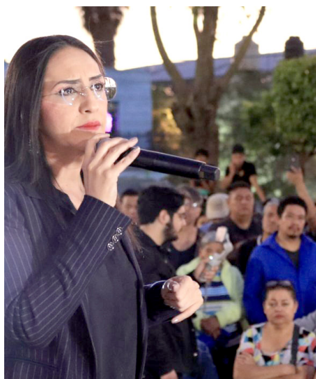
El programa arrancó en San Martín de las Flores.