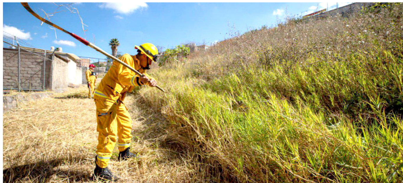
Retiraron maleza y disminución de material combustible.

Se atenderán áreas como la Barranca de Huentitan, el Bosque Los Colomos y otros bosques urbanos. Añadió que también se apoyan a otros municipios en caso de incendios forestales, como los que ocurren en el Bosque La Primavera, y recientemente, en el municipio de Tapalpa.