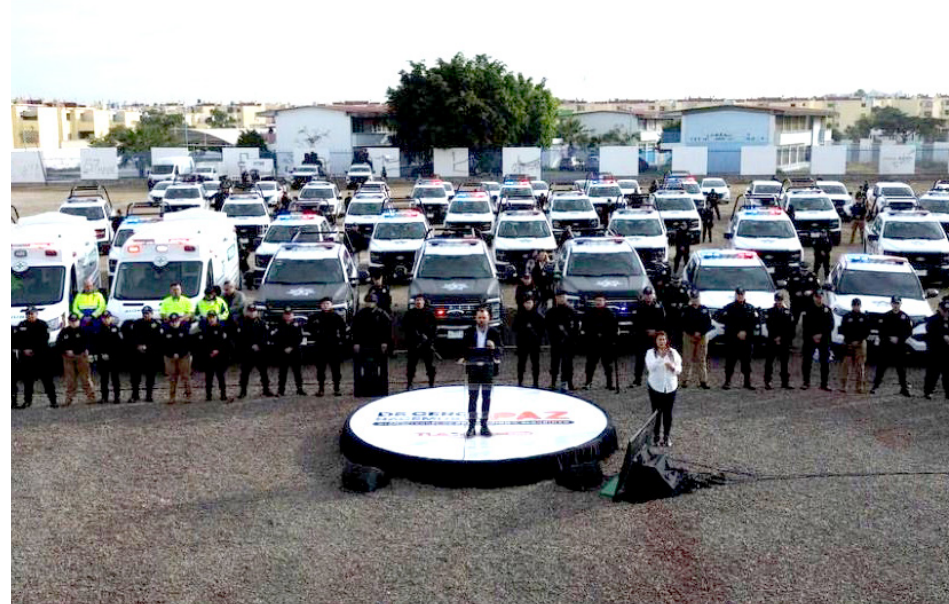
La coordinación y cooperación entre las instituciones de seguridad es esencial, dijo el alcalde.

“El artículo 115 constitucional es muy claro, la responsabilidad que tienen los municipios es la prevención del delito, por eso es importante para nosotros platicarles lo que queremos