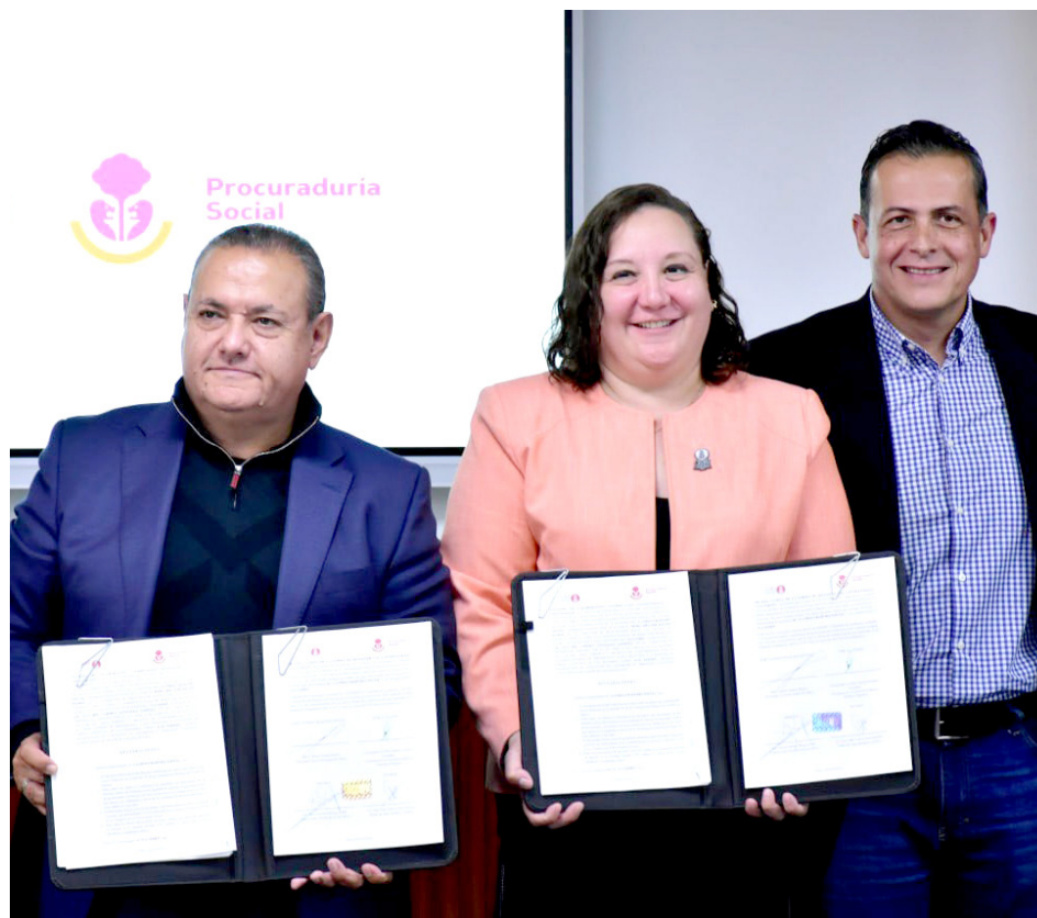
Se informó que la CEDHJ apuesta al tema de la capacitación a través de sus cursos.

La alianza se da para consolidar objetivos comunes entre ambas instituciones como la procuración de justicia y promoción de la dignidad humana