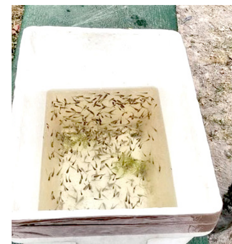
Los peces se colocan en pozos, piletas o recipientes en los que se almacena agua limpia.

- Lugares que no pueden vaciarse fácilmente y donde los mosquitos suelen depositar sus huevos.