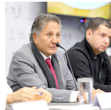
Gobierno de Zapopan

Buscan la participación de 10 mil personas, dijo el primer edil.