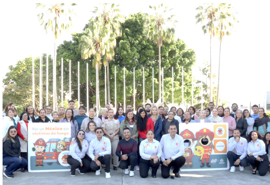
La meta es educar en la prevención a cerca de 5 mil niñas y niños de entre.