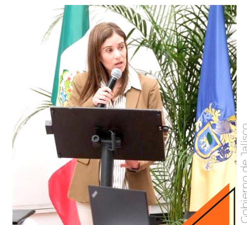
El primer taller fue enfocado en la región Altos Sur.