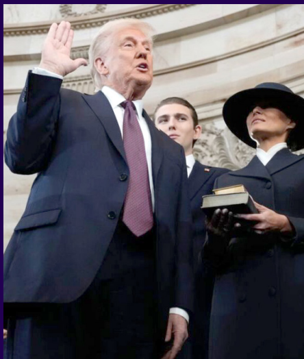
@realdonaldtrump/Donald Trump/El País

Realizó el juramento para su segundo mandato.