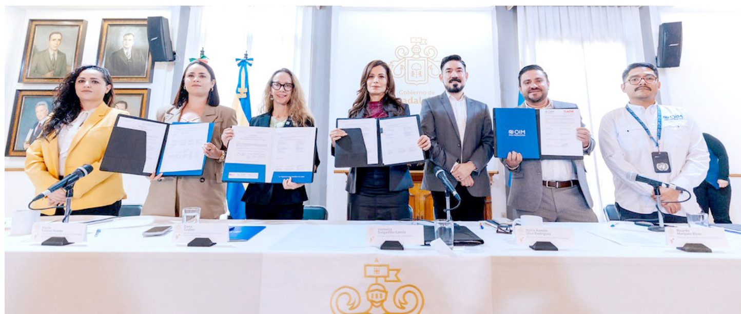
Gobierno de Guadalajara

Firmaron un acuerdo para garantizar el respeto a los derechos humanos de paisanos que pudieran ser repatriados desde Estados Unidos