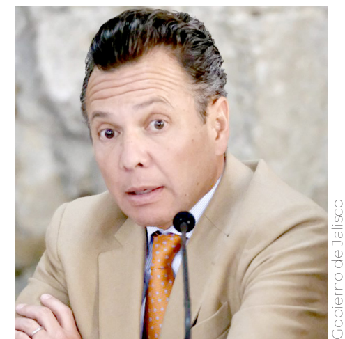
El Gobernador reconoció que sigue habiendo extorsiones desde los centros de reclusión.

“El armamento, no se nos olvide, es propiedad del gobierno del estado de Jalisco. No es de las comisarías municipales, es del gobierno del estado de Jalisco. Tenemos más de 20 multas por el mal manejo del armamento en municipios que nos ha impuesto la Secretaría de la Defensa Nacional y ya se les advirtió a los comisarios que no