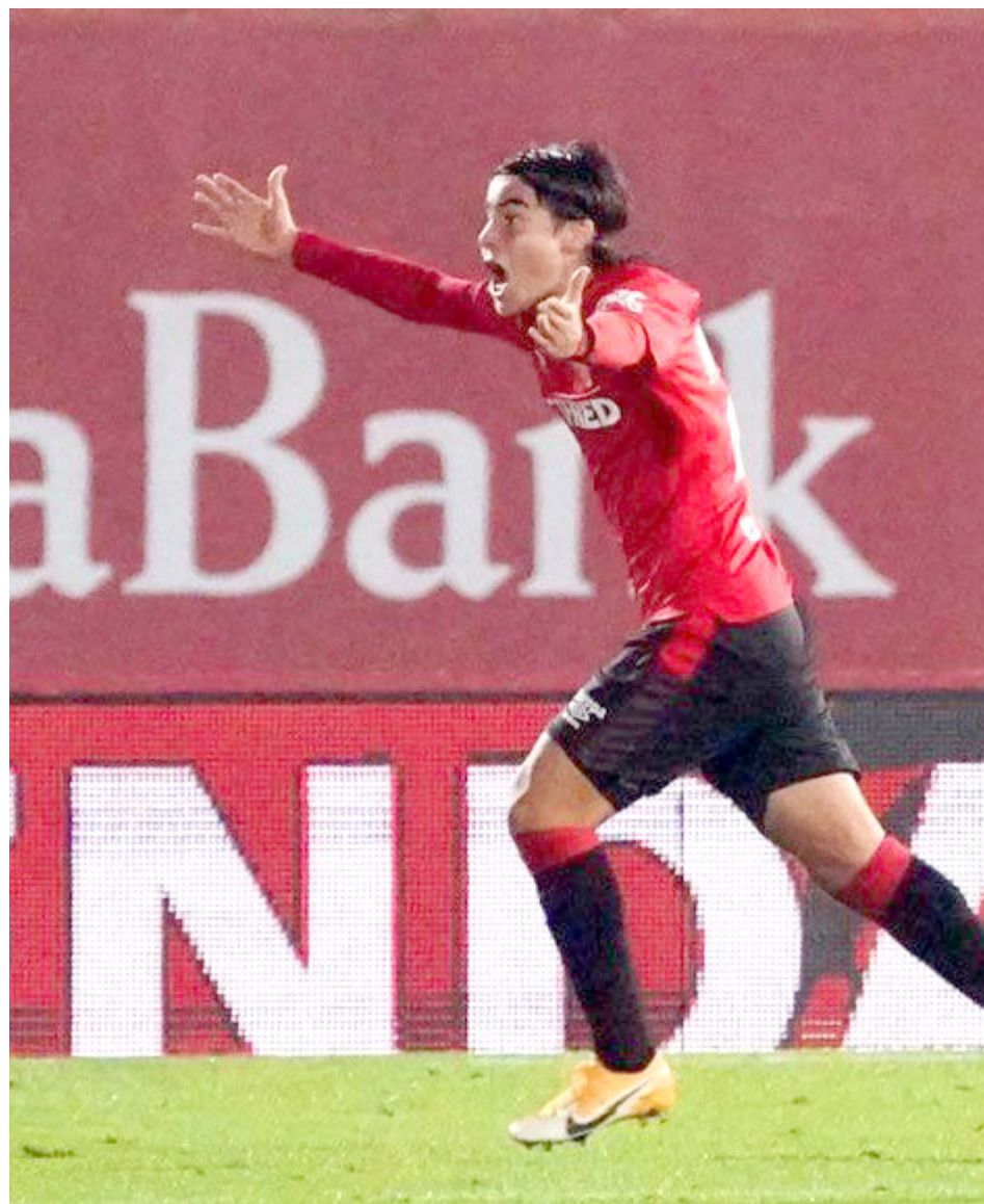
El propio Romero había dado su visto bueno a la posibilidad de ir al Guadalajara.

En las últimas horas el tema podría haberse complicado y la llegada del futbolista de 20 años ya no luce tan cercana