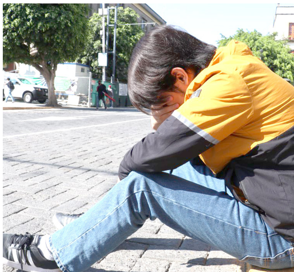
Durante los meses de enero y febrero, estos trastornos se incrementan.

“El Servicio de Atención Psicológica tiene una línea directa que funciona las 24 horas del día los 365 días del año, ahí se les da la orientación y