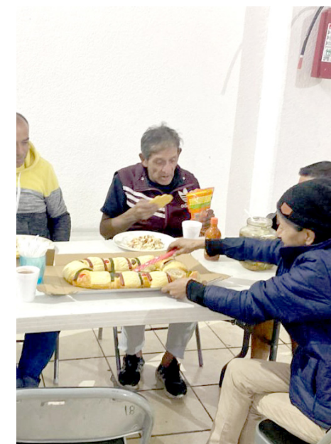
El municipio abrió un nuevo refugio temporal.

El monitoreo continuo de las temperaturas en zonas críticas es clave para detectar y atender riesgos de manera oportuna, concluyó el funcionario.