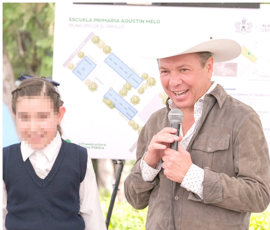
La Escuela Primaria Agustín Melgar fue intervenida con recursos del Fideicomiso Fondo.

Además, el mandatario anunció el equipamiento tecnológico en las aulas y el domo para el patio cívico, como parte de una segunda etapa de intervención en esta escuela y manifestó que se trabajará en la