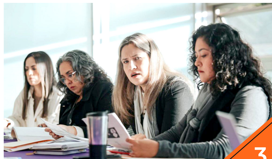
Fortalecerán marcos normativos que sustenten los procesos.

Con acciones enfocadas en la efectividad del Protocolo Alba — crucial para encontrar con vida a las personas y proteger su integridad física y psicológica—.