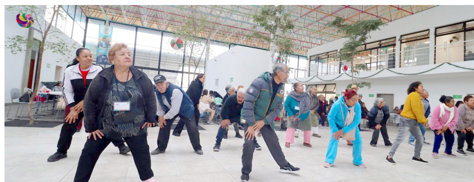
Gobierno de Zapopan

Esto, debido a que durante el envejecimiento del ser humano es normal que gradualmente se vaya perdiendo masa muscular, lo que puede provocar desequilibrio al caminar, caídas frecuentes y la reducción de movilidad a causa de fracturas que