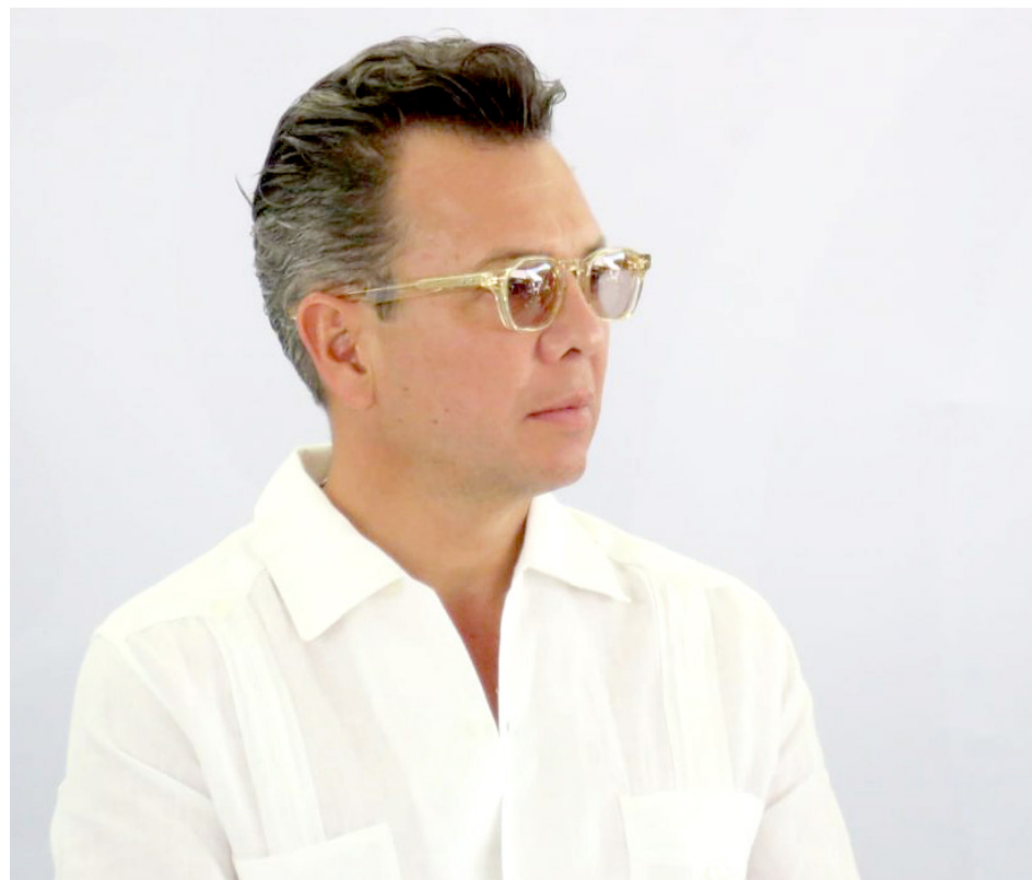
Señaló que las funciones de transparencia pasarán a la Contraloría estatal.

Manifestó su preocupación, ya que, ante la desaparición del ITEI, no habrá organismos que vigilen y garanticen la transparencia en los 125 municipios