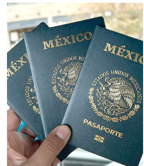
Buscan evitar saturaciones previo a la Semana Santa y Pascua.