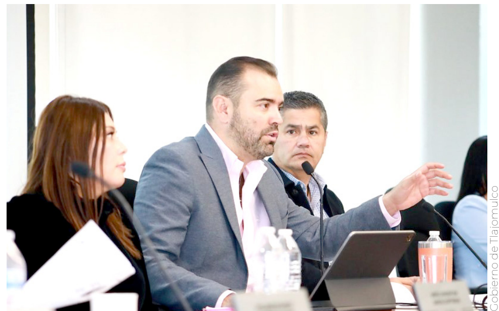
Gobierno de Tlajomulco

Para el Gobierno de Tlajo, la estrategia de seguridad es esencial y a largo plazo, por lo que el