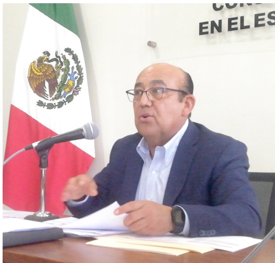
El delegado del INE en Jalisco, dijo que esperan la llegada de recursos adicionales.

Esto representaría casi el 50 por ciento de las casillas instaladas en la pasada jornada electoral (4140 casillas), de ellas, 4 casillas serían especiales. Mencionó que, a partir del 11 y hasta el 28 de febrero, si alguna persona pierde su credencial ya sea por robo o extravío,