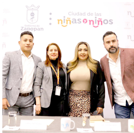
Gobierno de Zapopan

Los talleres se realizarán el 30 y 31 de enero, así como el 4 de febrero.