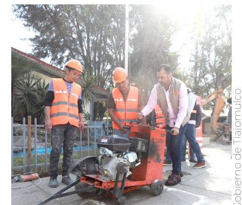
Gobierno de Tlajomulco

En este espacio, la inversión será de 2.6 millones de pesos, ya que se ampliarán las áreas comunes para ofrecer mejores servicios a la comunidad, explicó el alcalde, quien destacó la importancia de mantenerse siempre cerca de las familias y de la población que más lo necesita.