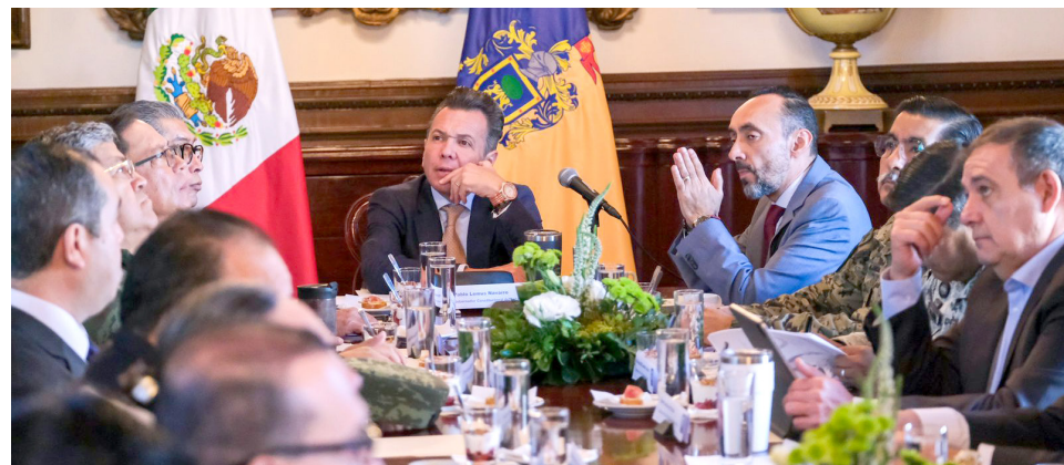
Pablo Lemus encabezó la reunión de seguridad.

En el caso de Puerto Vallarta se reforzará la presencia militar y estatal sobre la Carretera a Nogales, así como en las vialidades que conectan a los estados de Jalisco y Nayarit, para que las y los visitantes estén seguros durante sus traslados en territorio jalisciense.