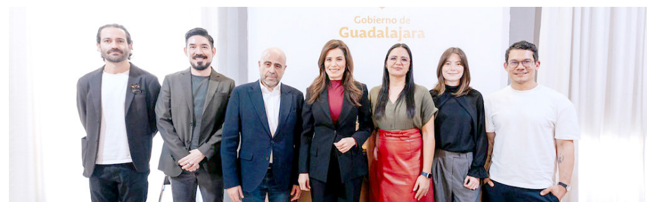
Gobierno de Guadalajara

Cabe señalar que, ArtWknd GDL 2025 es un evento internacional que reunirá lo mejor del arte, el diseño y la creatividad contemporánea,