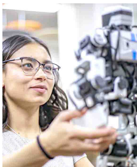
La apuesta para tener empleos de calidad recae en la formación de talento.