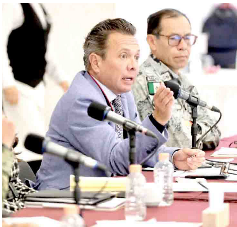
El gobernador Pablo Lemus destacó que el trabajo coordinado entre los cinco estados del país.

La reunión tuvo lugar en el Estado de Zacatecas con la intención de unir fuerzas para garantizar el bienestar de todos los habitantes