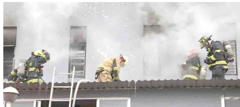
Bomberos de Guadalajara

"Nos solicitan el apoyo los elementos de Protección Civil y Bomberos por un incendio en el nivel tres que es el área de dormitorios de la Comisaría Regional, de inmediato llegaron al lugar compañeros y compañeras de Protección Civil y Bomberos de Guadalajara así como del Estado, evacuamos a todo el personal",