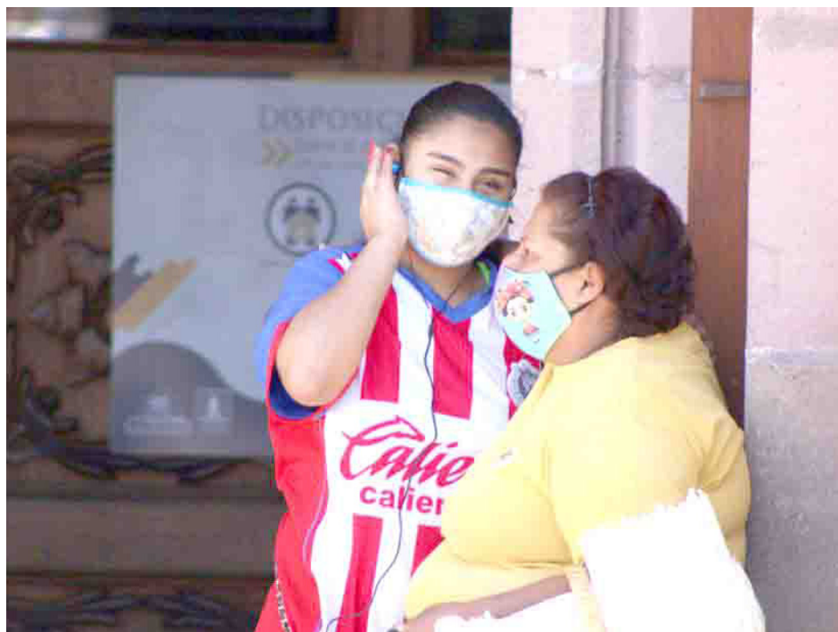
En el Estado se realiza la vigilancia epidemiológica constante; se indica que el incremento es estacional.

Solo hay vigilancia por unos casos en el norte de China, sin que esto afecte a México, mencionó el secretario de Salud, Héctor Raúl Pérez