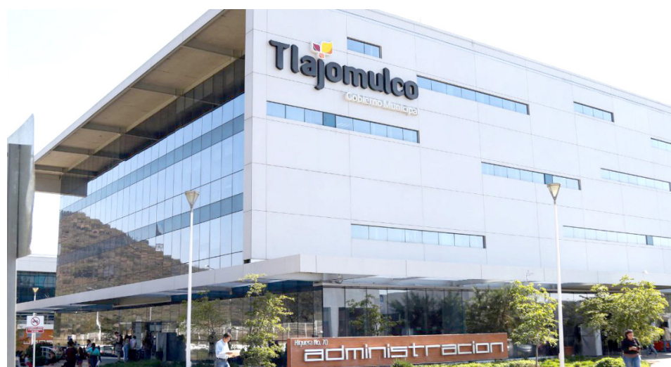
Gobierno de Tlajomulco

Además de las recaudadoras, los contribuyentes podrán pagar vía internet en el portal oficial del Gobierno