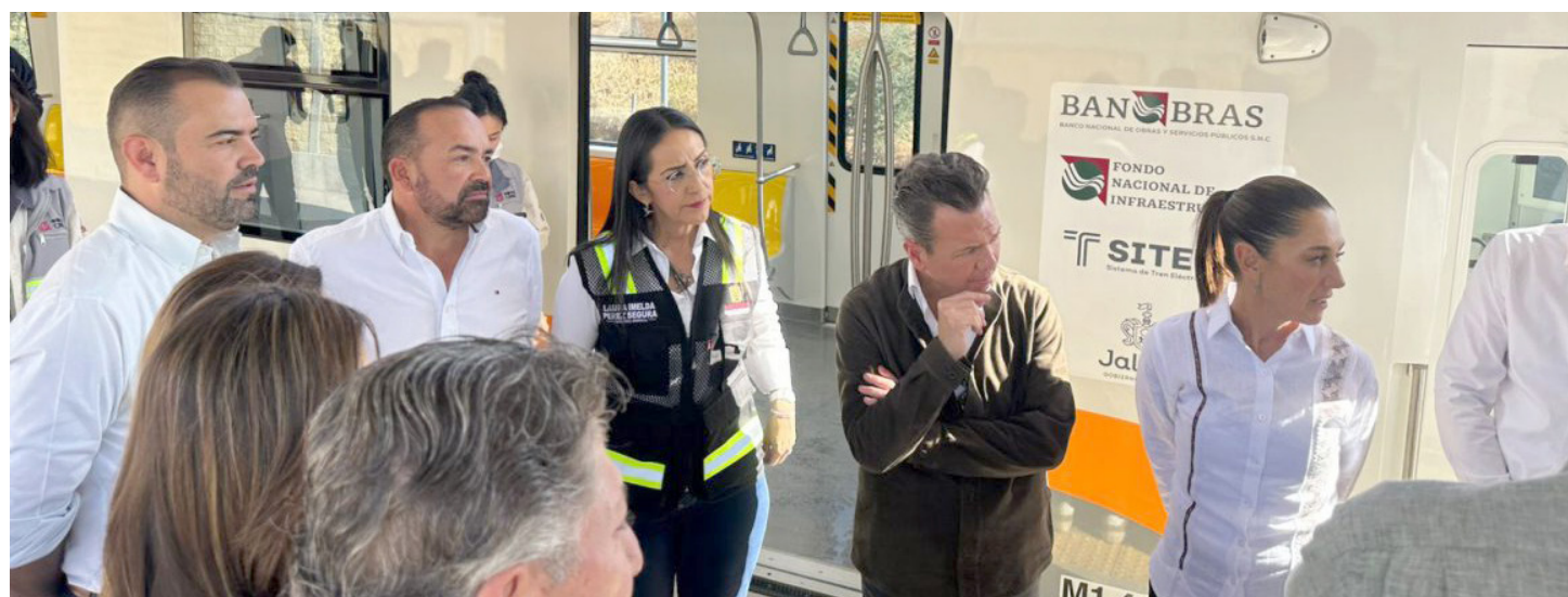
Su incorporación es clave para garantizar un servicio de transporte público adecuado para la todo el municipio.