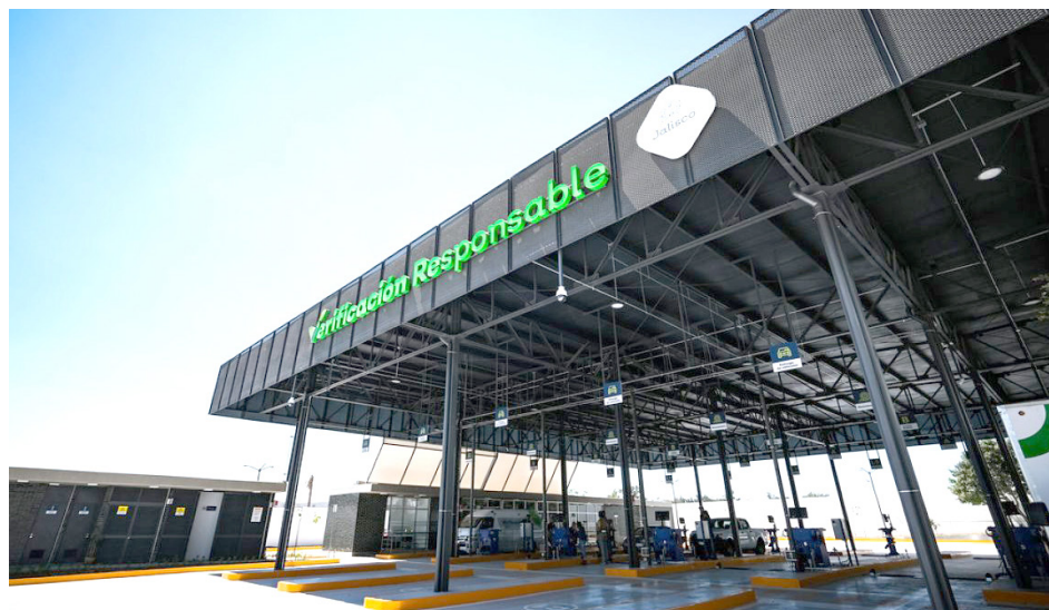
En 2024 el pago de estos conceptos alcanzó un costo total de 3 mil 500 pesos.

Se detalla que el Paquetazo 3×1, que permite obtener el refrendo, la sustitución de placas y la verificación responsable será por un solo pago de