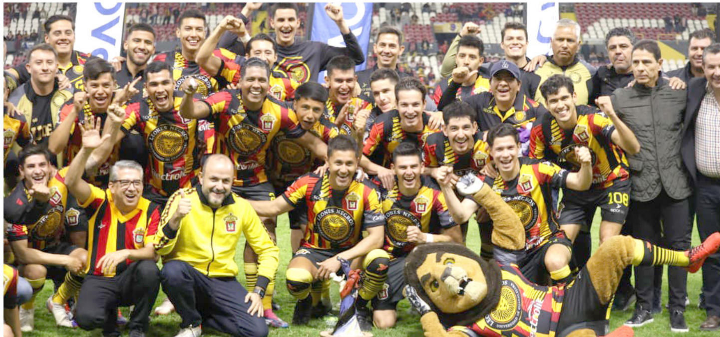
Leones Negros conmemora su 50 aniversario.