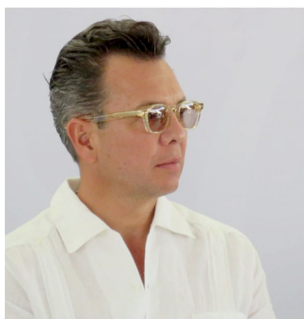
Hoy se instalará el de Costa Norte Sierra Occidental.

El compromiso del Gobierno de Jalisco con la seguridad continúa siendo una prioridad, y la instalación de estos consejos regionales es un paso significativo hacia un esfuerzo colaborativo más efectivo.