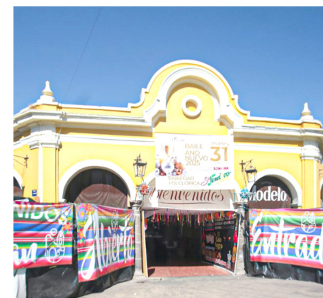
El complejo de restaurantes trabaja al 80% de su capacidad.

Por otra parte, los representantes de los comerciantes exponen que los costos de la restauración del Parián podrían requerirles alrededor de 15 y 20 millones de pesos, y reconoció que se han tenido pérdidas de alrededor de 5 millones de pesos, por la baja afluencia de visitantes, y el tiempo que estuvo cerrado el espacio.