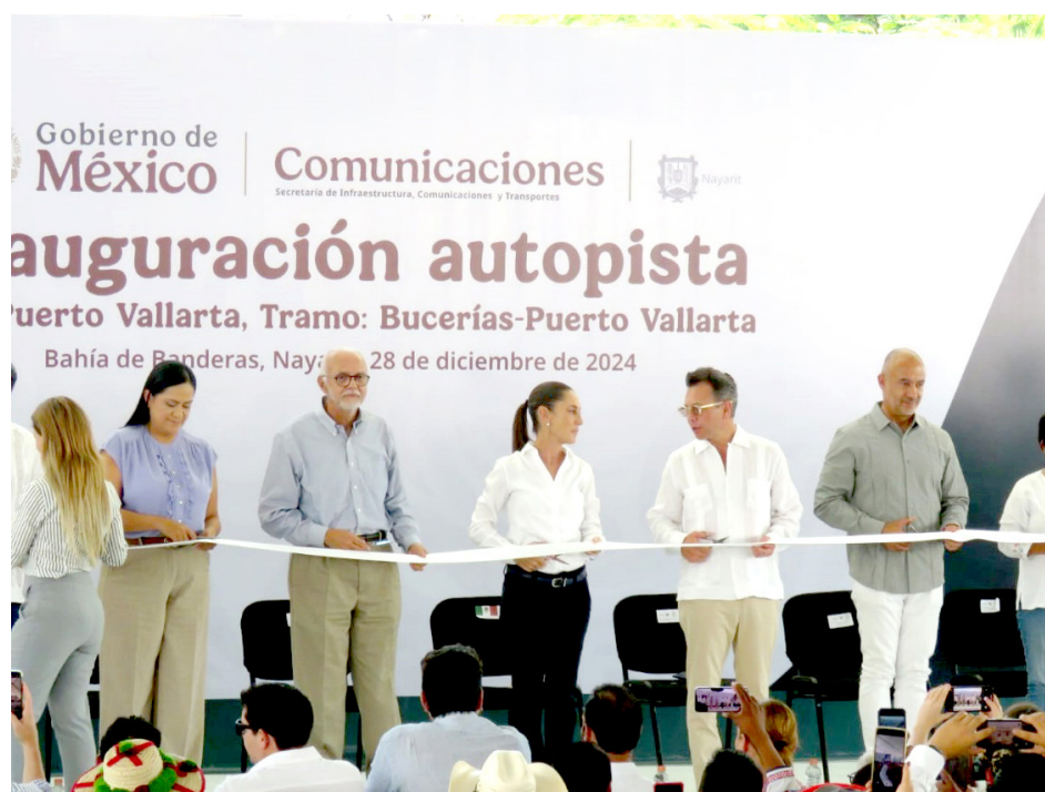
El tramo mejorará la conectividad de esta importante zona.

La obra beneficia a seis municipios de Jalisco y Nayarit, generando más de 10 mil empleos en su construcción