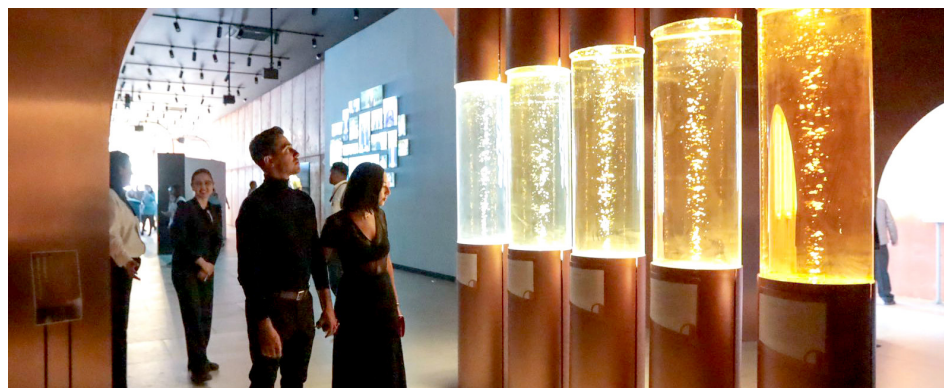
El Tequila Lab fue recientemente inaugurado.

La única excepción es que los museos y galerías permanecerán cerrados el 1