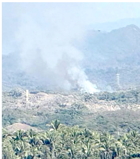
PC Puerto Vallarta

El hecho se registró en el basurero ubicado en la zona aledaña al campo de Golf Vista.