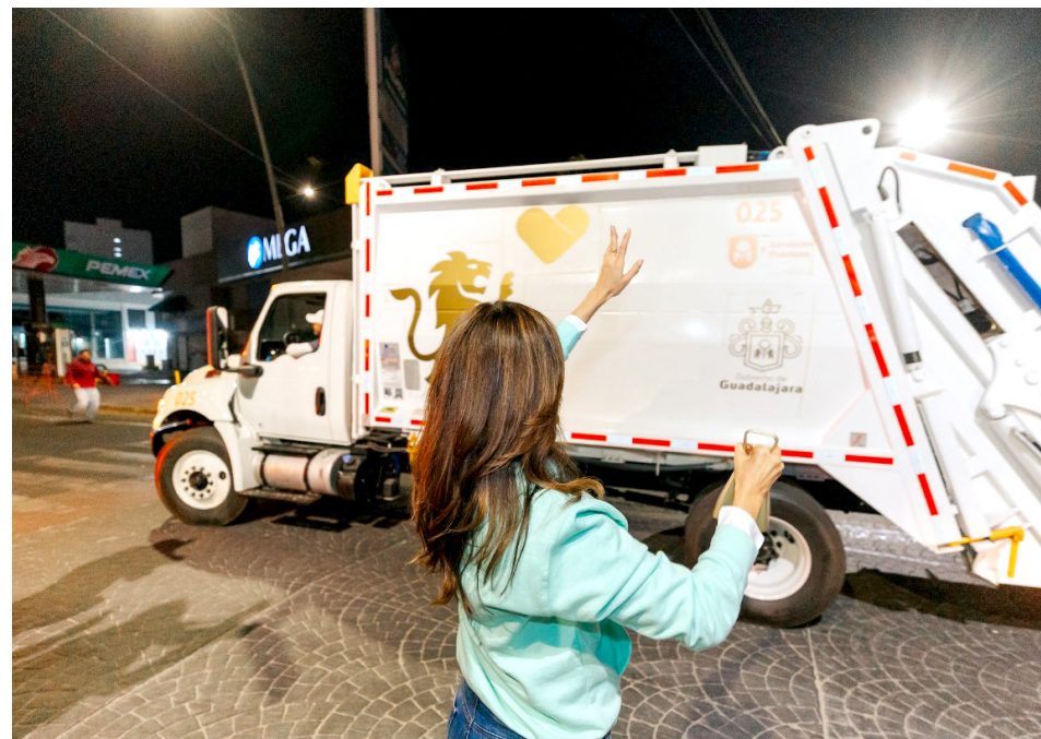
Gobierno de Guadalajara

En los primeros cinco días que ha operado el OPD Limpia Guadalajara con 160 camiones recolectores de basura que compraron han recolectado