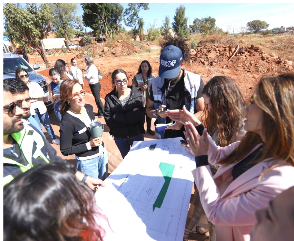
Gobierno de Jalisco

A partir de esta primera reunión, el seguimiento consistirá en ver cuál será el espacio más viable para la construcción del centro, los términos en que se realizará