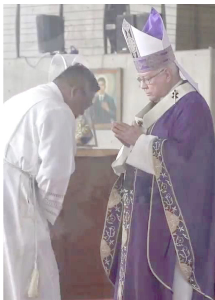
El Cardenal José Francisco Robles Ortega presidió la misa.

Por su parte, los presbíteros tienen entre sus responsabilidades enseñar los principios del evangelio, presidir la eucaristía y administrar sacramentos como el bautismo, la unción de los enfermos o el matrimonio.