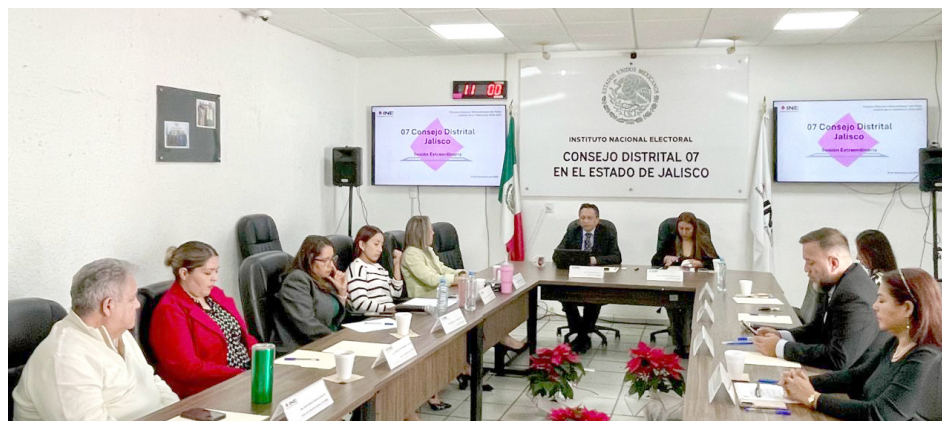
Forma parte del inicio de la organización del Proceso Electoral Extraordinario 2024-2025.

Esto, para dar inicio a la organización del Proceso Electoral Extraordinario 2024-2025 para llevar a cabo la elección de la totalidad de los cargos de Ministras y Ministros de la Suprema Corte de Justicia de la Nación, las magistraturas vacantes de la Sala Superior y la totalidad de las Magistradas y Magistrados de salas regionales del Tribunal Electoral del Poder Judicial de la Federación, los integrantes del Tribunal de Disciplina Judicial, así como la mitad de los cargos de Magistradas y Magistrados de Circuito y Juezas y Jueces de Distrito,