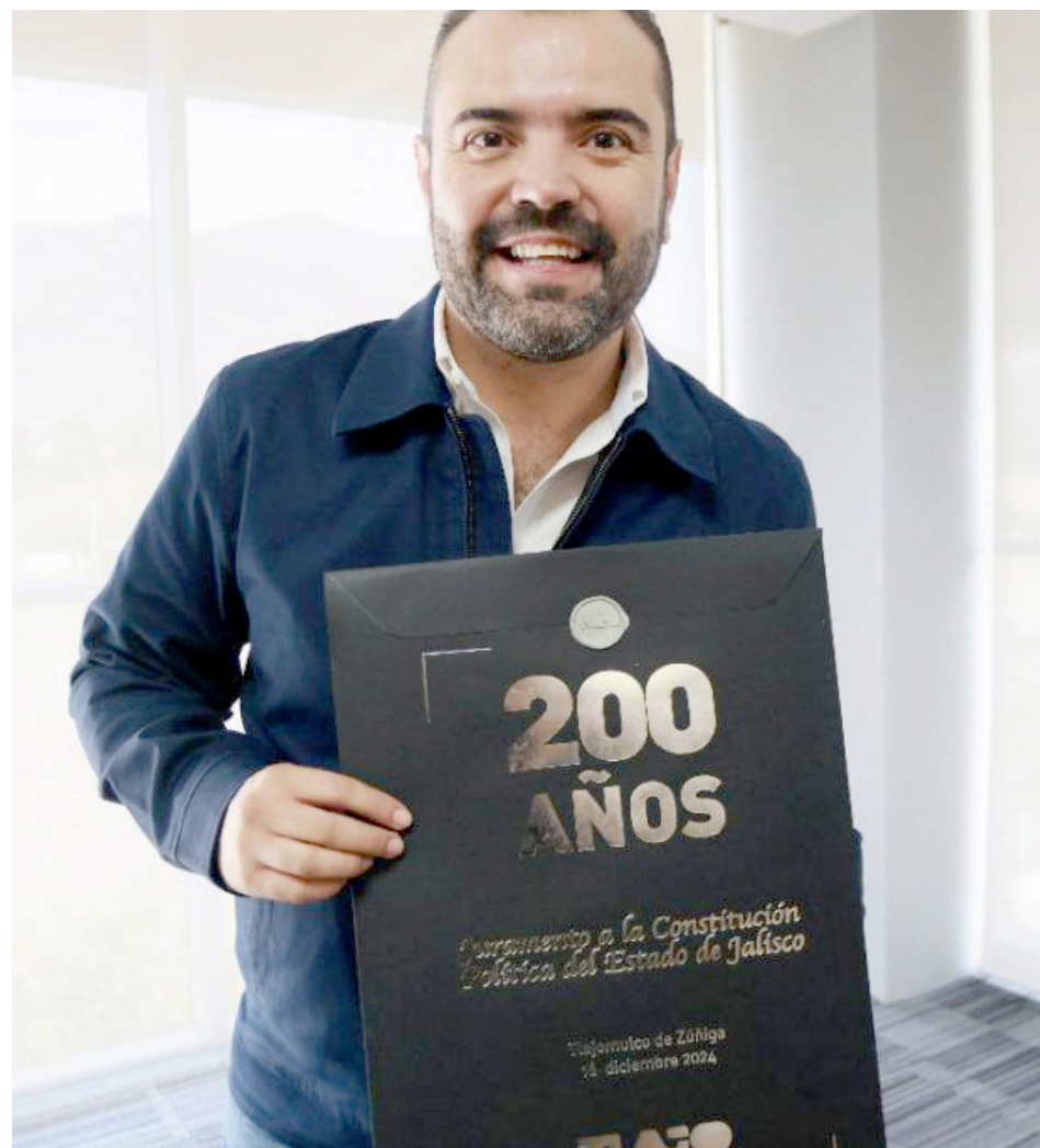
Gobierno de Tlajomulco

Por otra parte, el alcalde y los regidores recordaron la conmemoración del 76 aniversario de la Declaración Universal de los Derechos Humanos.