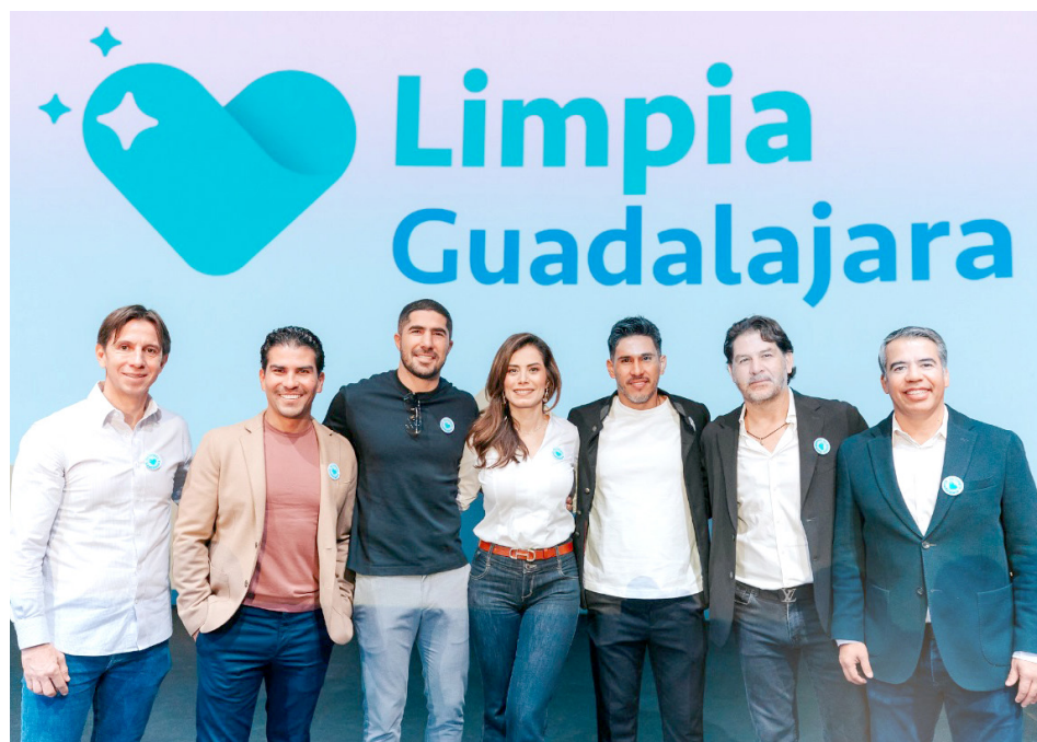
El anuncio se realizó en el Foro de Arte y Cultura de la ciudad.

“Fíjense nada más, éramos un millón seiscientos mil personas (hace 30 años) y producíamos todos los días mil 200 toneladas de basura, hoy somos un millón 400 mil personas y todos los días producimos mil 800 toneladas de basura, es decir, que pasamos de producir 700 gramos diarios de basura a casi el doble, un kilo 300 gramos de basura todos los días por tapatío y