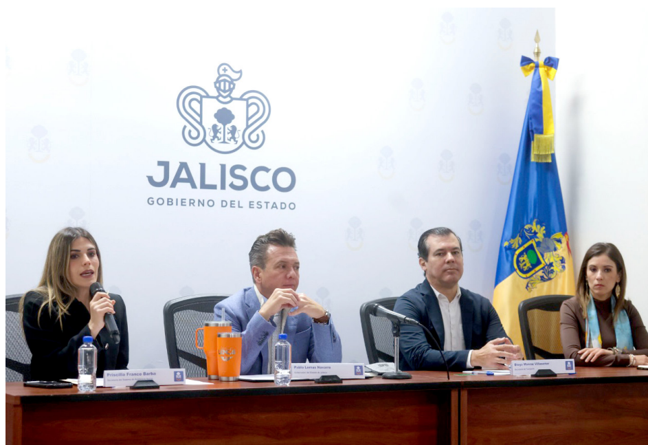
Pablo Lemus anunció el plan de destino de los 50 centavos que no se dan de cambio.

Pablo Lemus informó que usarán el Fideicomiso generado por los cambios que no dan las alcancías del transporte público para este compromiso