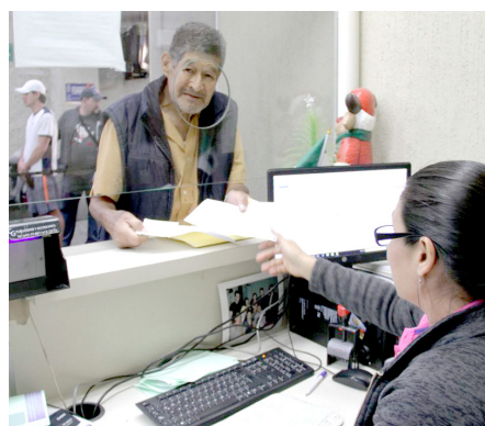
Los morosos pueden acceder a un descuento del 75%.

Los descuentos se aplicarán a multas y recargos derivados del impuesto predial, agua potable, licencias de giro comercial, licencias de anuncios