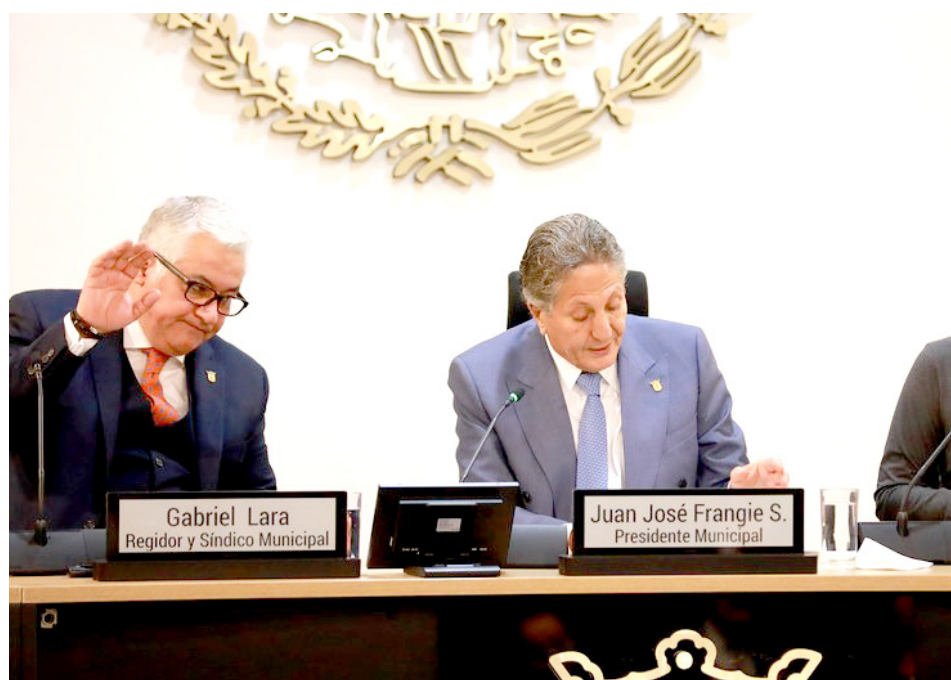
Gobierno de Zapopan

La inversión para generar espacios de calidad y seguridad para practicar deporte se mantiene, pues el Consejo