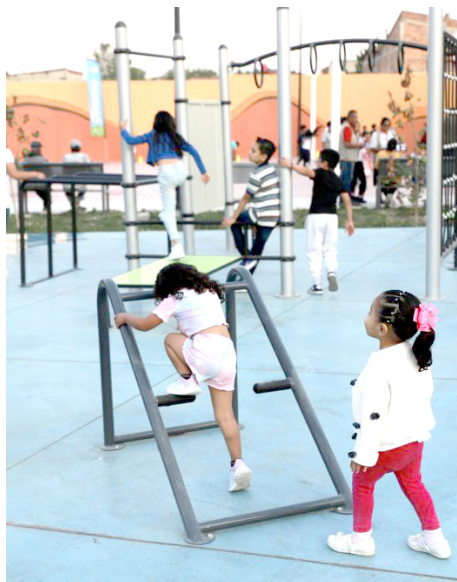
Gobierno de Zapopan

El Gobierno de Zapopan ha intervenido 69 unidades deportivas.