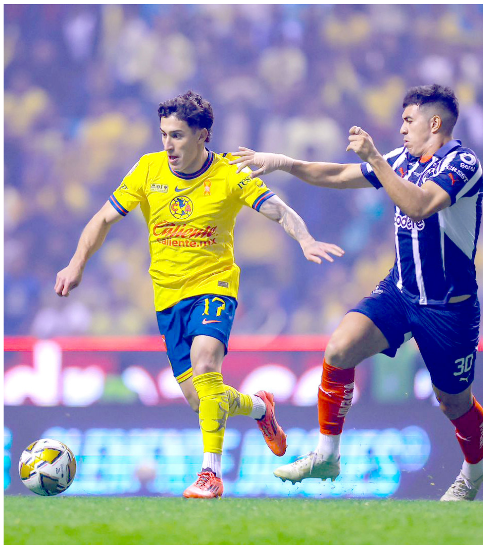
América supo concretar sus llegadas al arco rival.

El equipo de Coapa supo aprovechar la localía para vencer 2-1 al Monterrey y poner un pie cerca del tricampeonato