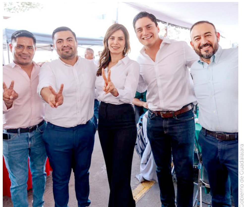
Gobierno de Guadalajara

“Trabajemos para tener una Guadalajara limpia, una navidad limpia,