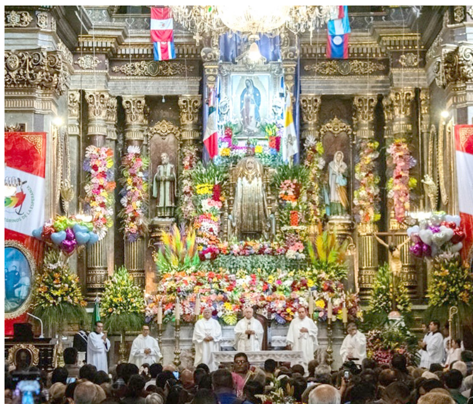
Policías de Guadalajara actuaron en coordinación con elementos de la Secretaría de Seguridad del Estado.

Pararse frente a la imagen, observarla detenidamente y saber que intercede