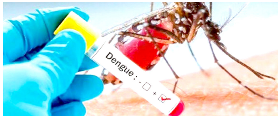
Se registraron 912 casos nuevos.

En total, Jalisco acumula 19 mil 854 casos de dengue, distribuidos en nueve mil 416 casos de dengue no grave, nueve mil 615 de dengue con signos de alarma y 823 de dengue grave. Este miércoles, la Dirección General de Epidemiología informó sobre la