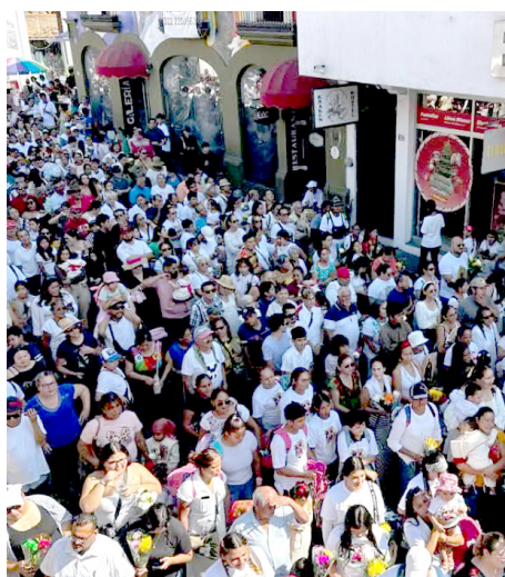
Atribuyen a la Virgen de Guadalupe salvarles la vida tras un accidente.

Al arribo de esta peregrinación que congrega a más de 30 mil personas, las campanas de la parroquia.