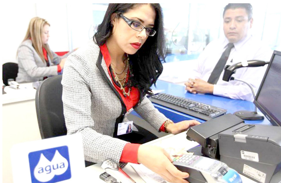
El pago puede hacerse en efectivo o con tarjetas bancarias de crédito y débito.

Es una oportunidad de terminar con su situación de morosidad y evitar molestias o reducción en caso de uso habitacional y suspensión en caso de giros comerciales.