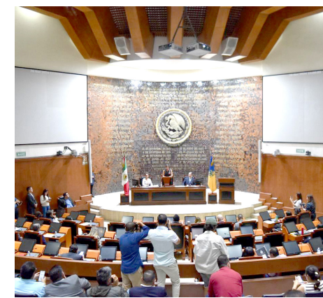
Buscan desde el Congreso romper con el patriarcado.

Destacó que históricamente se ha relegado a las mujeres en cargos de primer nivel dentro del sistema judicial estatal, y todavía hoy existen obstáculos para que las mujeres ocupen cargos de alta responsabilidad; hoy en día, menos de 20 por ciento de las comisiones de trabajo del Tribunal son presididas por mujeres, una realidad que debe cambiarse, para que Jalisco se encuentre verdaderamente a la vanguardia nacional en paridad de género, explica la diputada.