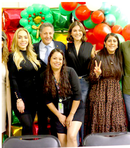
Gobierno de Zapopan

La inversión fue de un millón 200 mil pesos, informó el primer edil.