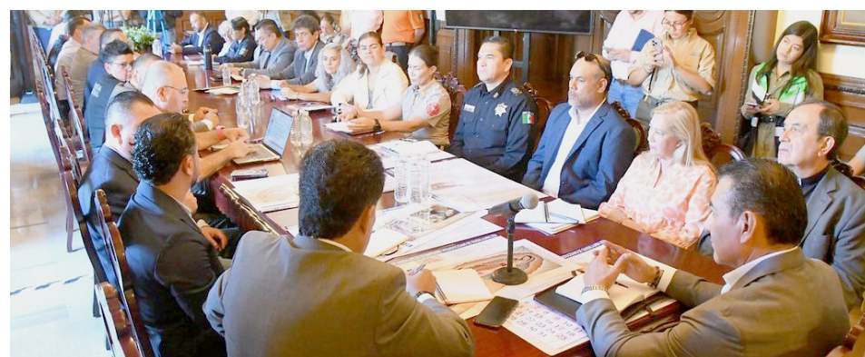
Se mantendrá la vigilancia de todos los asistentes a los festejos de la Virgen de Guadalupe.

El despliegue iniciará a las 6:00 horas del 11 de diciembre y culminará la noche del 12 de diciembre, para salvaguardar la integridad de los más de 700 mil fieles que se esperan. Con un estado de fuerza de más de 100 elementos municipales, la seguridad y tranquilidad de los visitantes será resguardada por elementos de la Comisaría de Seguridad Ciudadana de Guadalajara, la Coordinación Municipal de Gestión de Riesgos, Protección Civil, y Bomberos, el Sistema DIF