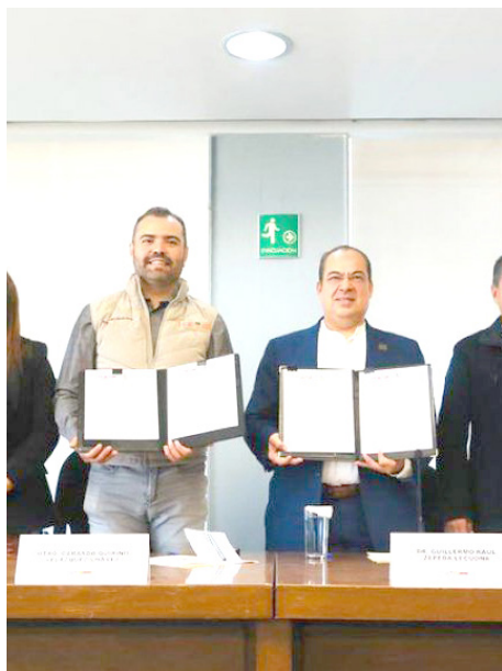
Firmaron un convenio con el Instituto de Justicia Alternativa.

Oscar El Diablo Castellanos, exjugador profesional, resaltó la importancia de generar espacios como este para las mujeres en el deporte.