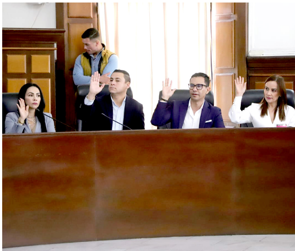
La iniciativa fue turnada a las Comisiones edilicias de Gobernación, Reglamentos y Vigilancia.