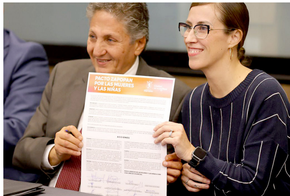
Gobierno de Zapopan

Pacto Zapopan por las Mujeres y Niñas se configura como una acción de política pública de prevención que incentive a la administración municipal, para que, a través de sus diversos órganos, dependencias y funcionarios