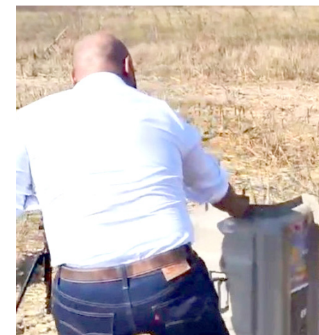
El animal había resultado herido, pero ya está en buenas condiciones.

Es importante recordar que se trata de una especie migratoria, que está llegando desde Canadá y Estados Unidos a pasar el invierno en nuestro país, por lo que va a ser muy común verles desde diciembre hasta el mes de abril.