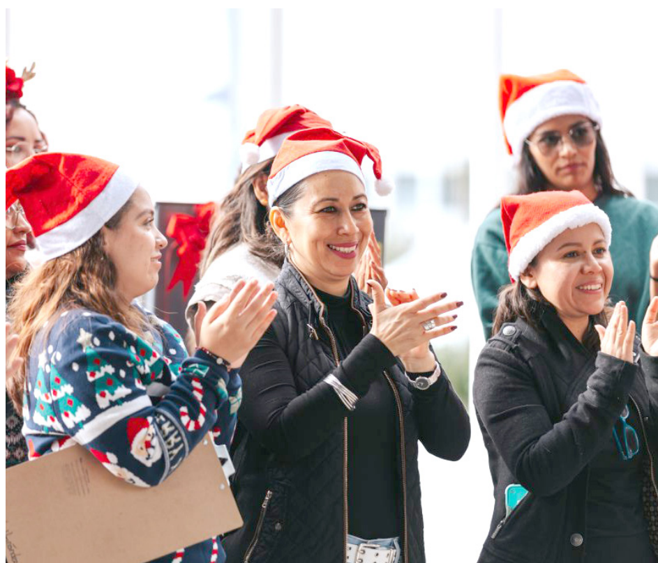
Esta iniciativa acompaña a familiares de personas desaparecidas.

La presidenta de Guadalajara explicó que, a través de este programa, se ha construido un hogar que busca, además del dar apoyo y acompañamiento, generar un espacio seguro y de esperanza. "Este es el gobierno que