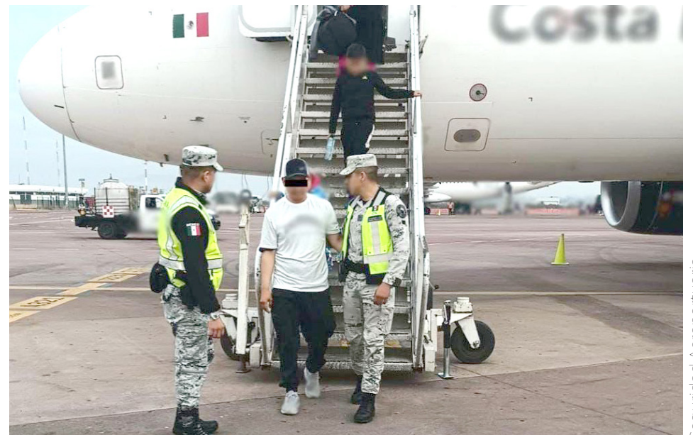
El pasajero fue puesto a disposición de las autoridades correspondientes.

De la misma forma Volaris señala que actuará como parte acusadora para asegurar que el desquiciado tripulante