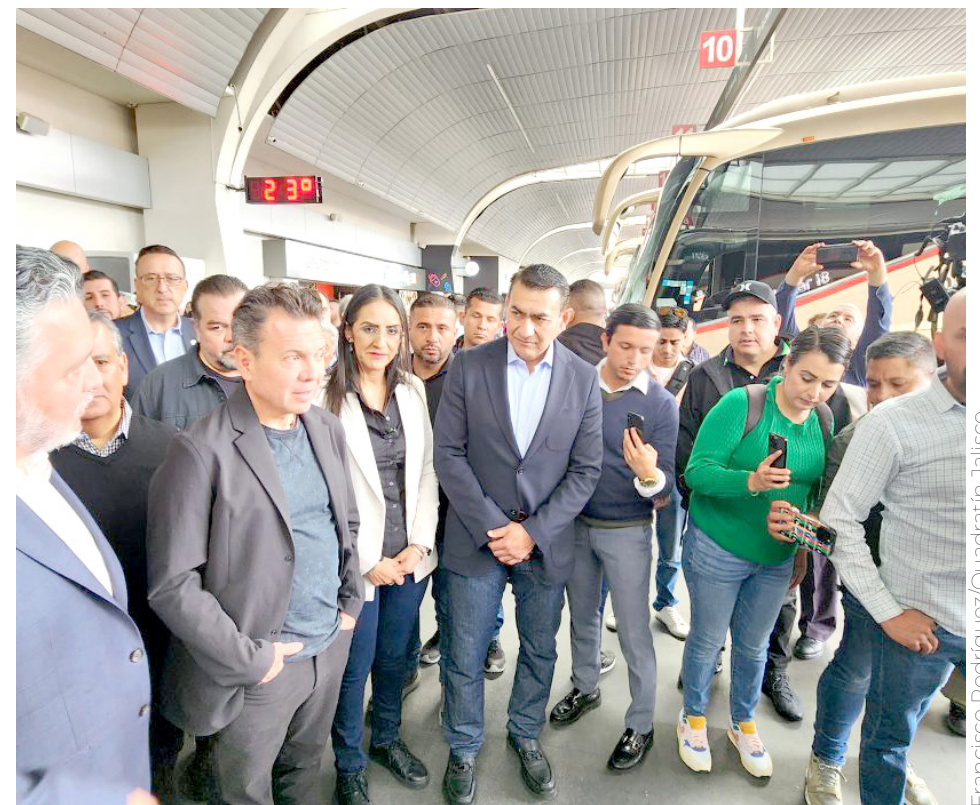
Autoridades realizaron un recorrido por los módulos y andenes de la Nueva Central Camionera.