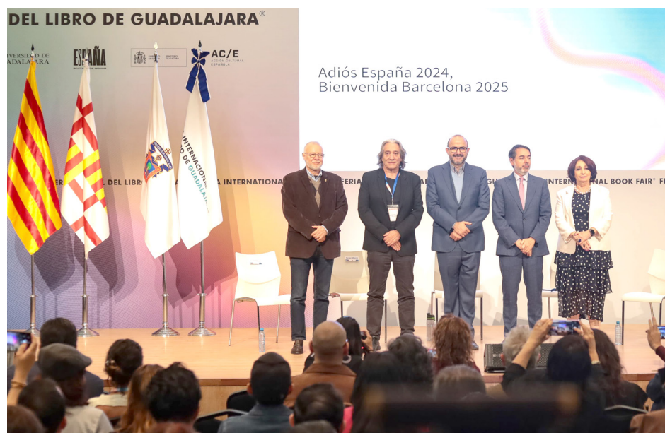
La fiesta de los libros en 2024 superó todos los récords con más de 900 mil visitantes.

Al finalizar la edición 38 de la FIL Guadalajara, fue anunciado al invitado de honor para la edición 2025