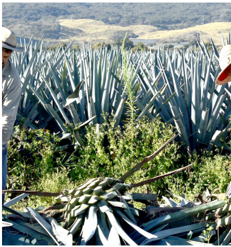
El tequila se ha consolidado como un símbolo de identidad nacional.