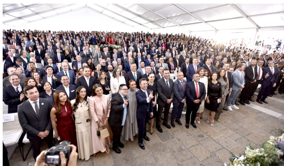
El centro cultural Cabañas se convirtió en una fiesta.