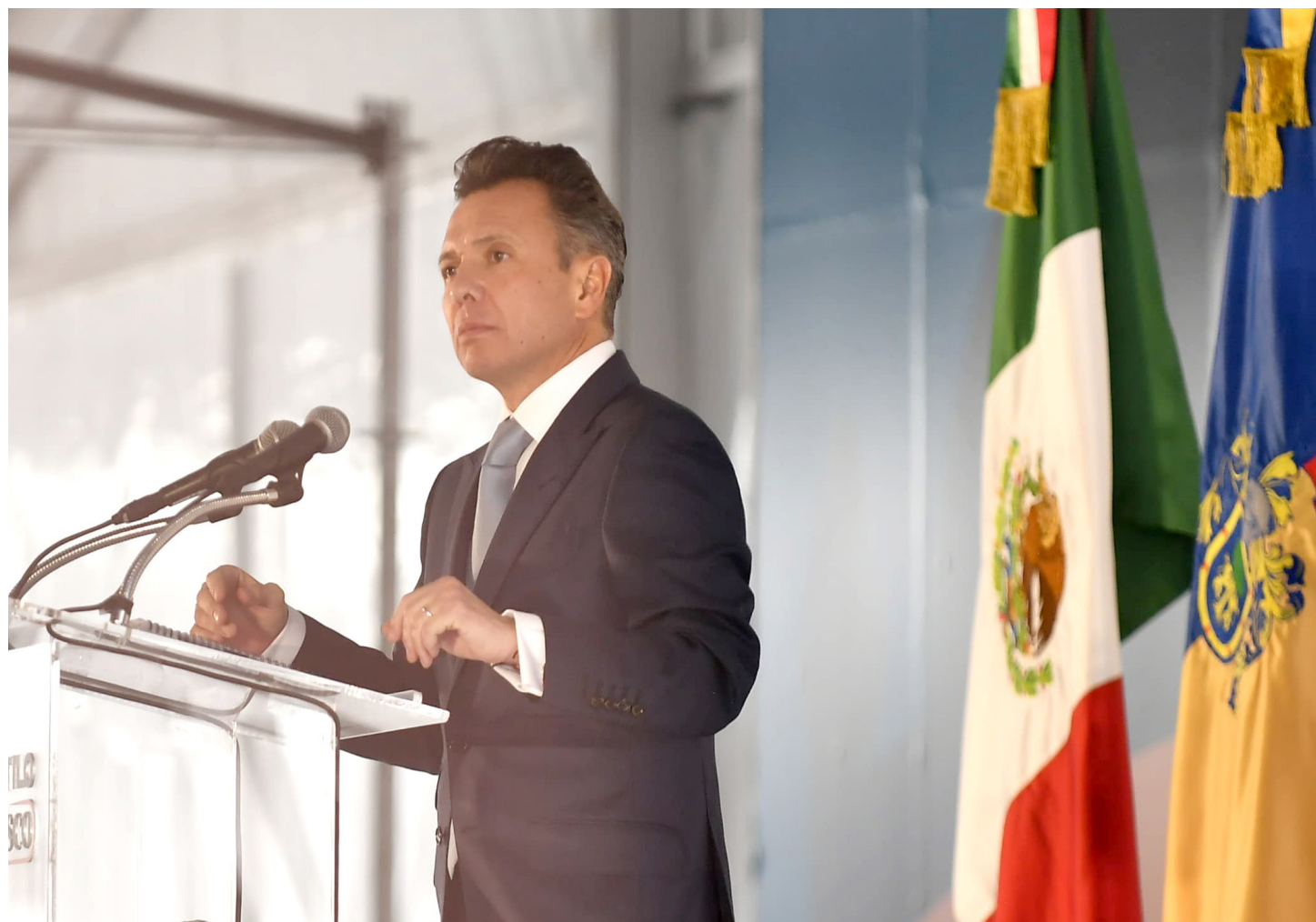
Pablo Lemus dijo que gobernará al estilo Jalisco y no perderá su esencia ni su identidad, será cercano a la gente y abierto al diálogo.

En su primer mensaje en el centro cultural Cabañas, el Gobernador de Jalisco dijo ser un gobernante serio, cercano, alegre y se comprometió a dejar al 100 por ciento las carreteras estatales