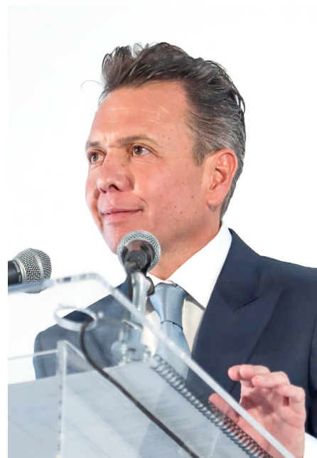
El Gobernador de Jalisco dijo ser un gobernante serio, cercano y alegre.