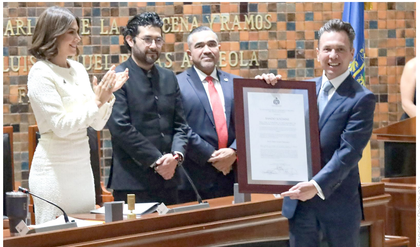
Pablo Lemus recibió el bando solemne que lo acredita como mandatario estatal.