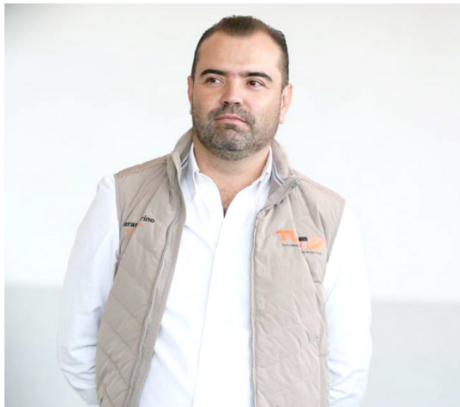
El Alcalde realizó varias actividades en el marco del Día Internacional de las Personas con Discapacidad.

El primer edil de Tlajomulco, aseguró que el municipio creará una agenda integral para conseguir el objetivo y con ello, construir igualdad entre la población