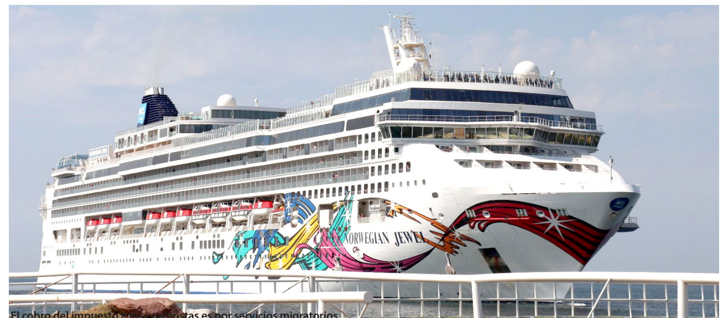
El cobro del impuesto a los cruceristas es por servicios migratorios.