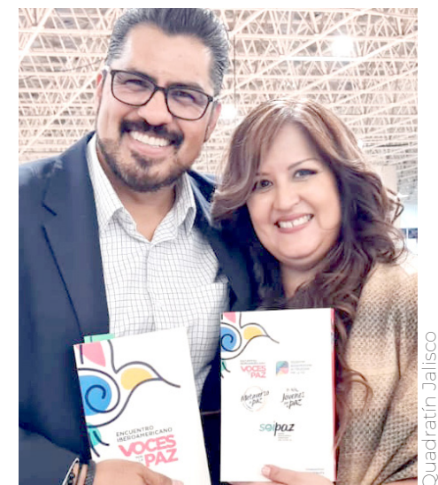
El libro reúne la experiencia de los foros del mismo nombre.

Pablo Latapí, indicó que este ejercicio se vuelve interesante gracias a la inmediatez de los medios de comunicación; anteriormente las imágenes debían traerse acudiendo al lugar de los hechos y ahora.