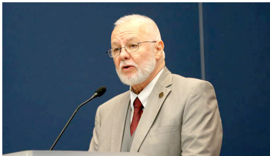
LA IA puede utilizarse a favor de todos si se llegan a acuerdos sobre el tema.