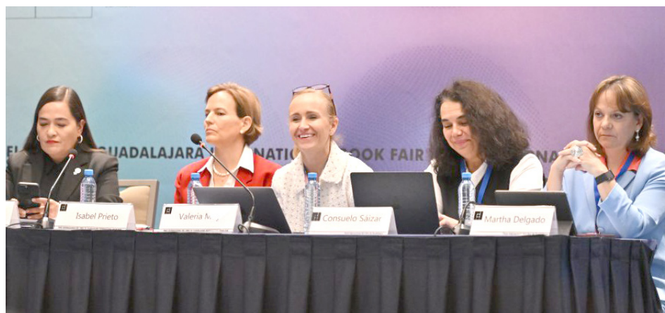
Lamentan que el país aún está lejos de la equidad e igualdad.

Bajo la temática “Fuerza y Visión: Mujeres revolucionando y transformando la economía nacional, las ponentes plantearon diferentes