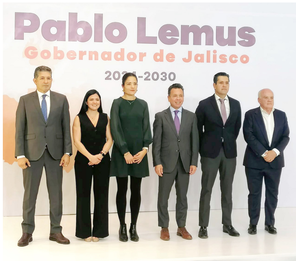
Lemus dijo que se ha hecho un buen trabajo y se posiciona a Jalisco como modelo educativo.

educación a nivel nacional, y lo dejo muy claro, Jalisco no entregará su modelo educativo a la federación, Jalisco conservará y fortalecerá su propio modelo educativo que ha sido pagado por las y los jaliscienses y que se ha consolidado por muchas décadas.”, explicó Lemus Navarro.