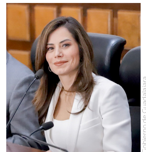
La alcaldesa dijo que la licitación será lanzada nuevamente a nivel nacional.