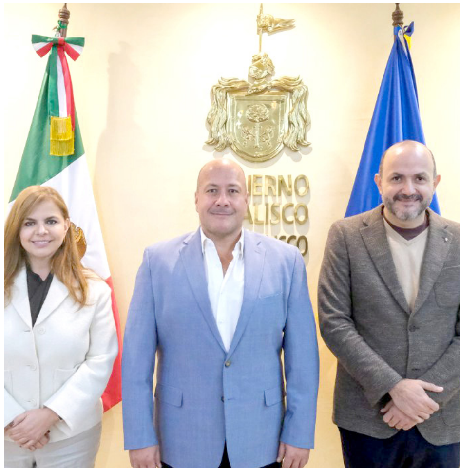
Señalaron que pudieron platicar de lo mucho que se logró durante seis años.

Indicó que “se vienen grandes retos de cara al futuro, pero confío en que