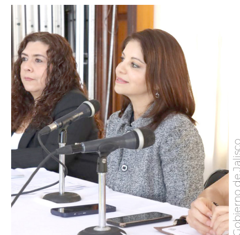
Se les brindarán cobijas, ropa abrigadora y atención médica.

Argumentó que entre las áreas participantes estarán la Coordinación de Gestión Integral de Riesgos, Protección Civil y Bomberos, la Comisaría General de Seguridad Ciudadana, Servicios Médicos Municipales y la Comisión de Búsqueda de Personas del Estado de Jalisco, la Dirección de Mejoramiento Urbano, la Coordinación General de Construcción de Comunidad, la Agencia Metropolitana de Bosques Urbanos.