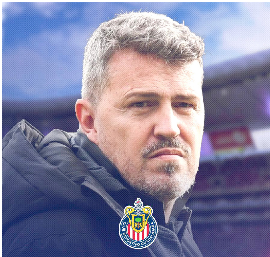
Oscar García Junyent fue anunciado el lunes como el nuevo director técnico.

Como futbolista, Oscar García Junyent, debutó con el Barcelona, en aquel momento dirigido por Johan Cruyff. Pasó por el Albacete, Valencia, Espanyol y Lleida, donde se retiró en 2005. Su carrera como técnico