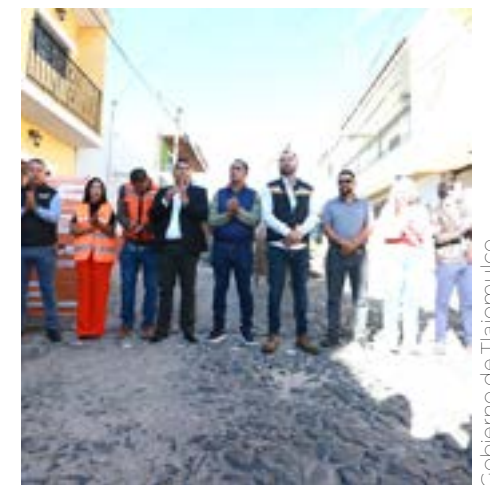
Gobierno de Tlajomulco

“Estamos listos para arrancar esta calle que ha sido muy demandada por la ciudadanía, vamos a arrancar aquí desde Pedro Loza y vamos a llegar hasta López Mateos.