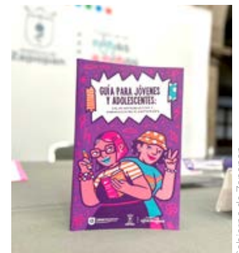
Esta guía será entregada de manera física a alumnos de prepa.