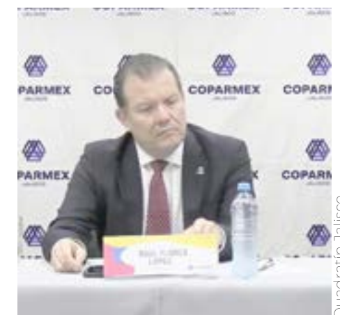
Académicos señalan que Jalisco tiene hospitales de buen nivel.

En los centros de salud municipales, se identifica que la disponibilidad de medicinas y atención recibida son los de menor calificación.