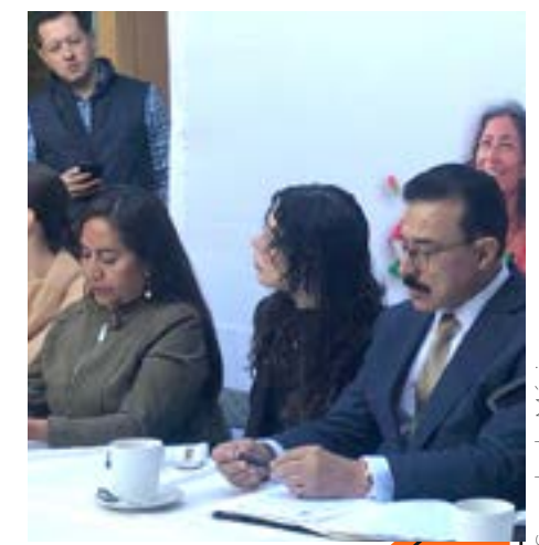
La iniciativa impedirá que los gobiernos echen mano de estos recursos.

Propuso reformar el artículo 123 de la Constitución Política de los Estados Unidos Mexicanos para establecer la portabilidad de la seguridad social como un derecho y prohibir las inversiones de alto riesgo que comprometan los recursos de los trabajadores.