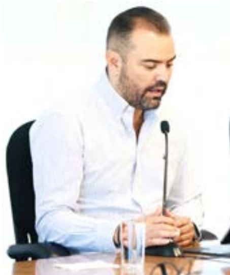
Gobierno de Tlajomulco

“Este día nos recuerda que la lucha por la igualdad, la justicia y dignidad de las mujeres es una responsabilidad compartida que nos compromete a todas y todos (...) necesitamos acciones contundentes que garanticen los derechos de las mujeres sin distinción”.