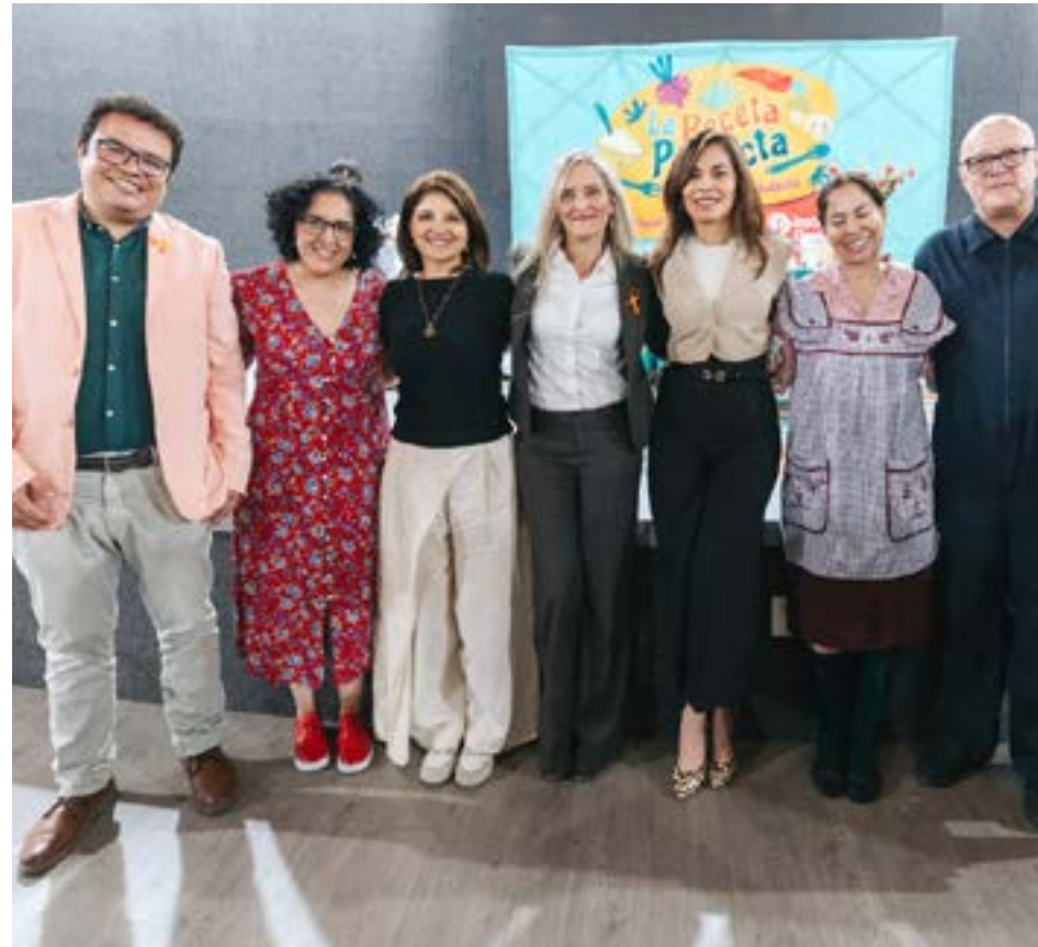
El Gobierno de Guadalajara realizó una serie de actividades para visibilizar, prevenir, concientizar.

“El 25N nos tiene que servir para reflexionar qué tenemos que hacer para que esta realidad cambie, qué tenemos