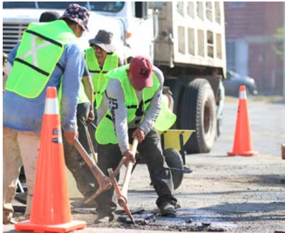
Estas obras mejorarán la calidad de vida de los habitantes de la zona.

Los trabajos incluyen la rehabilitación de vialidades, limpieza del entorno y rescate de espacios públicos, beneficiando directamente a mil 630 personas