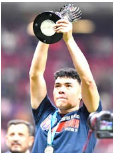
Tapatío acaba de coronarse en la Liga de Expansión.