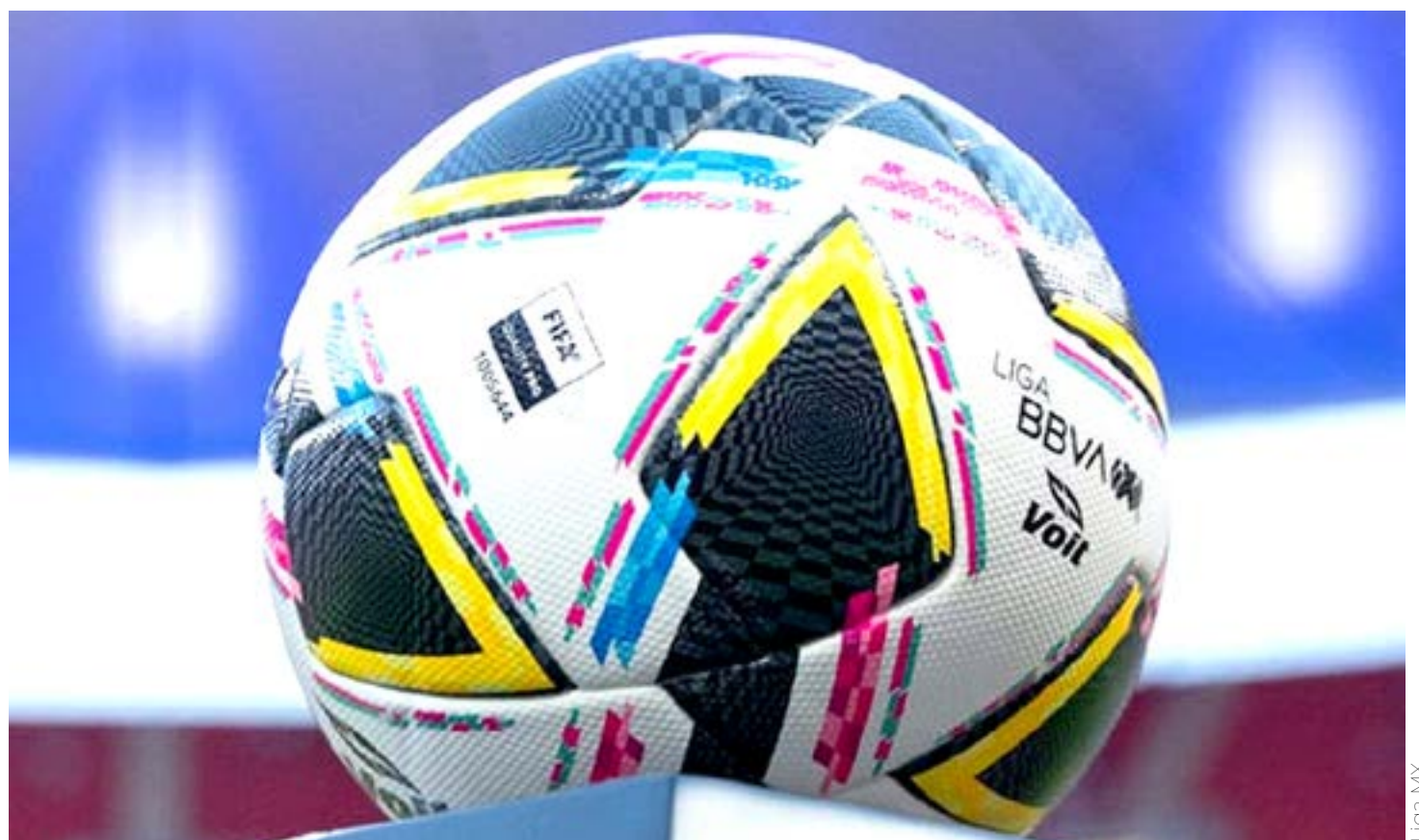
Los juegos de disputarán el miércoles 27 y jueves 28.

El primer capítulo de esta edición será el jueves 28 a las 21:10 en el BBVA y el domingo 1 al mediodía para el desenlace