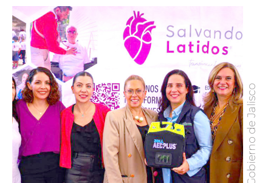
Asociación Civil Salvando Latidos patrocinó un desfibrilador externo automático

De acuerdo con personas expertas, los parques y Bosques Urbanos son lugares ideales para llevar a cabo actividades físicas, pero también son espacios donde la prevención de emergencias cardíacas debe ser prioritaria.