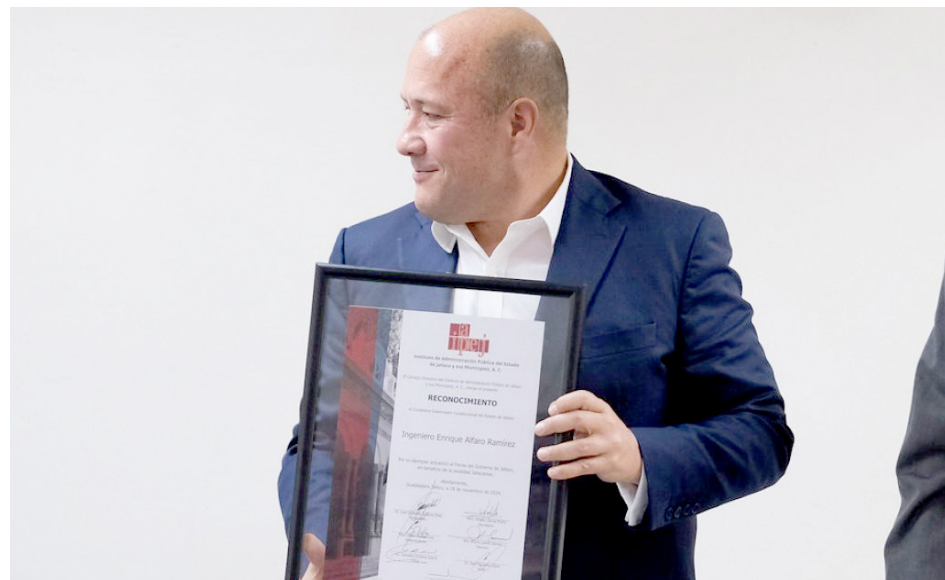
Destacaron las políticas públicas innovadoras, programas inéditos y programas.

Aseguró que vienen nuevos retos, tiempos prometedores y una lucha por defender el federalismo mexicano y la permanencia o no del Estado en