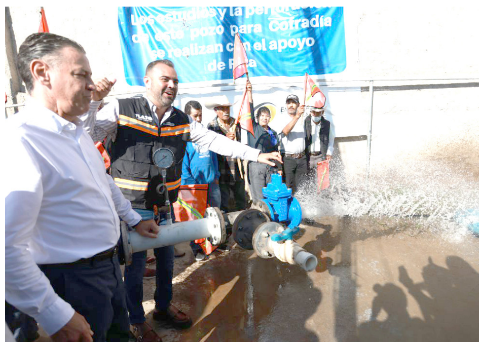
El alcalde, Gerardo Quirino, acudió al arranque de estos trabajos.

Con estos trabajos se asegurará por al menos 30 años el abastecimiento de agua para alrededor de cuatro mil habitantes de la zona