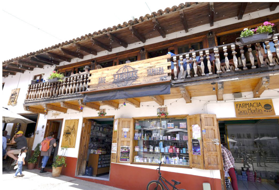
También se mejoró el atractivo visual y el equipamiento en mobiliario de negocios.

“A través del programa de competitividad turística, lo que buscamos fue fortalecer y renovar los negocios ubicados dentro del primer cuadro de los Pueblos Mágicos. Esto para mejorar su hospitalidad visual, en algunos fue mobiliario, en otros fue piso, en otros alguna decoración, etc., y de esta manera poder potenciar