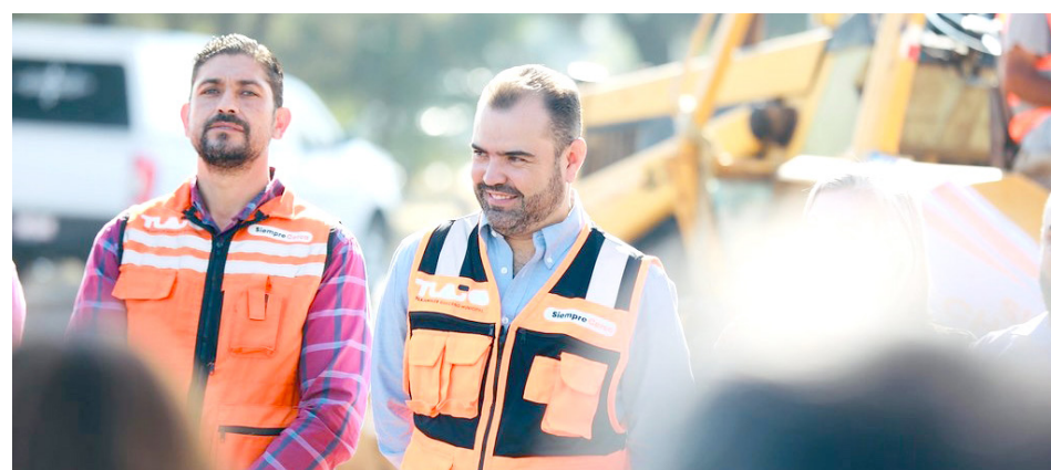
Se colocarán Paraderos Seguros en puntos estratégicos de la zona.

La construcción y obras de los 4 “Paraderos Seguros” que estarán en el corredor Chapala, consistirán en la colocación de luminarias solares, arbolado, bancas, balizamiento, señalética, guías para invidentes y mobiliario urbano, entre otras. Todo esto, para que, en un futuro muy cercano, sean parte de una estrategia que, junto al Gobierno del Estado, nos permita conectar más rápido con la ciudad, incluyendo la Línea 5 que iría del Estadio Akron al Aeropuerto