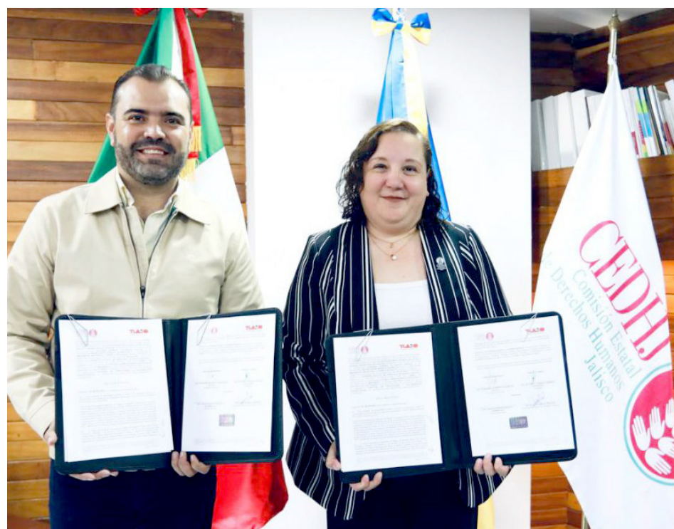
En el municipio se creará un área en favor de los derechos humanos.

El edil de Tlajomulco de Zúñiga explicó que la decisión de crear un área en favor de los derechos humanos en el municipio, es la manera de enviar un mensaje para las y los ciudadanos, y para las y los funcionarios del Gobierno, del anhelo que existe por recuperar la paz y la tranquilidad en la sociedad.