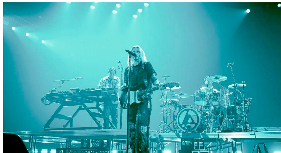
La banda estadounidense se presentará el 3 de febrero.

Será el próximo 15 de noviembre cuando el grupo originario de California, Estados Unidos dé a conocer