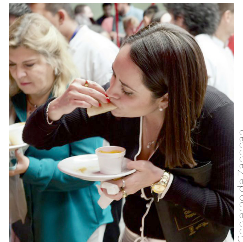
Gobierno de Zapopan

Gómez Rueda confirmó que, además de condiciones de seguridad, intervenciones en infraestructura, movilidad, vigilancia y servicios, esta estrategia contempla un trayecto divertido para las y los estudiantes, pues al exterior fueron pintados juegos, animales, números y actividades para las niñas y los niños.