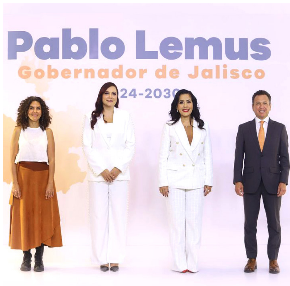
Pablo Lemus, gobernador electo, poco a poco va formando su equipo de trabajo.