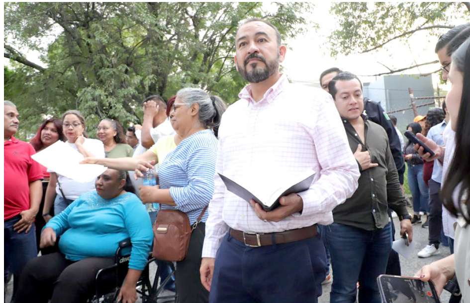
En este espacio de convivencia se reúnen las familias que habitan cerca de la zona.

Otras acciones que se realizarán en la Colonia en los próximos días son de bajo costo, pero de alto impacto, como revisar los árboles ubicados en las banquetas de las avenidas principales, así como el retiro de los tocones, que serán sustituidos por ejemplares nuevos.