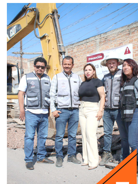
También se realizarán obras complementarias.

“Les estamos pidiendo a la gente que nos tenga paciencia, estamos trabajando para mejorar las cosas y vienen mejores cosas para nuestro municipio”, comentó a vecinos la alcaldesa. Dijo a los habitantes que esta fue una petición ciudadana, y que de esa manera le responde a la gente que más lo necesita, siguiendo la serie compromisos adquiridos durante su campaña.