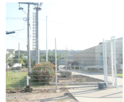
Se trata de una inversión de alrededor de 50 millones.

"Estamos hablando que la renta en Puerto Vallarta es cara, precisamente por su vida cotidiana de turismo y vida cara en ese contexto, uno de los proyectos y precisamente a través del presupuesto constitucional.