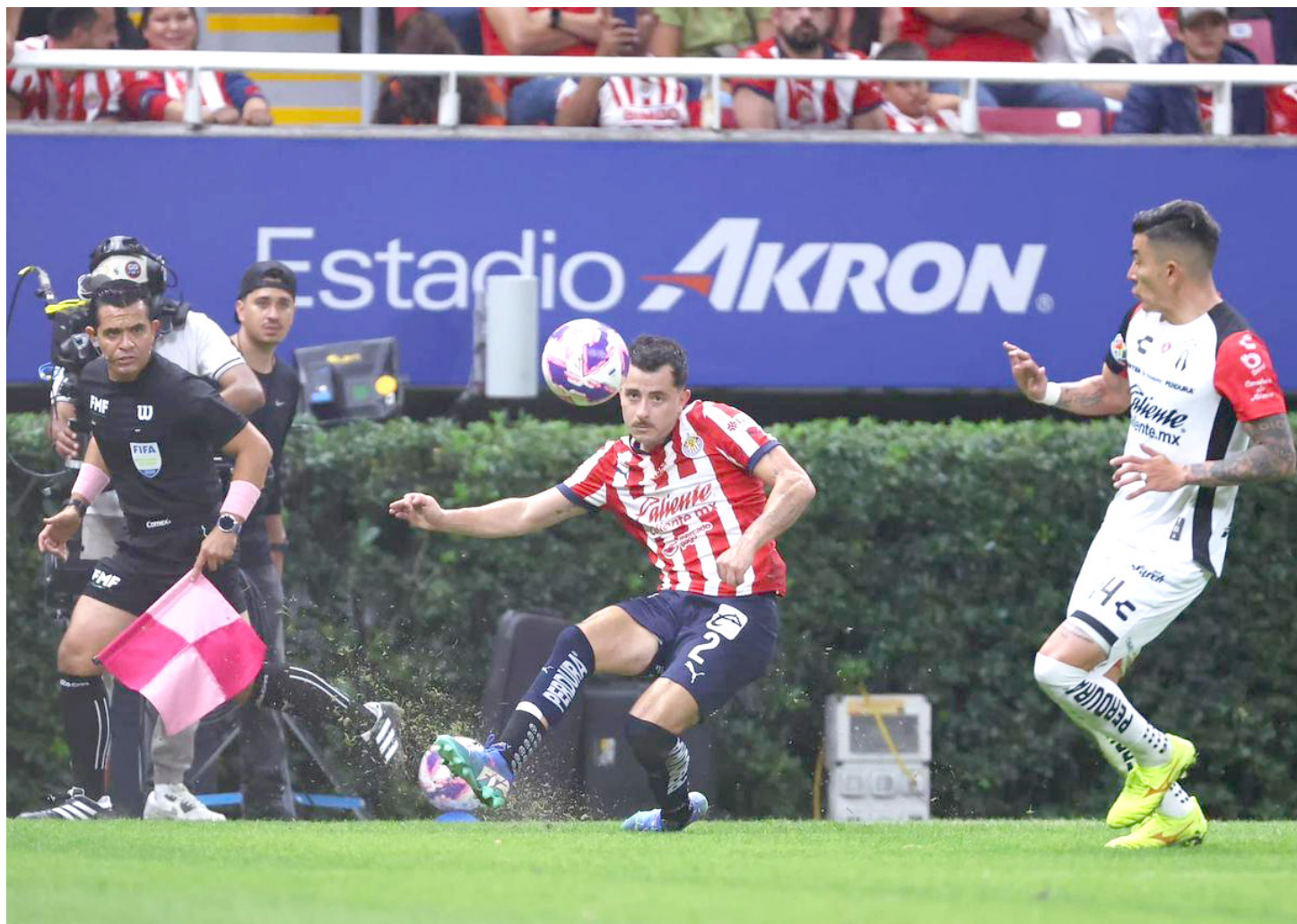
En instancias definitivas, el Guadalajara tiene ventaja sobre los Rojinegros.

Pasó más de una década para que se volvieran a cruzar en una Liguilla. En el Apertura 2004, los Zorros parecían tener todo a su favor luego de sacar el 0-0 en la Ida, ya en la nueva casa de