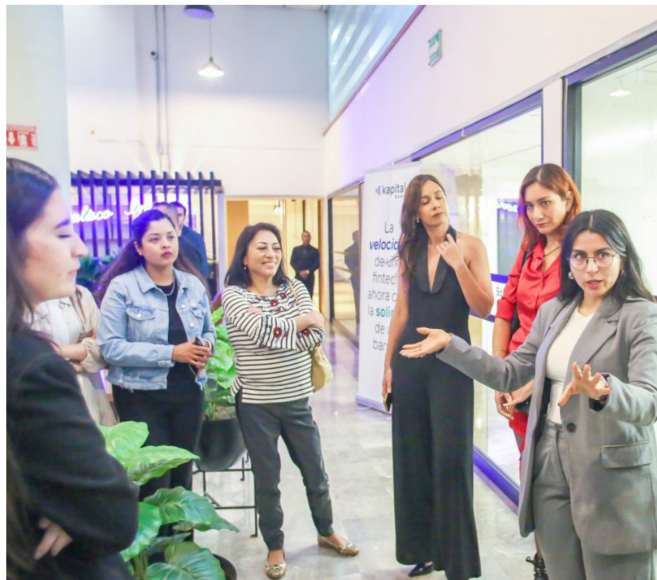
Gobierno de Jalisco

Con este proyecto se tejen redes para que las participantes compartan experiencias y se vinculen con el sector productivo de la entidad