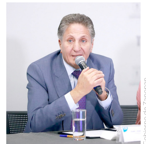
Zapopan es referente nacional en buenas finanzas.

De lo contrario, el beneficio en otro medio de pago será solo del 50%. En el caso de las multas de reglamentos, al pagar el total de adeudos, se podrá otorgar hasta 75% de descuento en la infracción.