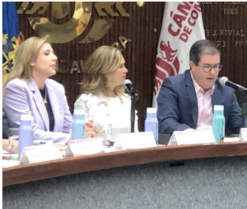
La meta de este año es llegar a cerca de un millón de pesos para ayudar a más de 2 mil personas.

Un Día para Dar Jalisco 2024 se trata de una campaña en la que están uniendo esfuerzos el empresariado, el comercio, el gobierno, las asociaciones de la sociedad civil, artistas y la población en general con el objetivo de recaudar apoyos económicos y en