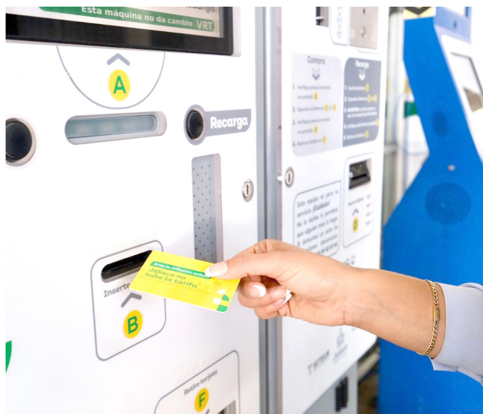
La dependencia estatal informó que se realizará la apertura de más módulos y líneas telefónicas.

Y que a partir de esta semana los módulos de la estación CUCEI de la Línea 3 y el de San Juan de Dios de la Línea 2 de Mi Tren, también tramitan