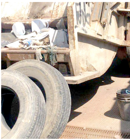
Gobierno de Puerto Vallarta

La principal causa de la crisis de la basura ha sido por los malos manejos.