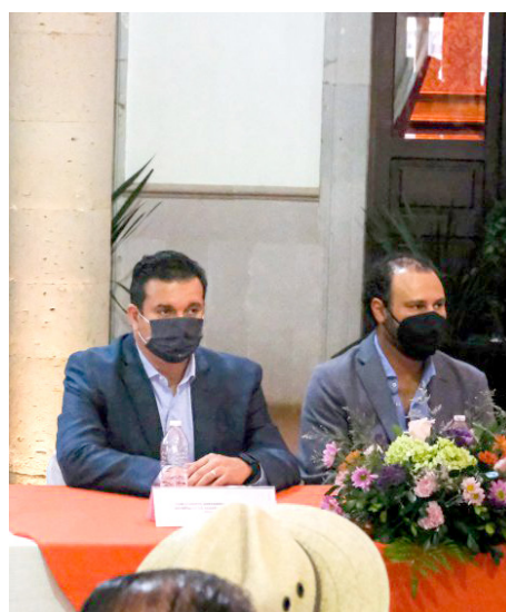
Es una herramienta precisa para reducir la corrupción y la burocracia.

Con la entrega de estos Distintivos T en Madrid, España, suman 85 los entregados a nivel internacional mientras que a nivel nacional son 309, que consiste en una placa que se coloca en un área visible de los centros de consumo es como se identifica a los establecimientos que cuentan con esta marca de certificación del Consejo Regulador del Tequila.