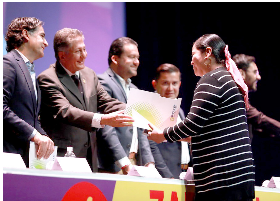
Gobierno de Zapopan

El programa impulsado por el Gobierno municipal, tiene por objeto crear mejores oportunidades laborales con el aprendizaje del idioma inglés