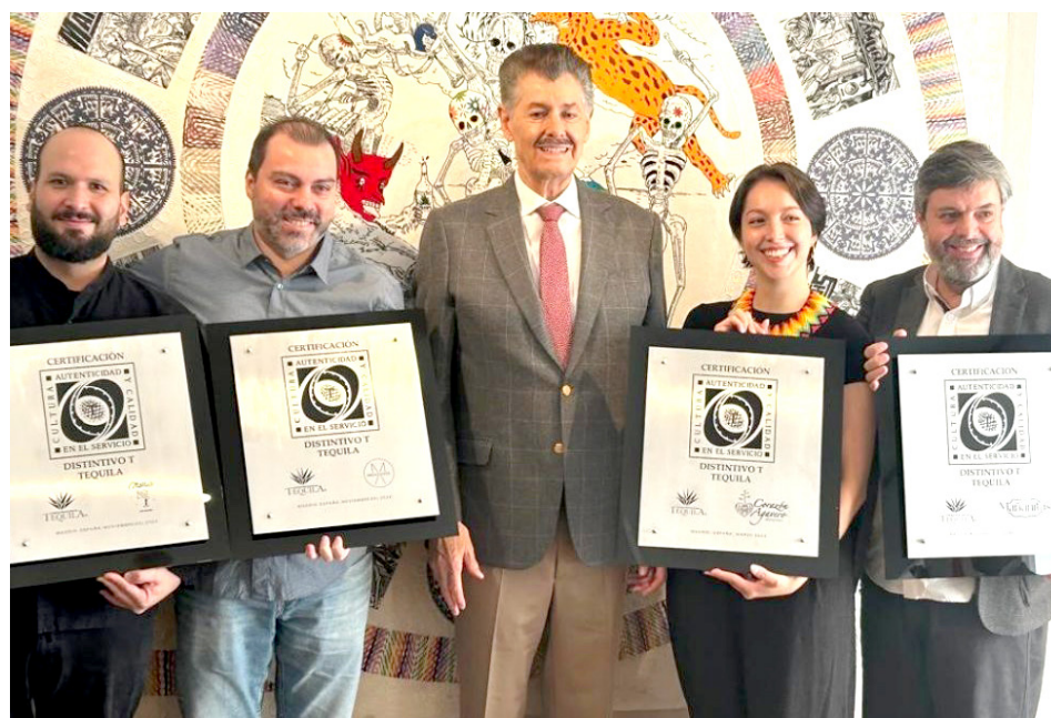
El evento fue realizado en las instalaciones de la Fundación Casa de México en España.

El Distintivo T reconoce a los centros de consumo que, tras un proceso de certificación y capacitación, demuestran la calidad de sus servicios