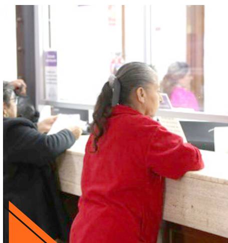
Gobierno de Guadalajara

El Gobierno de Guadalajara cuenta con seis recaudadoras a donde las y los tapatíos pueden acudir para gozar los beneficios de este programa.