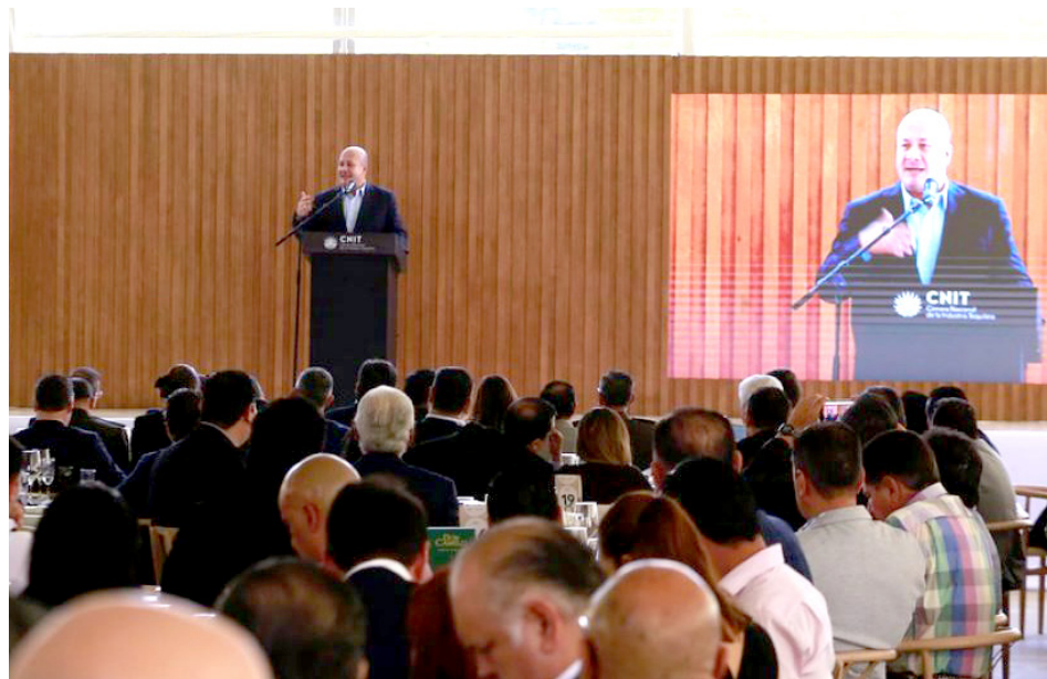
El mandatario agradeció el apoyo de la industria tequilera.

Durante la celebración del 65 Aniversario de la Cámara Nacional de la Industria Tequilera, y el 43 aniversario del Día del Tequilero el mandatario hizo el anuncio