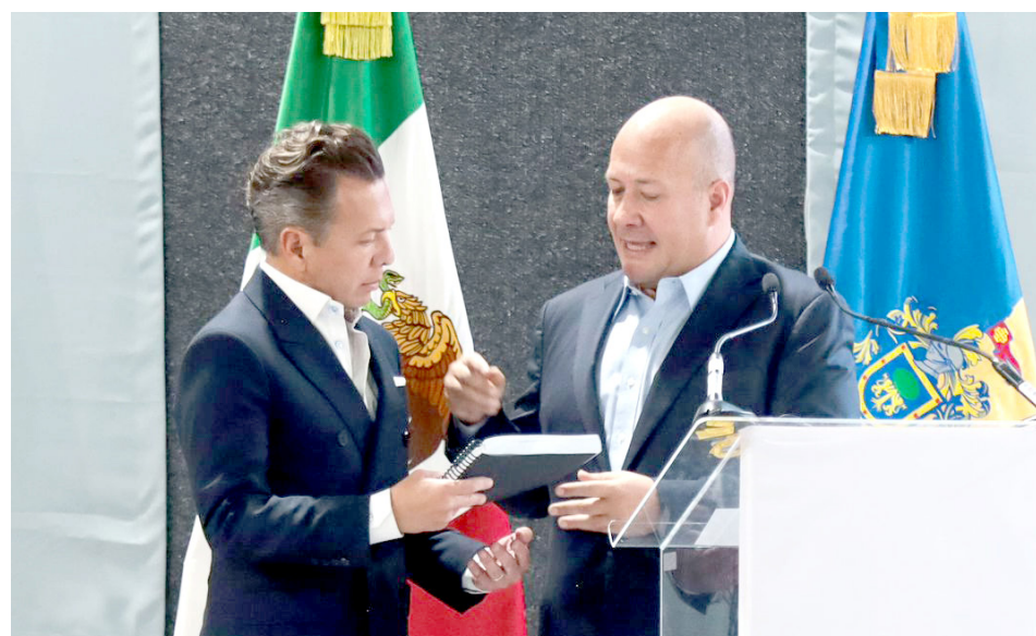
Alfaro hizo entrega a Lemus, gobernador electo, de un archivo que le puede servir de guía.

Sobre el tema de las fosas, han sido localizados 167 sitios de inhumación de donde han recuperado mil 821 víctimas, de las cuales, 53 por ciento han sido identificadas, y aseguró que el presupuesto para esta labor creció en 56 por ciento lo que permitió la contratación de 499 plazas.