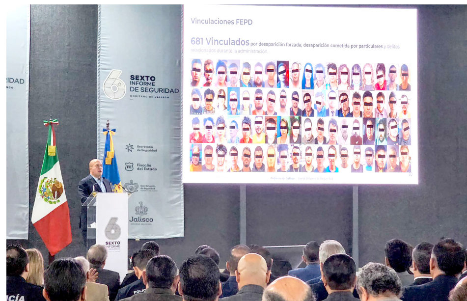
Enrique Alfaro mostró las detenciones que se han realizado.

“En 2024 se cometieron 27 feminicidios, todos resueltos. De los 27, 23 se encuentran ya enfrentando a la justicia, presión preventiva, uno tiene orden de aprehensión y cuatro agresores se quitaron ellos mismos la vida. Es decir, si aquí alguien comete un feminicidio va a acabar en la cárcel, no tengan duda. Y así tenemos que seguir hasta que este delito quede erradicado”.