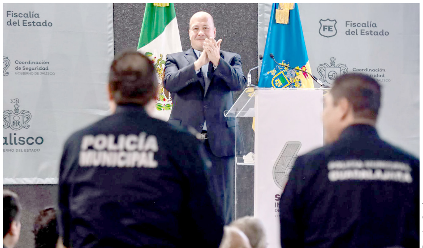
Enrique Alfaro reveló las cifras positivas con las que deja su mandato.

En el Sexto de Informe de Gobierno en materia de seguridad, el mandatario estatal dio a conocer las cifras del SNSP