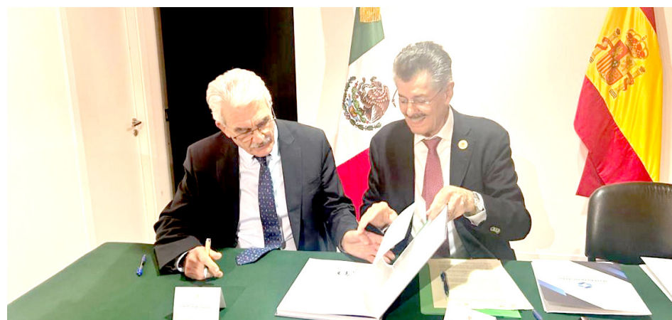
La Embajada de México en España fue el escenario para la renovación.

México en España fue el escenario para la renovación de dicho convenio, de cooperación técnica y científica, entre el Consejo Regulador del Tequila A.C.