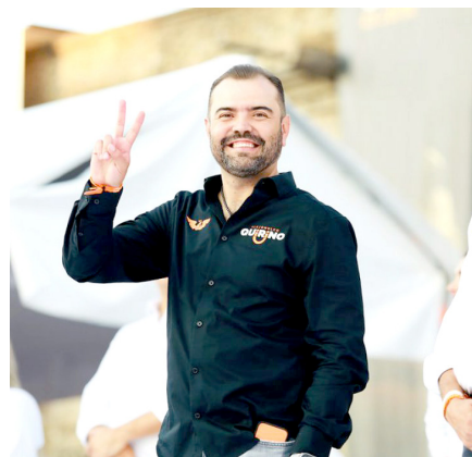
Forma parte del resultado de la última Encuesta Mitofsky.