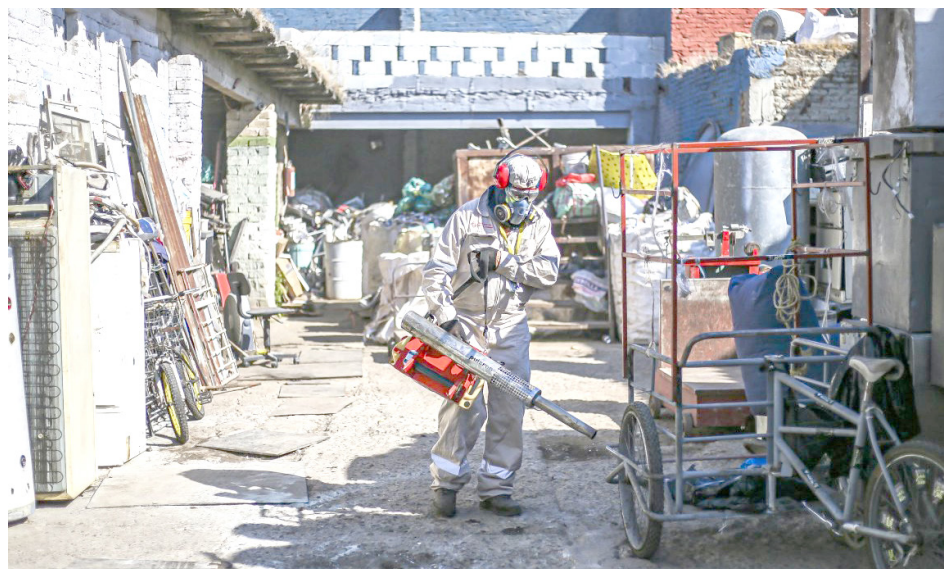
Son mil 604 mujeres y hombres que visitan casa por casa.

Una de las brigadas visitó la colonia Blanco y Cuéllar, al oriente del