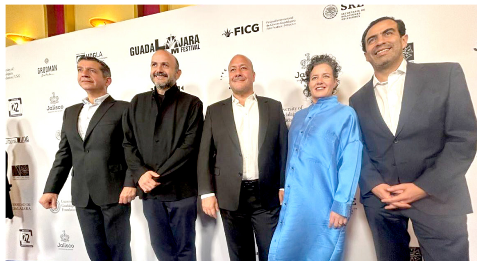
Filma Jalisco fue lanzada en 2023 y es única en el país.

Durante el GLAFF, que cuenta con 14 años de trayectoria conectando cineastas estadounidenses y latinoamericanos, se reconocieron los esfuerzos para el impulso a la industria a