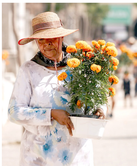
Alrededor de 254 mil personas visitaron los panteones tapatíos.