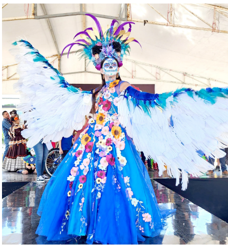
Gobierno de Tlaquepaque

Los participantes mostraron su amor por las tradiciones.