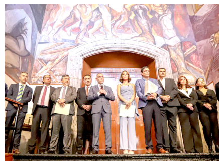
Seguridad, salud y economía, son las principales necesidades.