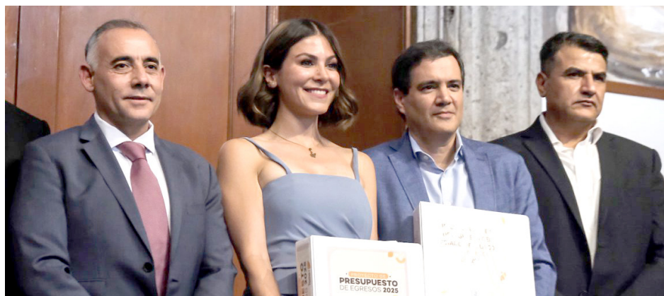
El proyecto de presupuesto contempla las prioridades para la entidad.

Señalaron en el comunicado que el Gobierno de Jalisco realizó un trabajo