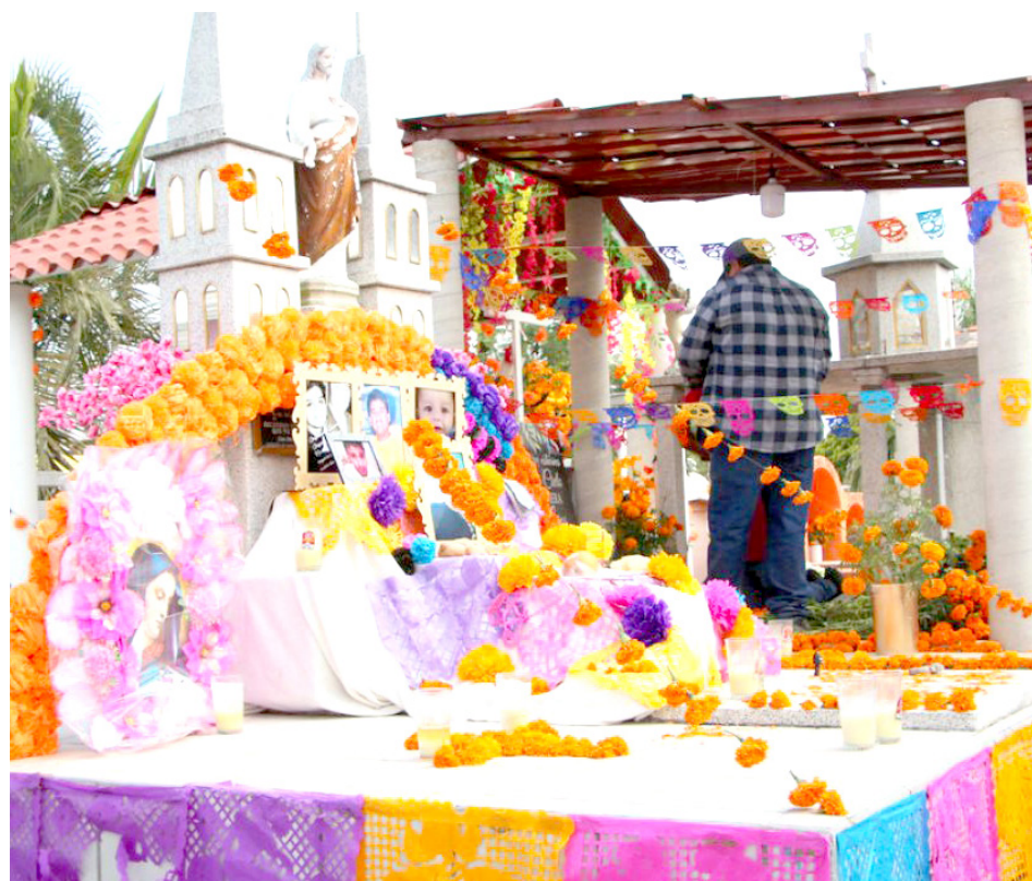
La tradición de Día de Muertos está más viva que nunca.

Participaron distintas dependencias municipales para garantizar que las familias pudieran acudir de manera segura a los camposantos