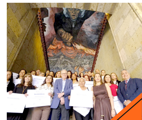
La mayoría de las personas iniciaron sus funciones en el Ceinco.