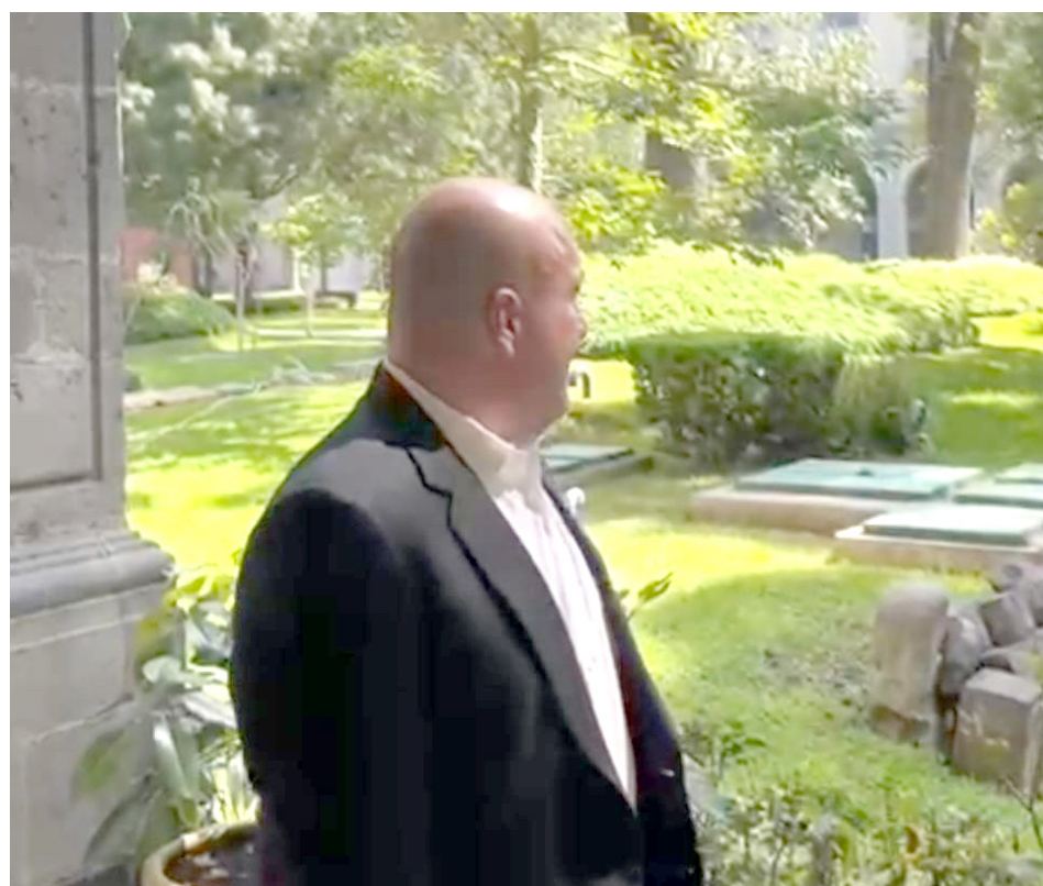
El Gobernador del Estado de Jalisco, Enrique Alfaro Ramírez, desde Palacio Nacional.

“Platicamos sobre el tema de carreteras federales, le expliqué la situación en la que se encontraba la red federal que urge intervenirlas y la verdad es que la Presidenta tomó con mucha seriedad del planteamiento. Quedamos de que vamos a tener comunicación con la Secretaría de Infraestructura, Comunicaciones y Transportes para hacer una ruta y una agenda de trabajo que permita arreglar las carreteras que están destrozadas en