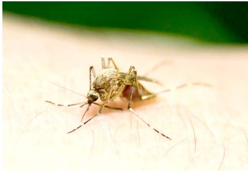
Se recomienda mantener las medidas preventivas evitando la proliferación del mosquito

Durante la última semana epidemiológica se registraron 842 casos, llegando a un acumulado de 8 mil 436 casos confirmados y una defunción