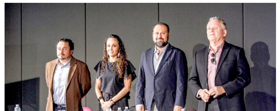
La entidad es referente nacional en el tema.

“Esto es un faro de referencia en todo el continente, y no es casualidad que seamos los únicos en América Latina en haber recibido el prestigioso reconocimiento de la Unesco, así como tres reconocimientos GPAI por nuestra contribución al desarrollo de la IA responsable y ética, estos reconocimientos reflejan el compromiso de nuestro gobierno con innovación tecnológica el bienestar social y el uso estratégico de los datos