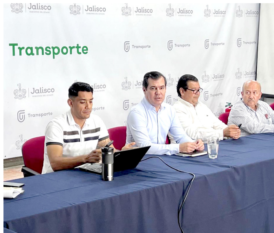
Aseguran que se cumplirá la palabra del Gobernador de no incremento.