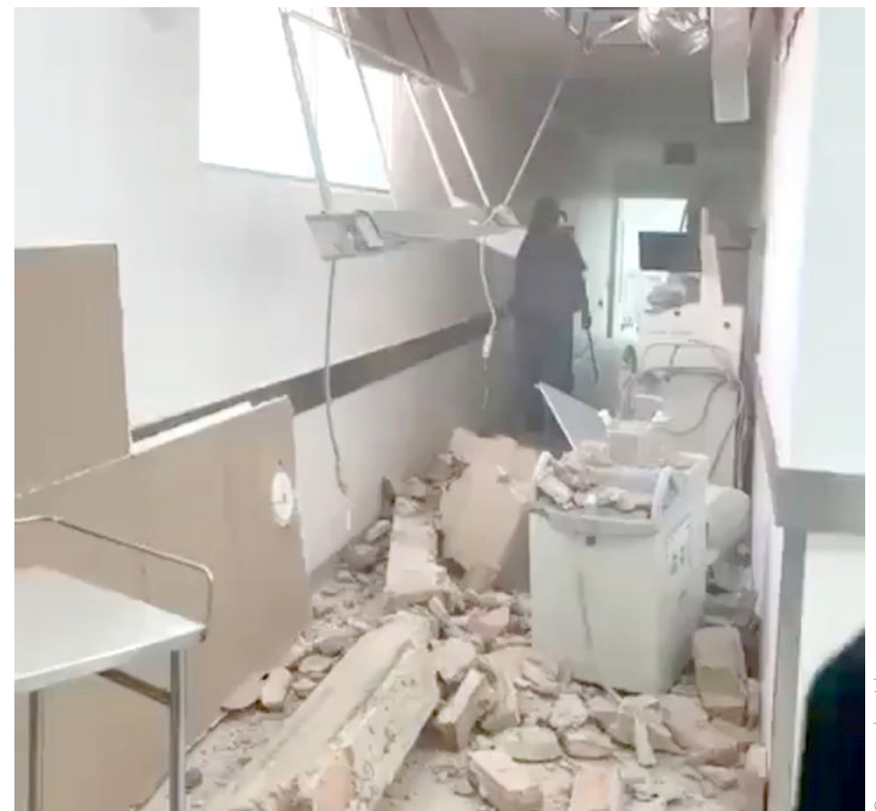
El techo cayó, pero por fortuna no dejó personas heridas.

Será el mismo personal de Gestión Integral del Riesgo quienes determinen si es verdad lo señalado por las autoridades del nosocomio o en realidad sí se trató de un derrumbe que puso en peligro la vida de pacientes o empleados del lugar.