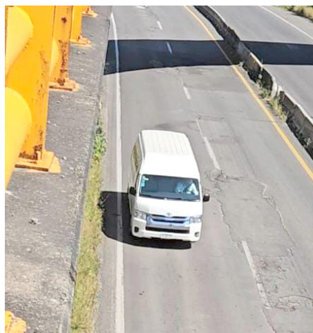
El Gobierno de El Arenal invertirá en la obra con empresarios

Los tramos en reparación son: Carretera Guadalajara-Ameca (México 70) . Carretera Guadalajara-Tepic (México 15 N) : Desde el cruce de Tala hasta el cruce de las vías, en los límites con Amatitán (Puente del Río y entrada a Santiaguito).