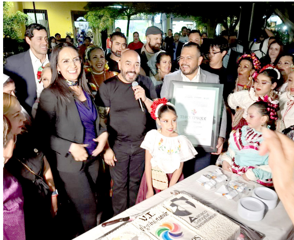
El intérprete entonó El Rey en compañía de los asistentes.