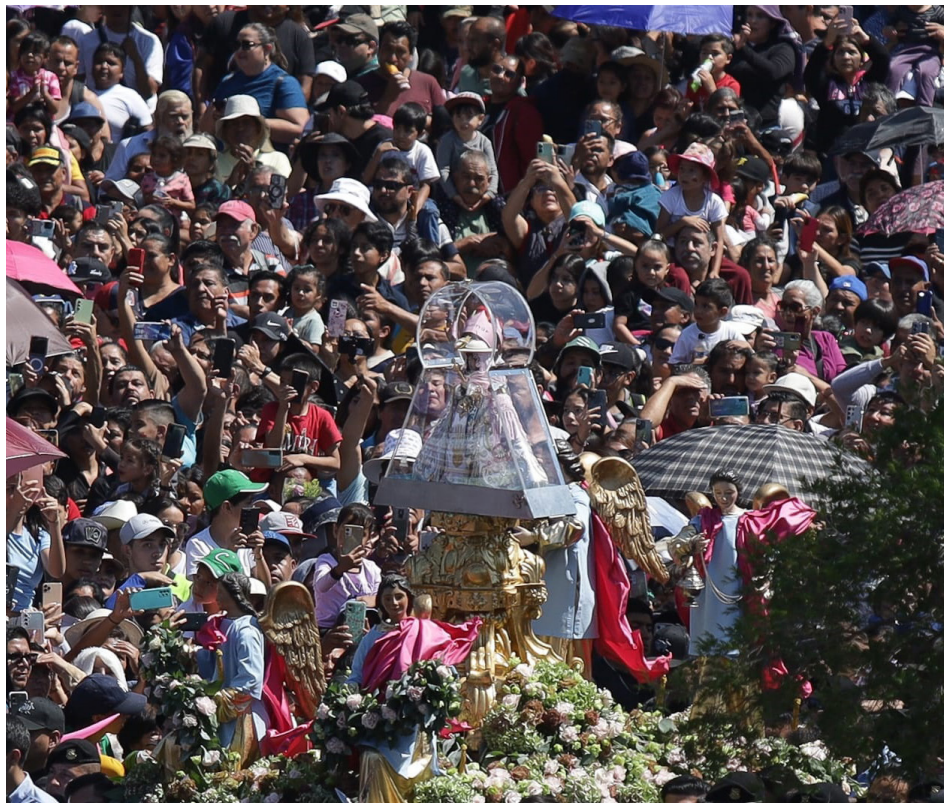
Autoridades de Guadalajara y Zapopan reportaron saldo blanco tras la peregrinación.

La Generala regresó a casa acompañada de familias enteras de fieles que caminaron desde la Catedral Metropolitana hasta la Basílica de Zapopan