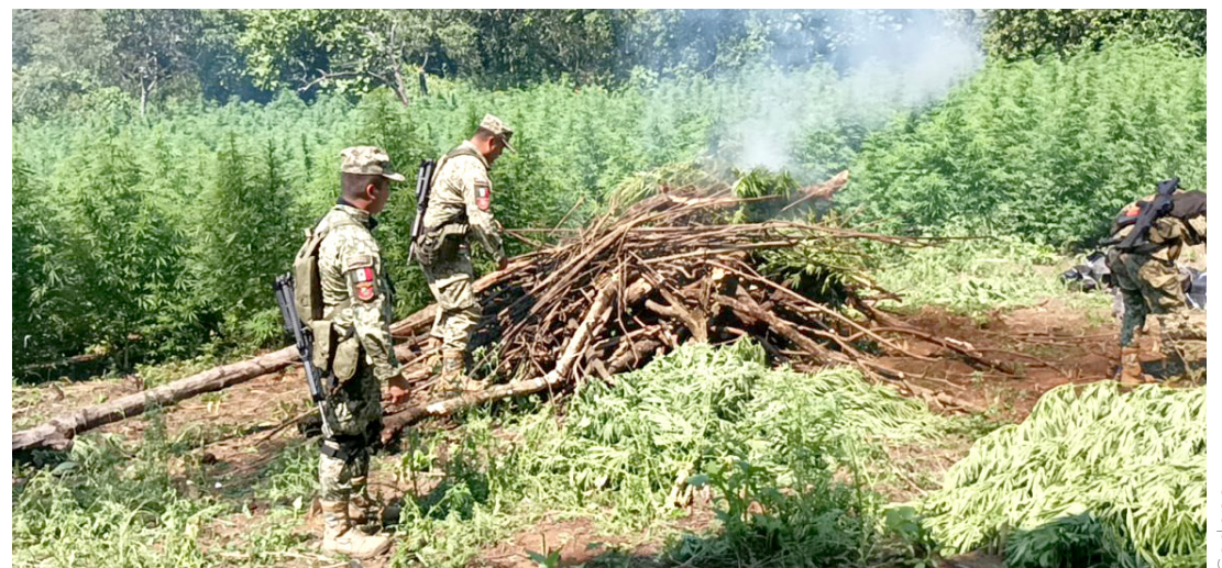
El plantío fue localizado a unos cuantos kilómetros a la periferia.

recorrido de reconocimiento que realizaba el personal castrense en el municipio, cuando en un cerro, a unos tres o cuatro kilómetros de la ciudad, localizaron las plantas del enervante, las cuales se encontraban plantadas en una dimensión aproximada de 10 mil metros cuadrados (1 hectárea), por lo que procedieron a su aseguramiento, corte y posterior incineración, dando parte a las autoridades militares y ministeriales de la federación. En el lugar no hubo detenidos.