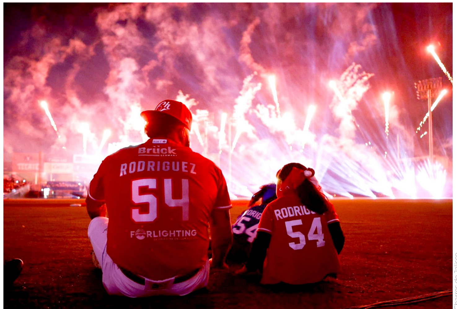
Charros de Jalisco

Harán un estadio más cómodo, para aspirar a un juego de Ligas Mayores