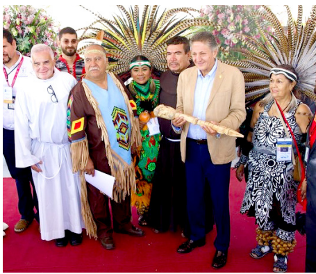
Gobierno de Zapopan

El primer edil recibió el Bastón de Mando de los Cuarteles de Danza.