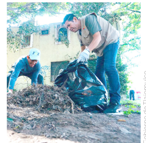
Este ejercicio comenzó en Haciendas del Sur.

“Yo les agradezco mucho que dediquemos un tiempo de nuestro fin de semana, pero también debemos decirles que así debemos de estar, que el gobierno debe de estar en las calles. Ocupamos de ustedes para seguir haciendo cosas extraordinarias”,