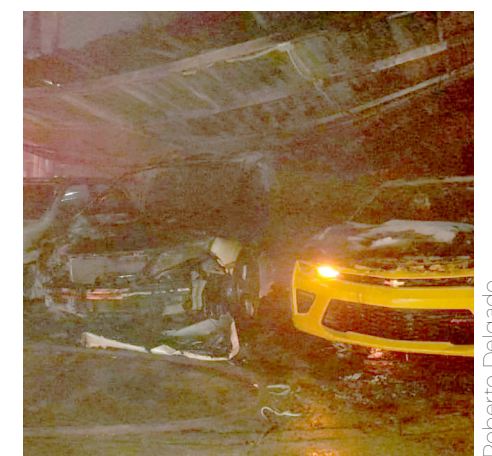
Se confirmó que había 8 automotores afectados en su totalidad.

Con este incendio de grandes magnitudes el municipio ya contabiliza cuatro en 8 días, una tienda Walmart, autobuses de la empresa Ruza, una tienda City Club y a hora el lote de autos, por lo que surge la teoría de que alguien o algunos pudieran estarlas provocando, sin embargo, eso corresponderá a las autoridades determinarlo.