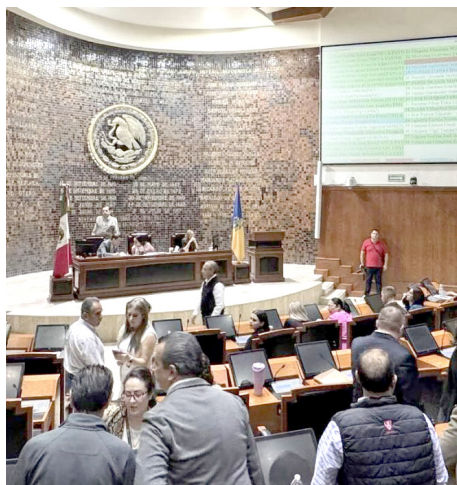
Congreso de Jalisco

La sesión se realizó la madrugada del sábado.