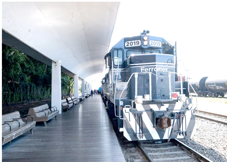
Los boletos pueden adquirirse en línea o en la estación Washington.

Tequila Express regresa con el objetivo de practicar el turismo responsable, utilizando uno de los medios de transporte más ecológicos mientras se disfruta del paisaje agavero catalogado por la UNESCO como Patrimonio Cultural de la Humanidad.