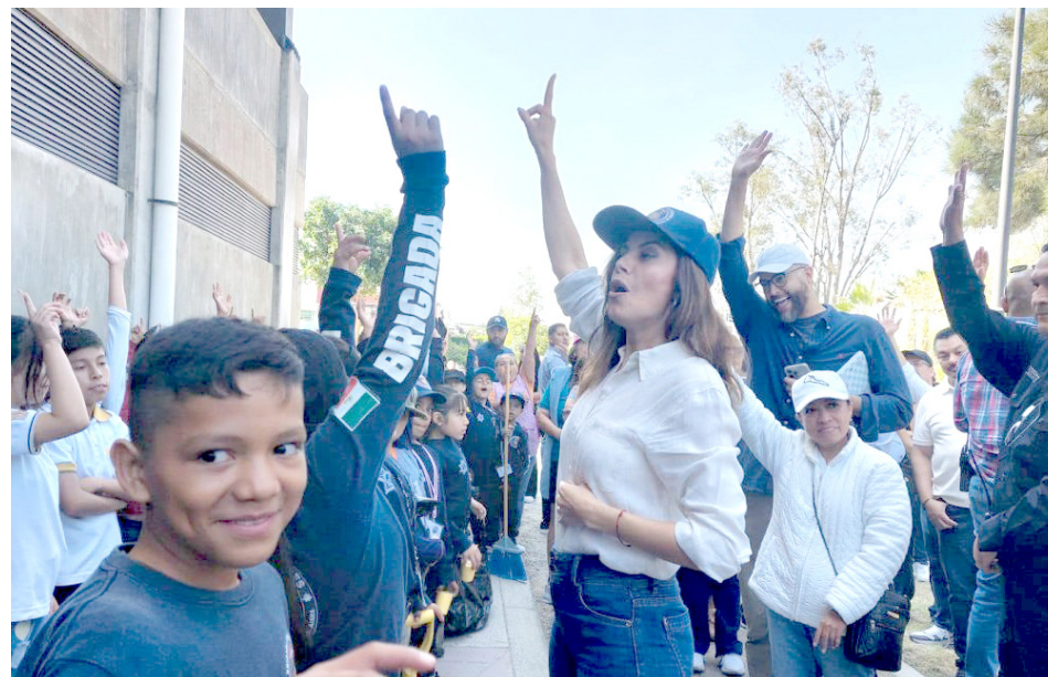
En este sitio, la policía tapatía también inició acciones para la prevención del delito.

Los Vecinos de la colonia Talpita y aledañas destacaron la labor hecha por el ayuntamiento, y agradecieron