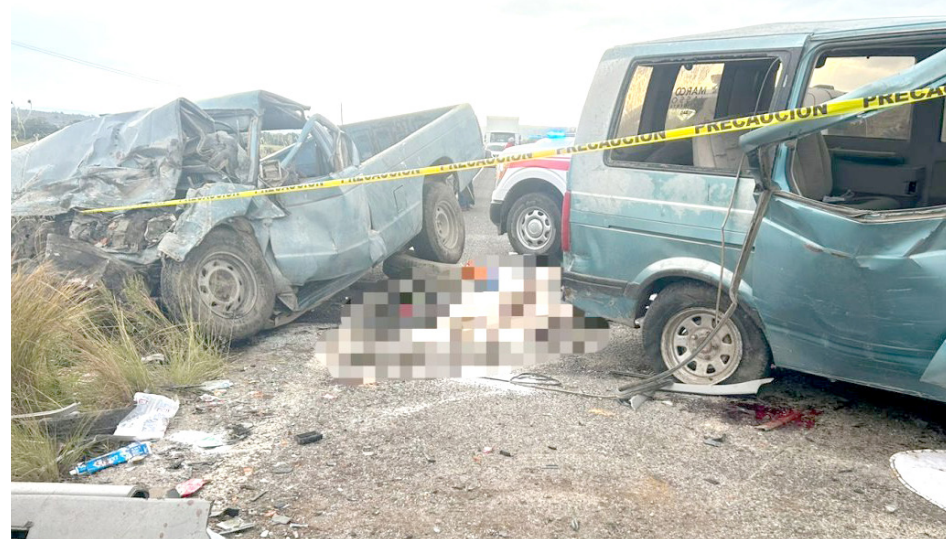
Sobre el pavimento quedó el cuerpo de una mujer que salió proyectada.

Tras revisar a todos los pasajeros constataron que la cifra fue fatídica y es que al interior de la camioneta