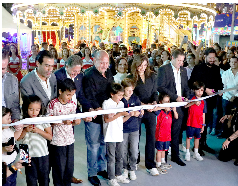
El gobernador, Enrique Alfaro, declaró inauguradas las fiestas.

"Estamos muy contentos, emocionados y nerviosos. Para la banda de Chuy