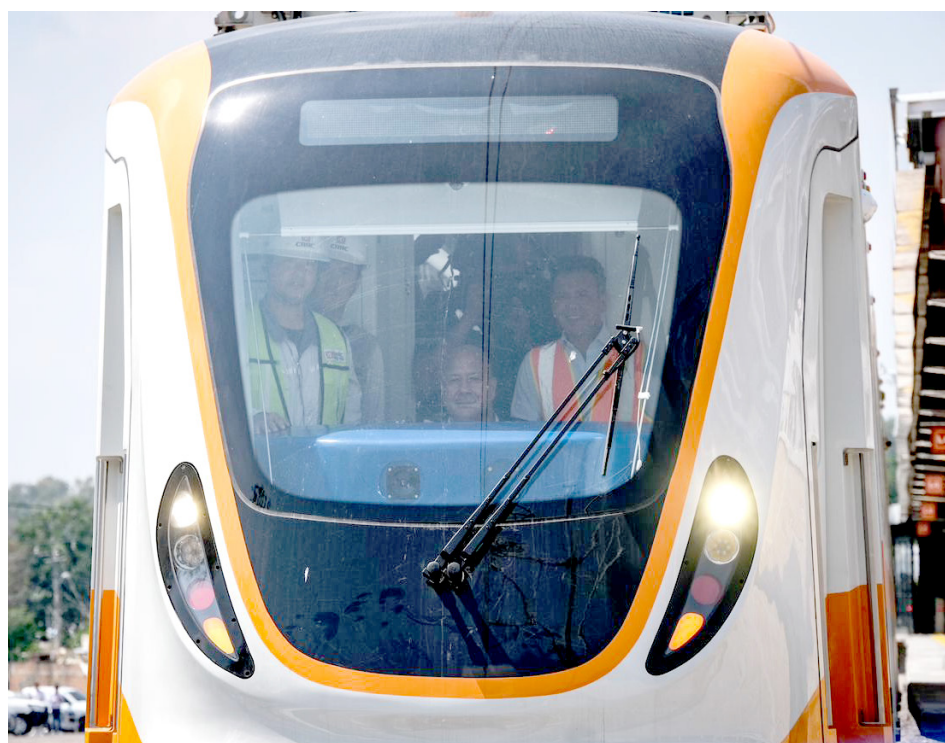
El Gobernador de Jalisco condujo un vagón desde la estación Tlajomulco Centro hasta el CU Tlajo.

“La prueba será con los medios y con quienes hoy nos acompañan hasta la estación Tlajomulco para ver por primera vez rodar el tren de la