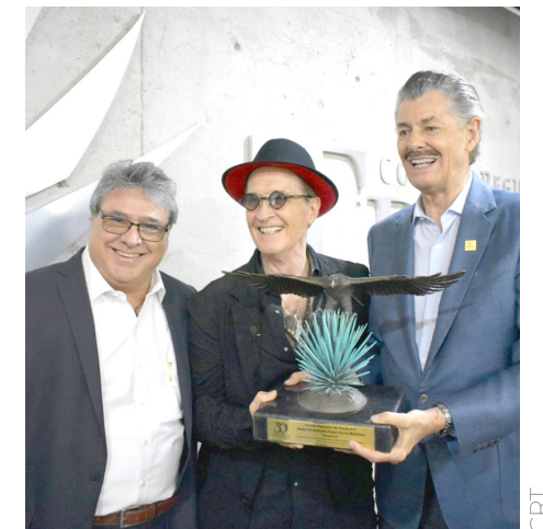
Emmanuel recorrió los laboratorios con los que cuenta el CRT.

“Les tengo que agradecer todo el trabajo que hacen por mantener el nombre del Tequila en el mundo y por mantener y descubrir lo que se puede hacer con la calidad y la tecnología y con la nueva modernidad para que nuestro Tequila este en todos lados. Muchísimas gracias por este homenaje, por este reconocimiento, los artistas duramos un tiempito ocupamos una época en el espacio y un espacio en la época vamos desapareciendo...pero el Tequila va a seguir siempre”, precisó Emmanuel al hacer el uso de la voz para agradecer la distinción otorgada.