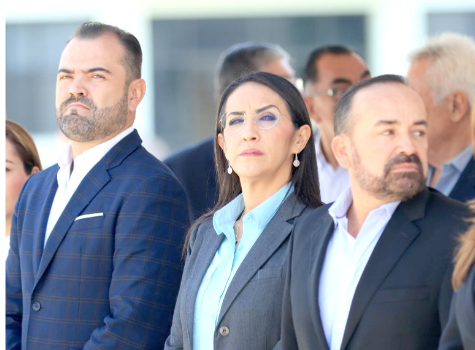
La alcaldesa de Tlaquepaque participó en la primera reunión del Consejo Metropolitano.

“Ya están incorporados, cada mando, en las nuevas áreas, ya tenemos los primeros reportes, tuvimos varios buenos aciertos de la policía del municipio en