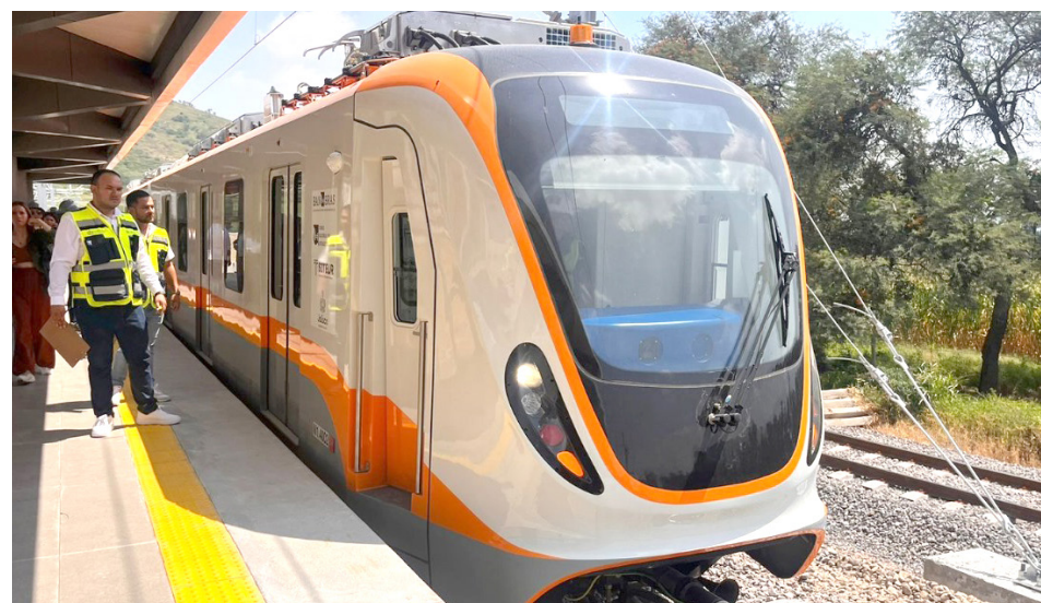
Se tiene un avance de 71 por ciento de la obra civil.

“La de Periférico, porque es una estación complicada, es una estación