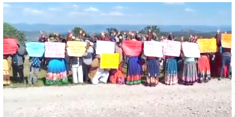
Captura de video

Se espera que en los próximos minutos, la Fiscalía de Jalisco informé sobre lo ocurrido dando más detalles del cómo y dónde se les localizó y si hay o no delito que perseguir.