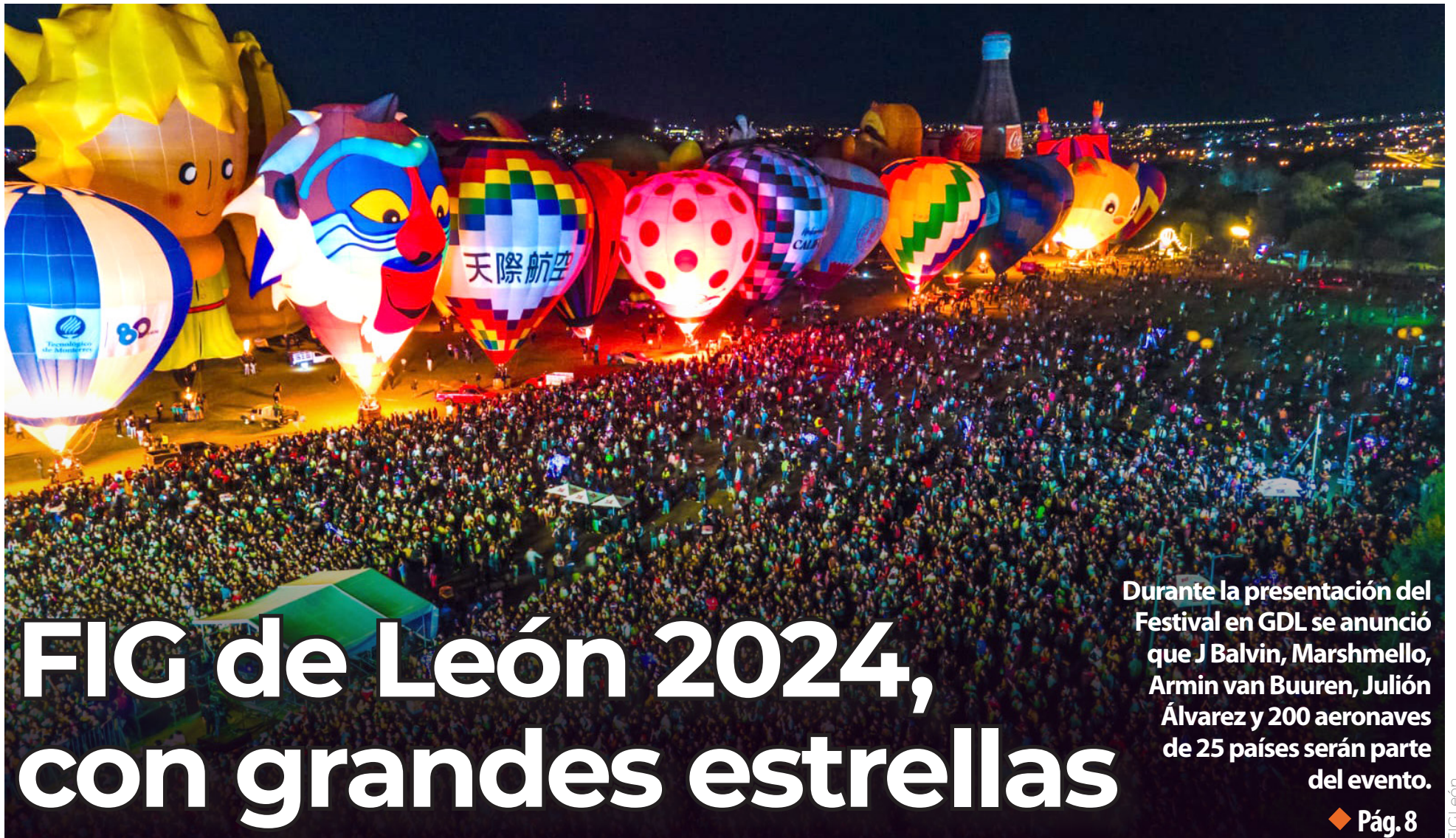
FIG de León 2024, con grandes estrellas