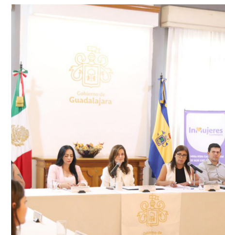
La presidenta Verónica Delgadillo estará al frente del organismo.