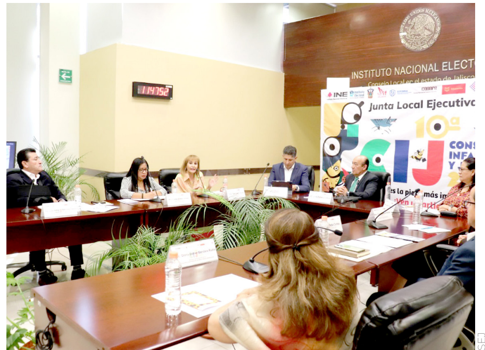
Va dirigida a niñas, niños y adolescentes a partir de los tres años y hasta los 17 años.

Hizo una invitación a que exista un acompañamiento colectivo, un acompañamiento social, genuino, real para que “las niñas, los niños nos ayuden