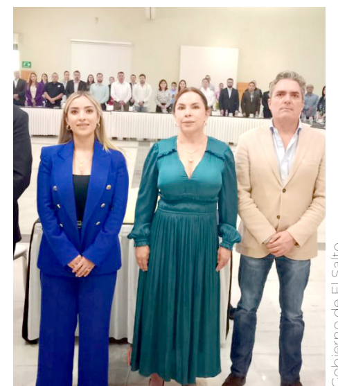
El proyecto será presentado al próximo gobernador, Pablo Lemus.

no lo pedían a gritos porque iban hasta Zapopan a llevar a sus niños a sus actividades y la verdad no tenían dinero, les comentaban que los llevaban a ellos o ponían y pues es un tema muy sensible ya que se subieron los niños al camión les daban ataques de ansiedad y las personas se molestaban y los trataban mal, en realidad ellos necesitan otro tipo de atención si pues me hizo sensible y pues también tengo un nieto que tiene problemas de autismo y eso me motiva aún más a sacar todo esto adelante”, apuntó María Elena Farías Villafán, presidenta de El Salto.