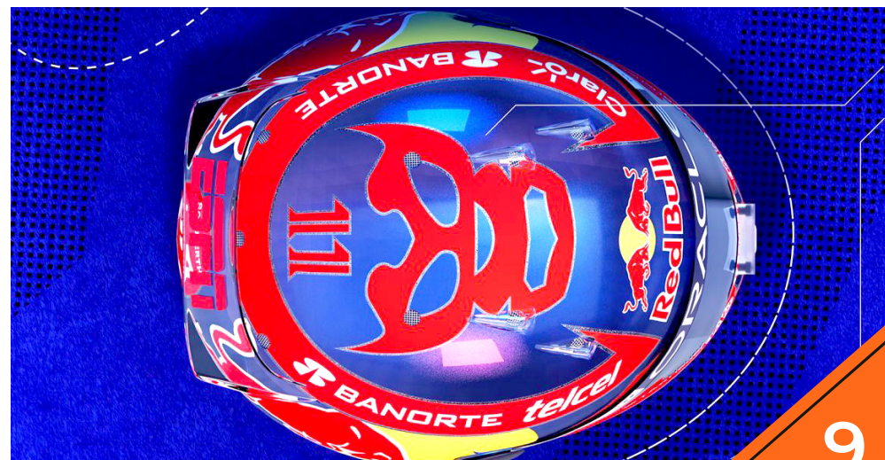
El casco está basado en la lucha libre y el agave.

El Gran Premio de México se correrá este domingo, en el Autódromo Hermanos Rodríguez, donde este jueves comenzarán las prácticas libres y el sábado será la clasificación.