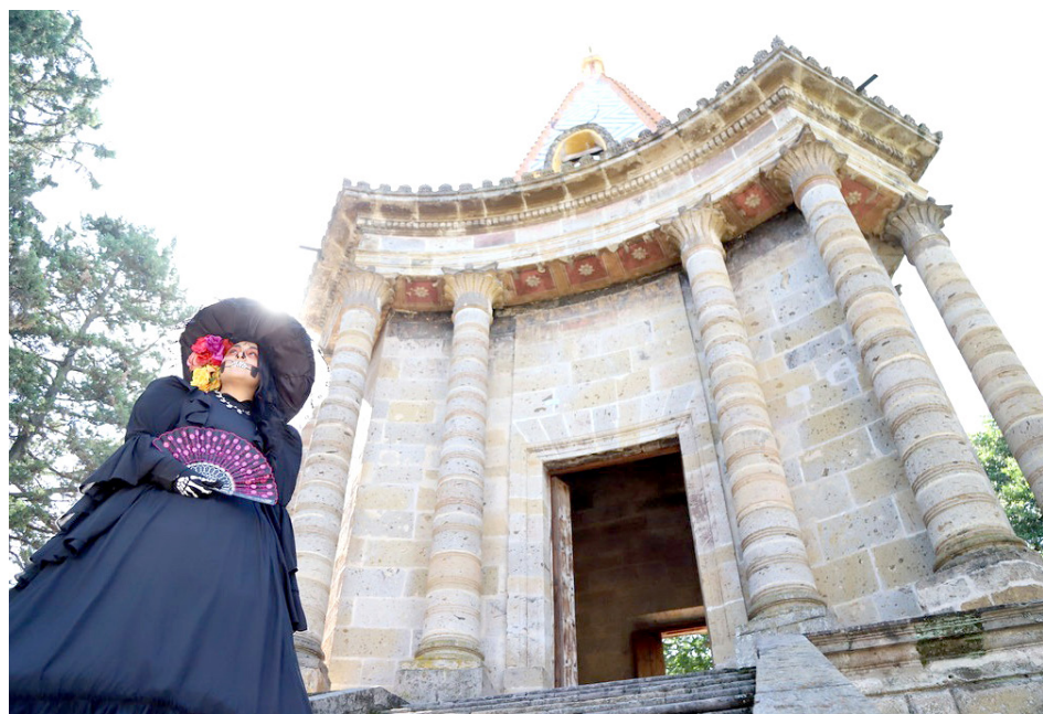
Las leyendas del Panteón de Belén serán contadas en los recorridos.

Este año, la innovación llega con la creación de una agenda participativa, que integra las iniciativas de gestores culturales, organizadores comunitarios y comerciantes. Esta colaboración busca descentralizar las festividades,