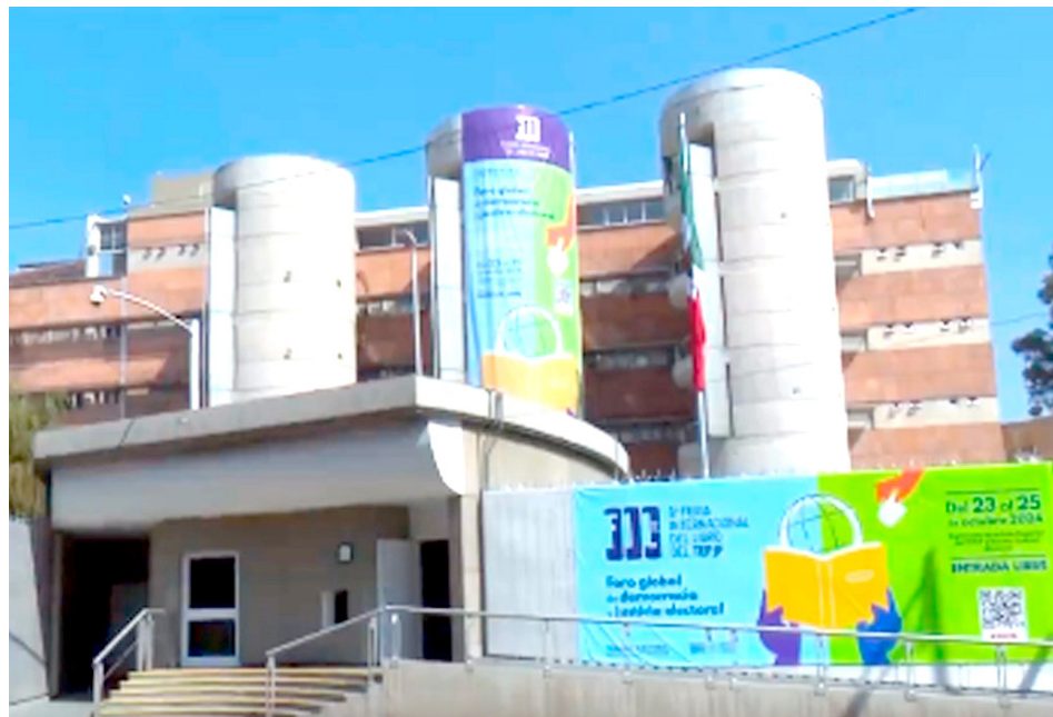
La exposición tiene lugar en la explanada de la Sala Superior del TEPJF.

nutrirnos de un conocimiento profundo que nos permite crecer como personas y como sociedad.