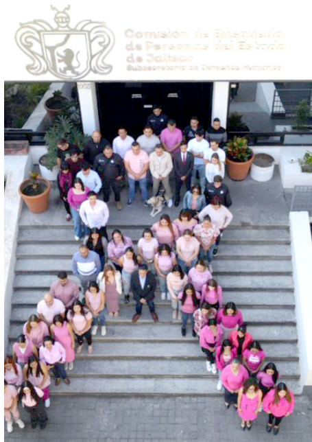
Personal médico también ha recibido capacitación.