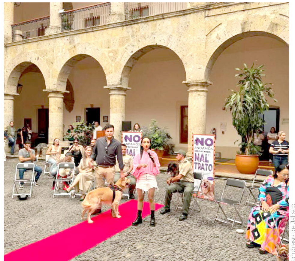
Las penas para los maltratadores de animales se endurecieron.

Recientemente fue aprobado sancionar de 8 a 18 meses de prisión, multa de 70 a 150 veces el valor diario de Unidad de Medida y Actualización (UMA), y trabajo en libertad en beneficio de la comunidad, a quien de manera intencional realice actos de maltrato y crueldad animal, sin que ponga en peligro su vida, y que de manera evidente se refleje daño en la