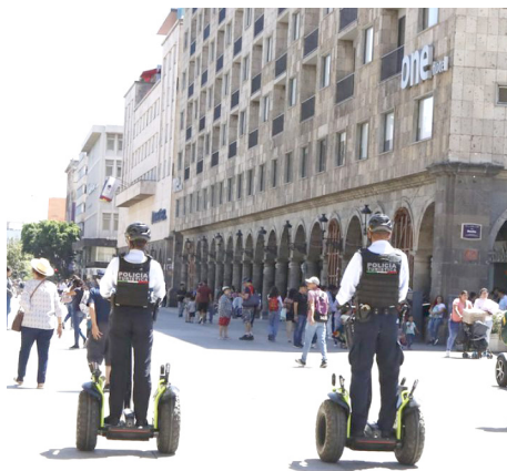
Comisaría de Guadalajara