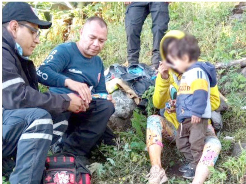
Una de las personas se fracturó una pierna.

De inmediato, se movilizaron las unidades de la Coordinación de Servicios de Emergencia y Seguridad Preventiva de Tlajomulco, quienes ingresaron por el potrero conocido como Los Castro, en el mismo ejido, basándose