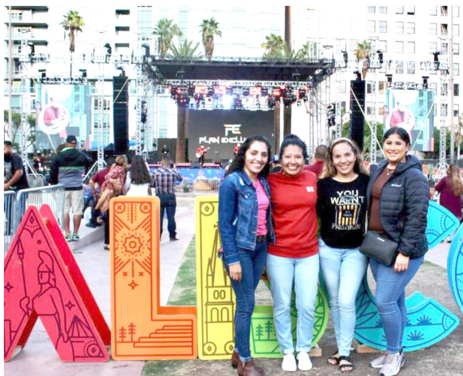
Los espectáculos son familiares, llenos de alegría y tradición mexicana.

Se esperaba la asistencia de más de 30 mil personas en los dos días del evento; las actividades son organizada por el Gobierno de Jalisco