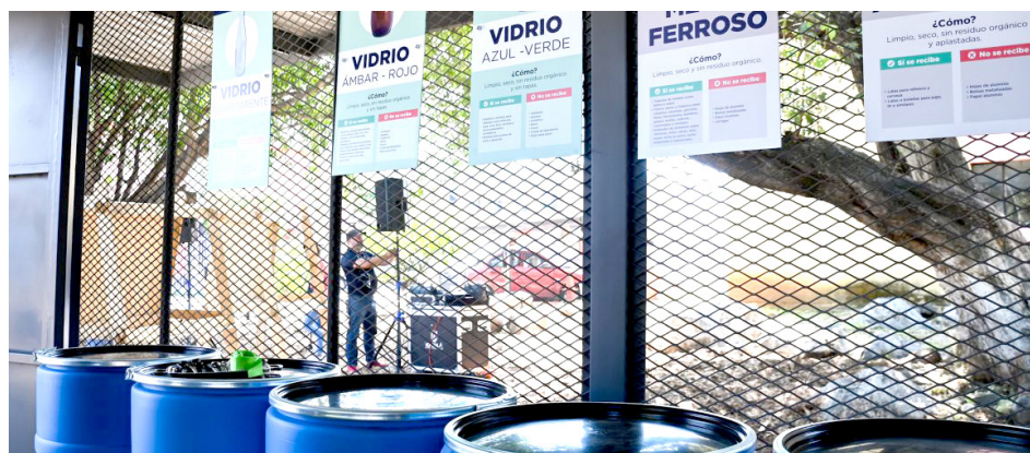
En este sitio las personas pueden separar los residuos.

En este punto las personas podrán disponer materiales como papel, cartón, plástico y vidrio siempre limpios, secos y separados, que serán valorados para contribuir a una visión de economía