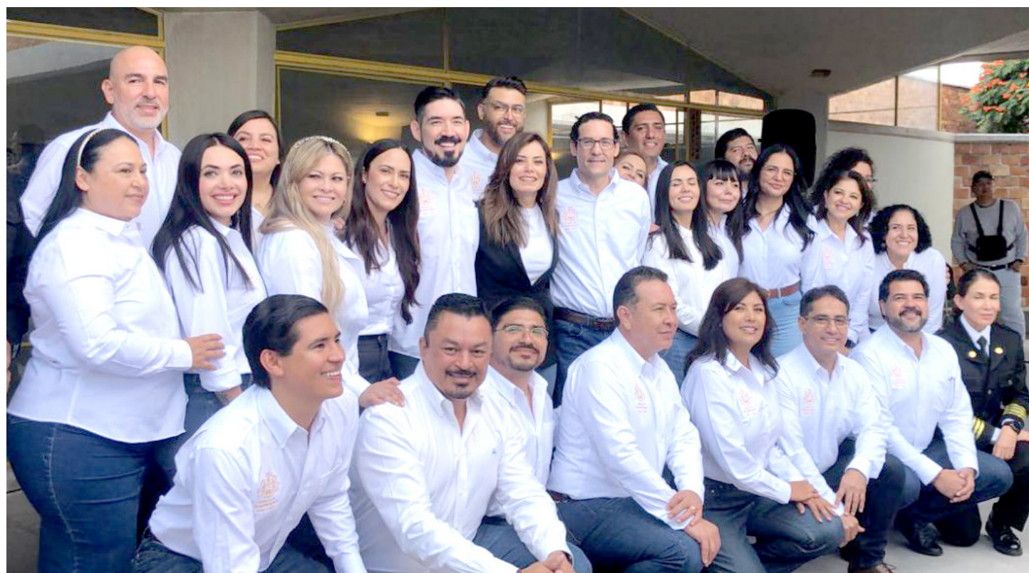
Sus colaboradores fueron presentados en la Colmena del Mercado Libertad.