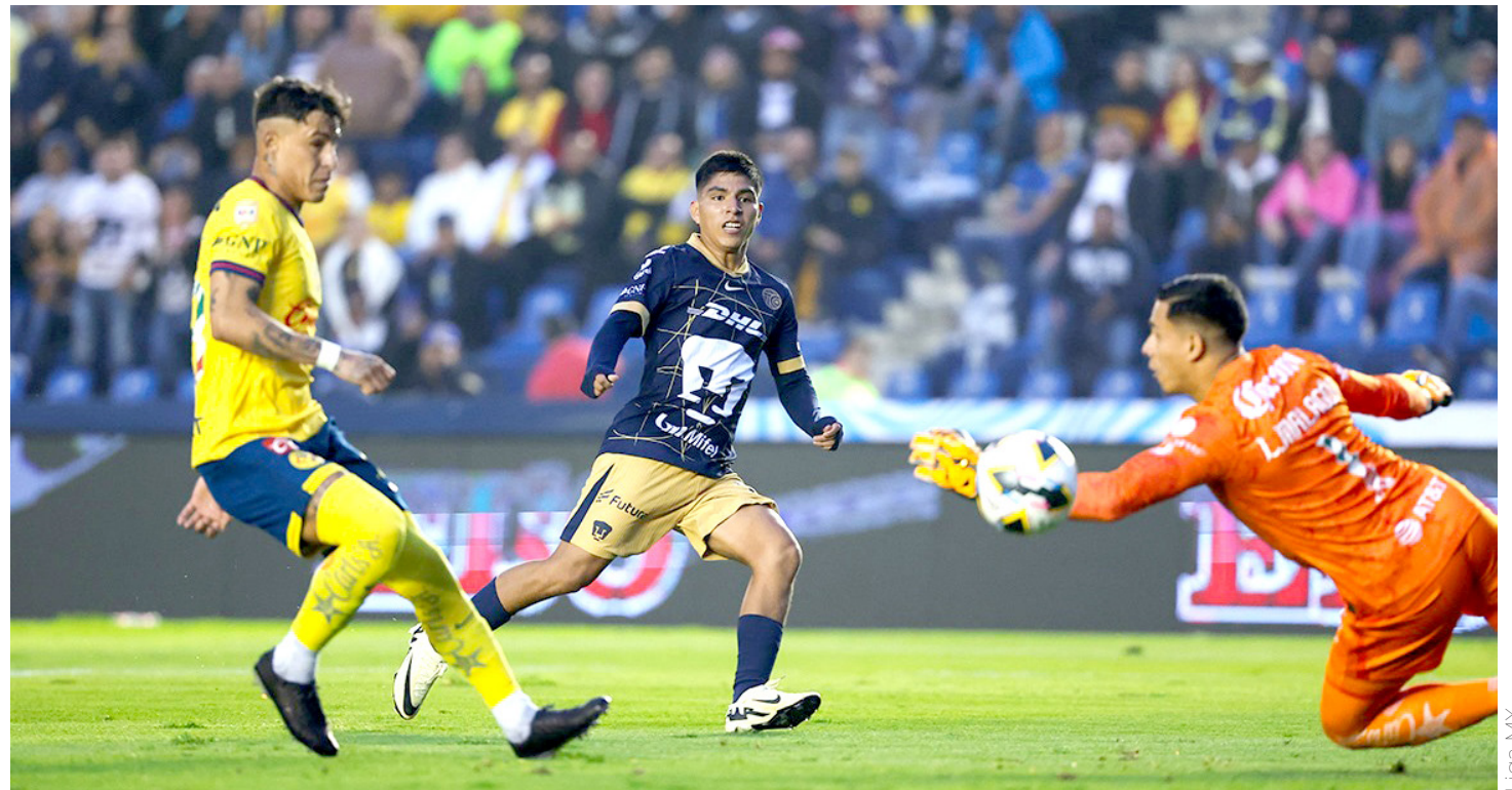
América generó dramatismo a los minutos 87 y 88.

En el clásico capitalino, Piero Quispe fue el único anotador; los de Coapa terminaron con un hombre menos