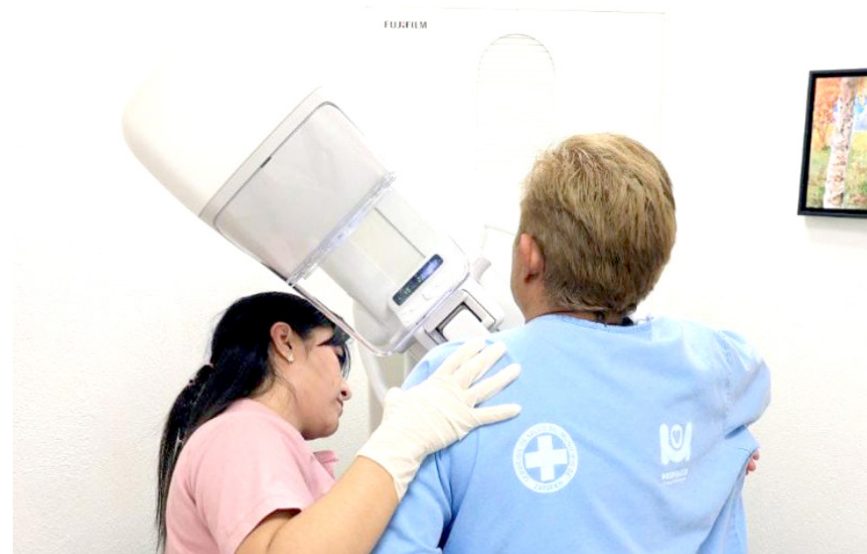
La detección oportuna del cáncer de mama es fundamental.

“Deben conocer sus pechos, conocer qué es normal en sus pechos, saber cómo se sienten, sus características. ¿Para qué? Si algún día llegara a