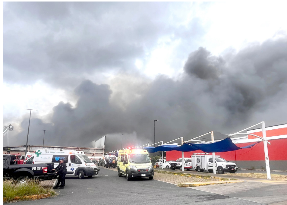
La tienda fue consumida en su totalidad por las llamas.