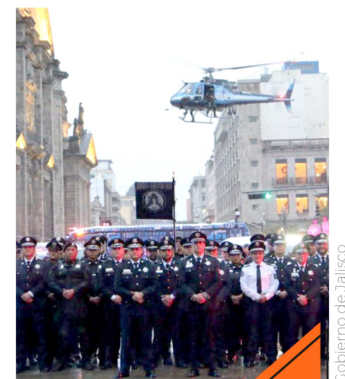
La dependencia ha tenido un crecimiento constante.

Según registros, la Policía de Guadalajara es la corporación más antigua a nivel municipal en el país.