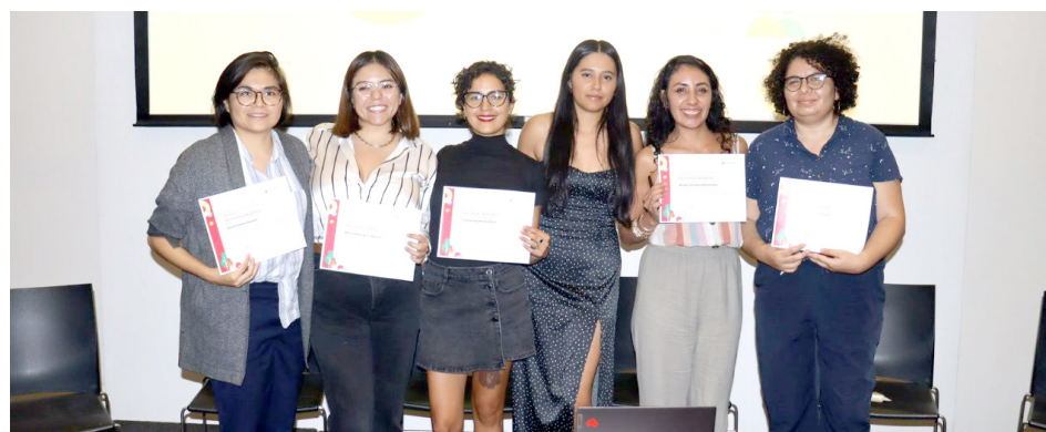
Gobierno de Jalisco

Durante los últimos años se ha promovido y ejercido esta estrategia basada en un diagnóstico de inclusión,