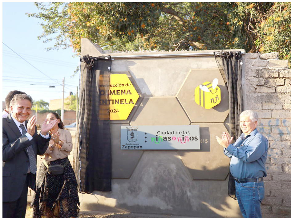
El alcalde aseguró que el Bosque El Centinela también sería rehabilitado.