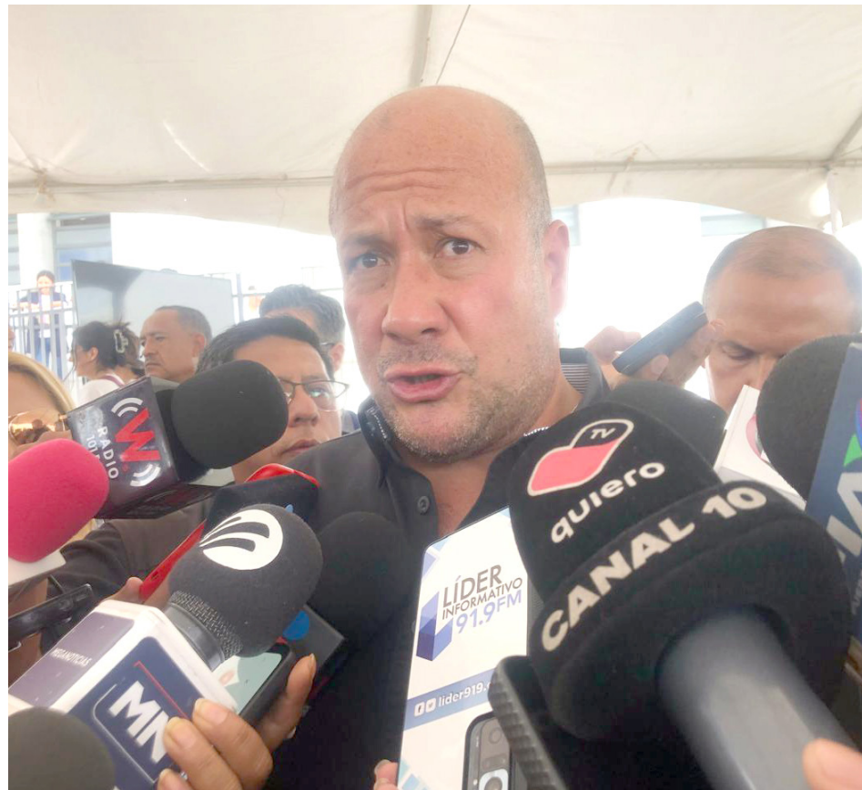
El mandatario explicó que invitaron al Presidente mexicano a que realizara una última visita a Jalisco.

“Es que no sé el resto de la agenda, porque también estaba pendiente