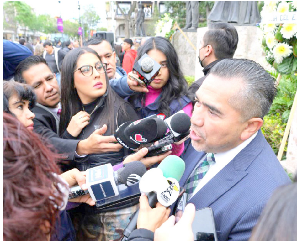
Comentó que la controversia les permitirá defender sus derechos ligados con la Reforma al Poder Judicial

“Quienes tenemos 30 años de servicio podemos irnos con haber de retiro y jubilados. No es un tema que nosotros lo establecimos en la ley orgánica. Está en la Constitución General del país y en la Constitución Local como derecho. Pero hay quienes ingresaron después que no tienen los 30 años de servicio o