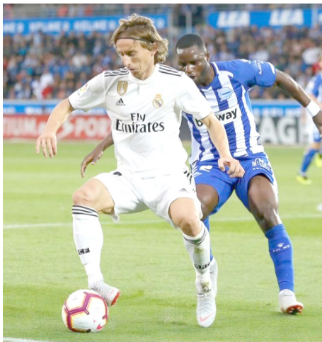
Real Madrid CF

Real Madrid se impuso de manera sufrida 3-2.