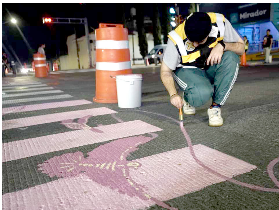
La pintura se realizó en Calzada Independencia y Volcán Zacapu.

Programaron actividades que buscan promover la movilidad sostenible y la intermodalidad, fomentando el uso de medios de transporte que contaminen menos