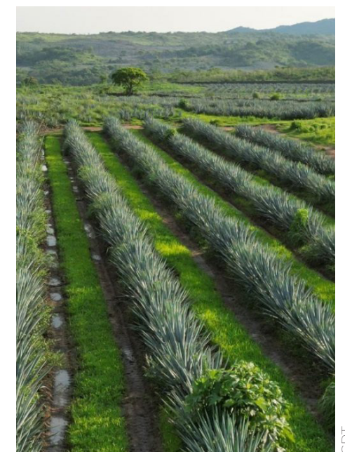
Son más de 128 mdd los que ha invertido la agroindustria tequilera en los últimos años.

“El impacto directo del sector tequilero en el cumplimiento de las metas de la Agenda 2030, se relaciona con el garantizar la disponibilidad de agua y su gestión sostenible, garantizar el acceso a una energía asequible, segura, sostenible y moderna, promover el crecimiento económico, inclusivo y sostenible, promover la industrialización sostenible y la innovación,