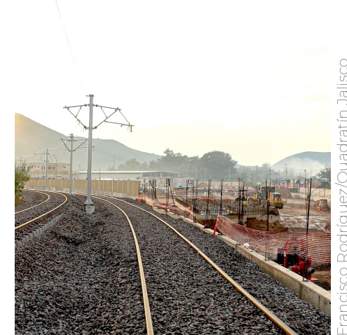
Transportará alrededor de 116 mil usuarios diariamente en un recorrido que durará solo 35 minutos.

Además, contará con 52 unidades Alimentadoras: 33 autobuses y 19 vans, que conectarán hasta a 55 mil personas de diversas colonias con la Línea 4.