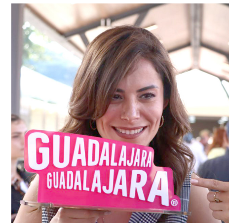
Más de 400 mujeres firmaron un desplegado nacional.

“¿Qué vamos a tener? Un área administrativa, recepción, aula de usos múltiples, ludoteca, gimnasio, almacén de ludoteca, baños infantiles mixtos, cuarto de máquinas, sistemas hidráulicos, cisterna pluvial, andadores. Vamos a tener también huerto urbano, huerto fijo, bodega, el área de seguridad”, entre otros espacios que destacó el director.