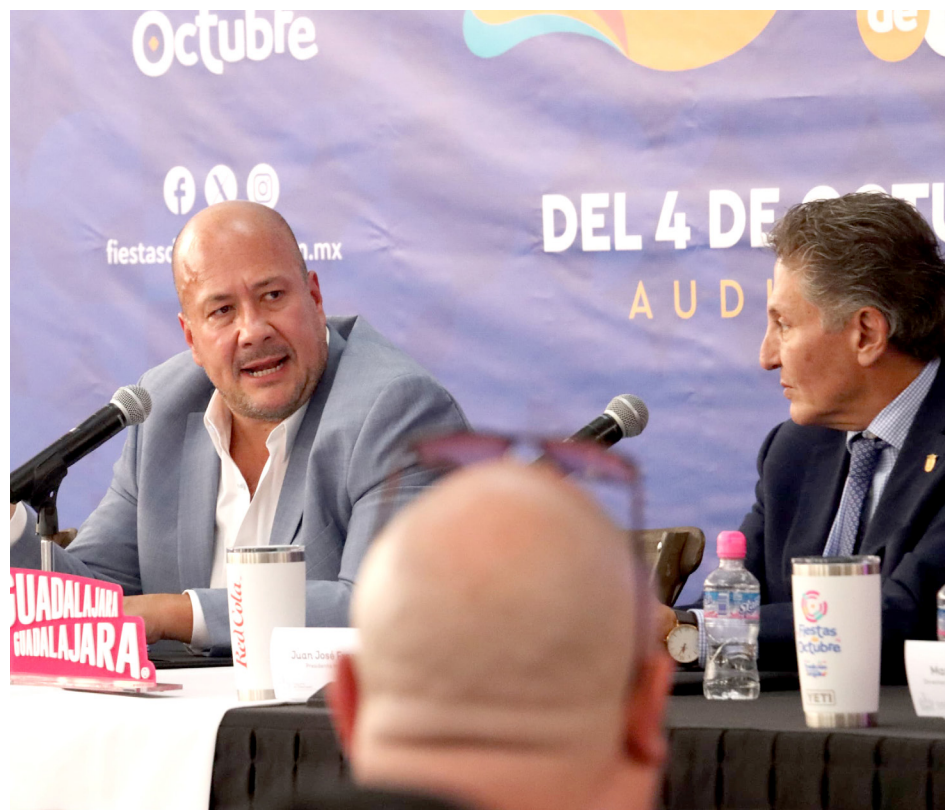
El gobernador Enrique Alfaro reveló que no hubo incremento en el precio de entradas

La Canica Azul en este año lleva como temática Un Universo de Color y como nuevos atractivos habrá una