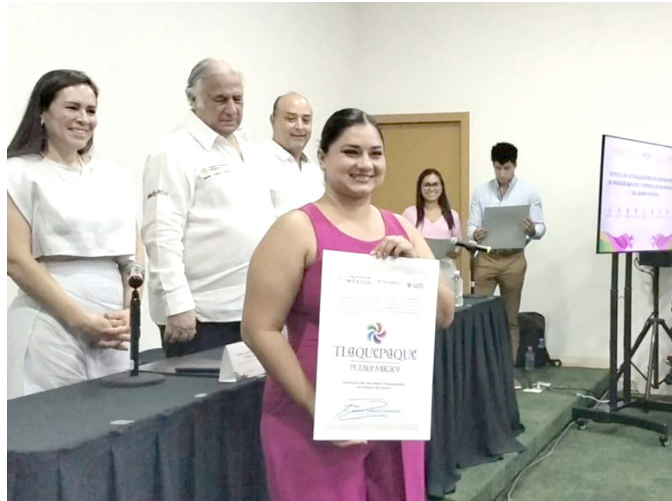
Hicieron un llamado a cuidar los Barrios de Color.

"En 2019 lanzamos el tianguis de Pueblos Mágicos y hoy lo dejamos fuerte, vigoroso y consolidado como una