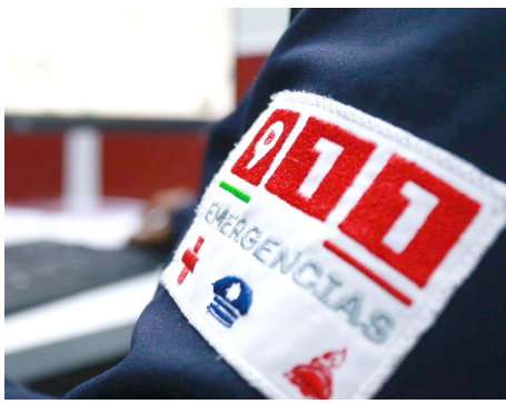
En 683 se reportaron a mujeres en trabajo de parto.