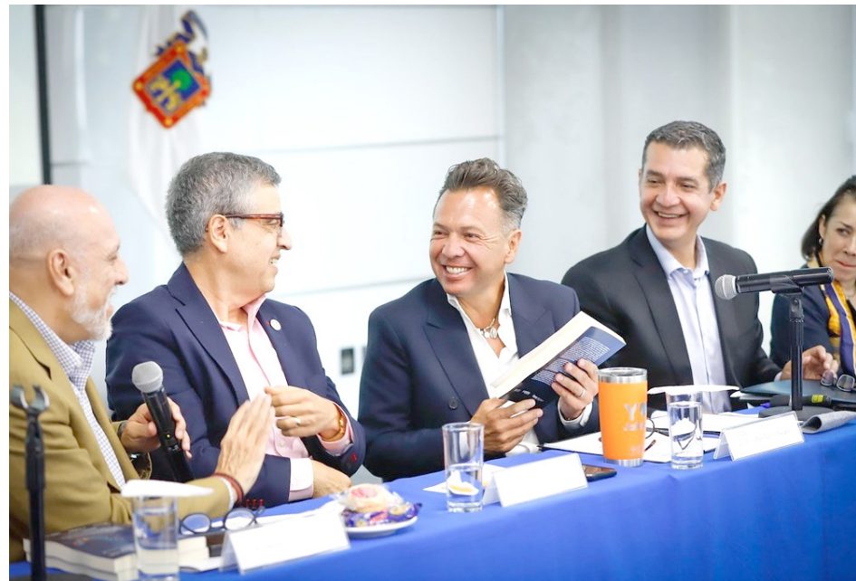
La cercanía con el gobierno federal será importante, pero sin perder autonomía.

Aseguró que su administración estará enfocada en mejorar las políticas públicas del estado, en línea con los