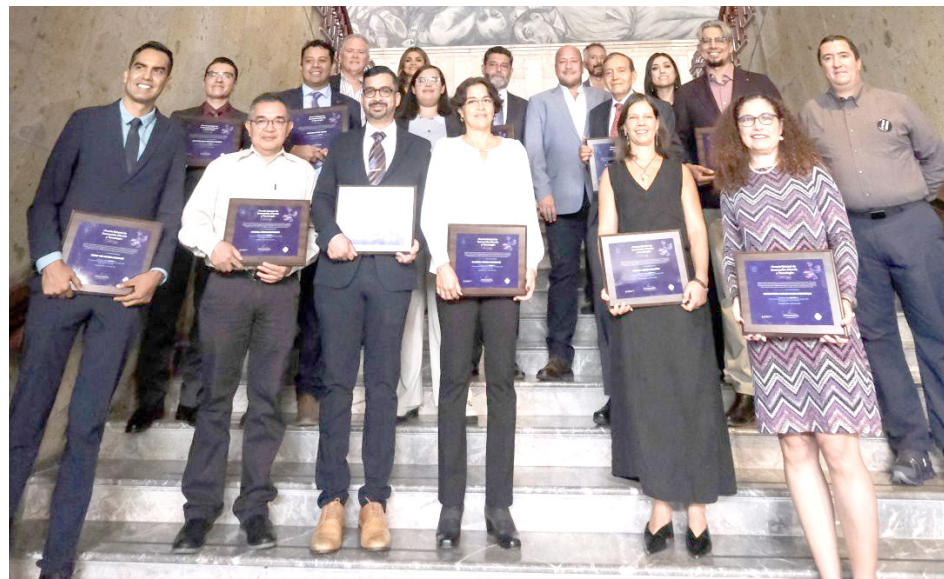
En esta edición participaron 72 evaluadores, de los cuales el 53 por ciento fueron mujeres.

El Gobierno repartió más de 977 mil pesos; Alfaro destacó que gracias a ellos el Estado mantiene su liderazgo en patentes y nuevas invenciones