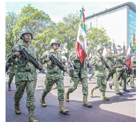
El Ejército Mexicano recorrió las calles.

de la música tradicional mexicana, desfilaron mujeres y hombres miembros de las corporaciones del Ejército Mexicano, Fuerza Aérea Nacional, Guardia Nacional, Fiscalía del Estado de Jalisco, Secretaría de Seguridad, Policía