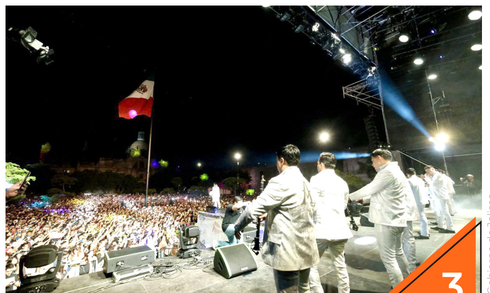
Demostó por qué sigue siendo una de las bandas favoritas del público.

Durante el grito de Independencia, ya tradicionales en la colonia Chapalita se dieron cita más de 8 mil 500 asistentes.