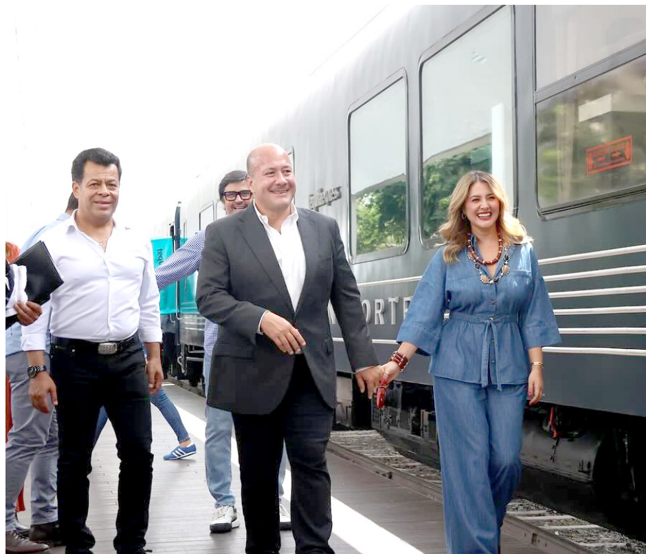
El regreso anhelado del Tequila Express superó las expectativas de autoridades.

De acuerdo con la tour operadora con un costo de mil 150 pesos podrá realizarse el recorrido que incluye barra