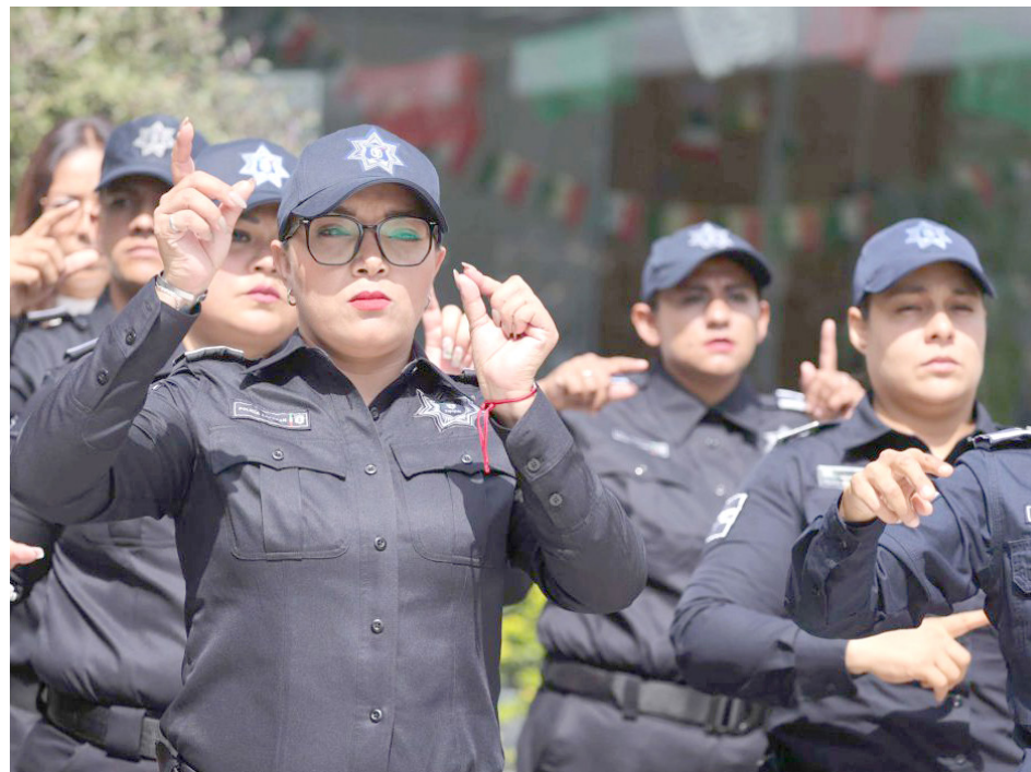
Policías de Zapopan tomaron el taller de Lengua de Señas.

Fueron 40 policías de la Comisaría de Seguridad Pública de Zapopan quienes interpretaron este poema lírico con inclusión