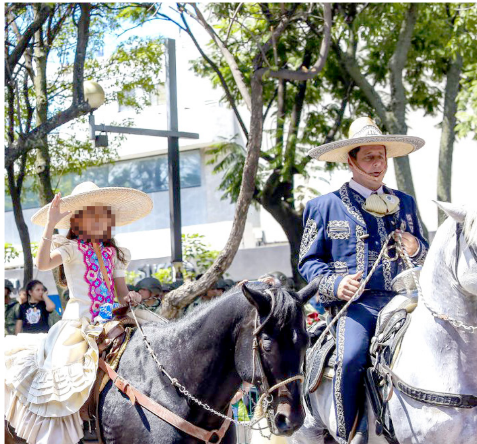
Los charros se hicieron presentes en el evento cívico.

“Desfilaron ante el pueblo de Jalisco los siguientes efectivos: seis banderas de guerra, 18 banderas nacionales, 33 guiones, mil 380 efectivos del Ejército, Fuerza Aérea y Guardia Nacional, dos mil 859 civiles, 345 vehículos, 31 motocicletas, una embarcación, dos