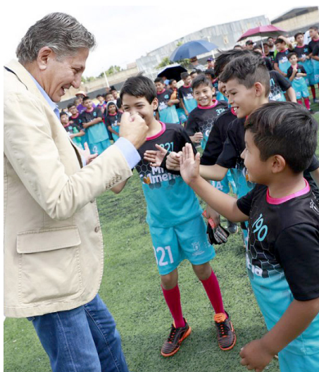
Participaron 45 equipos de tres Colmenas y dos Enjambres.

Participaron 45 equipos pertenecientes a las tres Colmenas y dos Enjambres con las que cuenta Zapopan, en donde se inscribieron 800 niñas y niños.