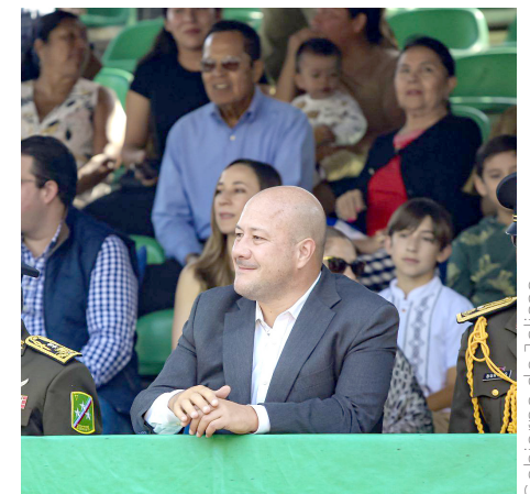
Enrique Alfaro disfrutó del desfile.

“Además, a las distintas autoridades locales de los 125 municipios que hicieron lo necesario para poder vivir las Fiestas Patrias en tranquilidad”.