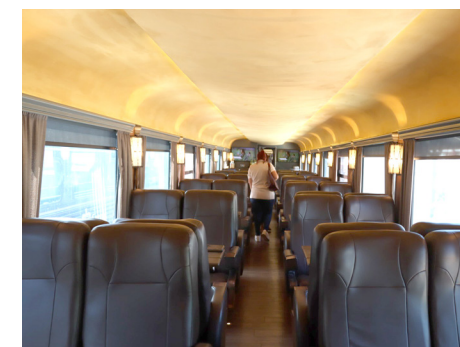
Elegancia, comodidad y asombrosos paisajes acompañan este recorrido.

Una novedad es que todos los vagones tienen baños para damas y caballeros y son ecológicos y al final del Tren el pasajero puede acercarse a ver más de cerca los campos de agave para una experiencia más orgánica.