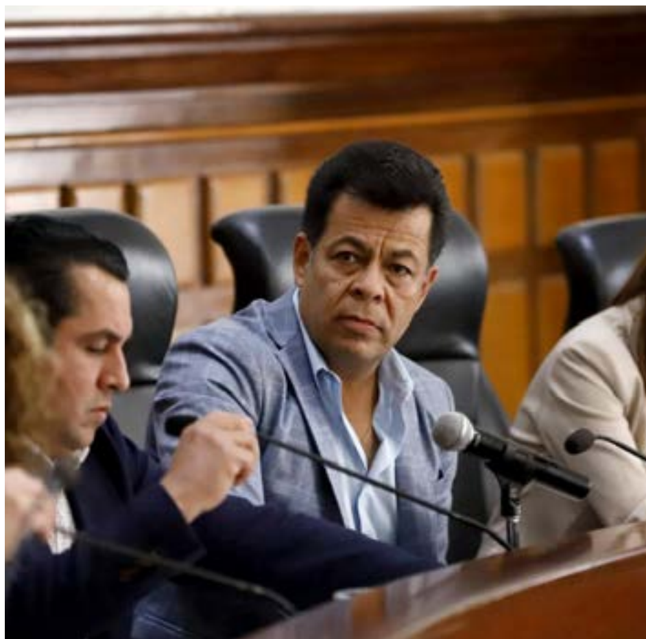
Los regidores tapatíos decidieron con 13 votos a favor y 6 abstenciones.

La empresa concesionaria para la recolección de basura, quedó fuera ante constantes incumplimientos; el cabildo rechazó el dictamen de prórroga