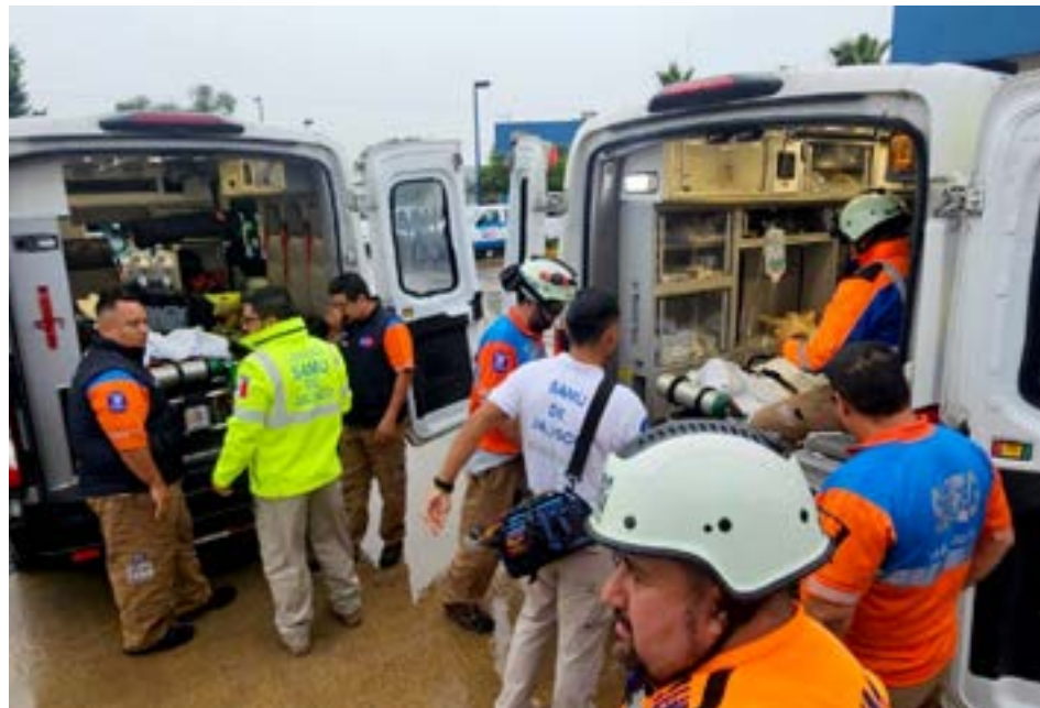
Autoridades de Guanajuato atendieron la situación y fueron auxiliados por equipos de emergencia de Jalisco.

De forma preliminar se reporta que en el accidente resultaron 35 personas lesionadas y una fallecida; uno de los heridos se encuentra en estado grave; se reportan 6 personas en estado regular y 28 con lesiones leves.