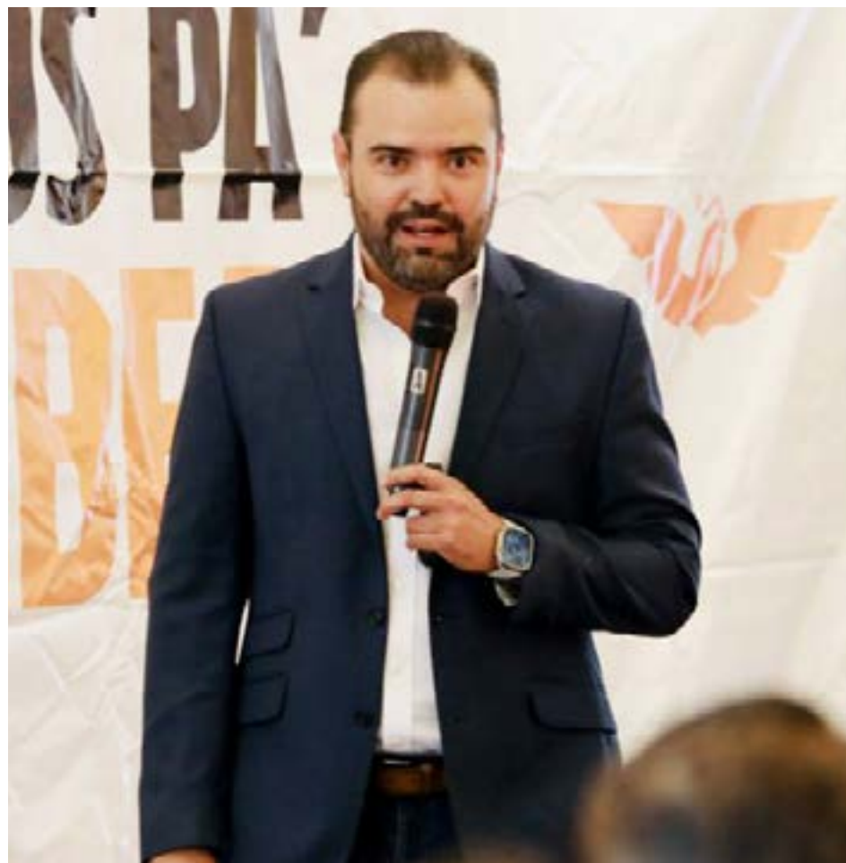
Quirino Velázquez dijo que su estrategia es una planeación clara.

El alcalde electo de Tlajomulco, reiteró que su Gobierno será cercano a la gente, trabajará en las calles y cumplirá con sus compromisos