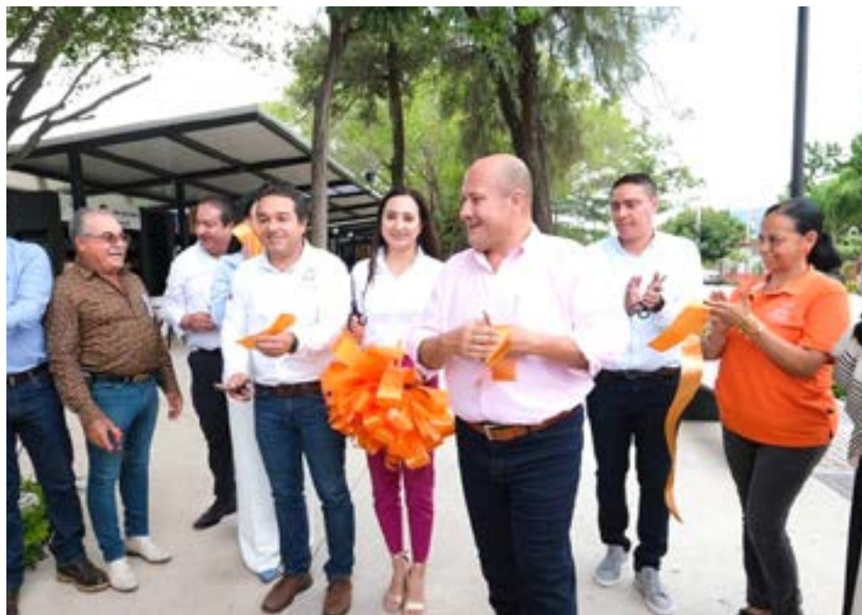
El Gobernador dijo que arrojan beneficios que multiplican los beneficios para los automovilistas.

Se trata de las obras de renovación de avenida Paseo Comercial Las Rosas, la Primaria Manuel Ávila Camacho y la Glorieta de Ingreso al municipio