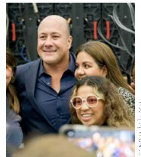
El gobernador de Jalisco, Enrique Alfaro entregó equipo electrónico.