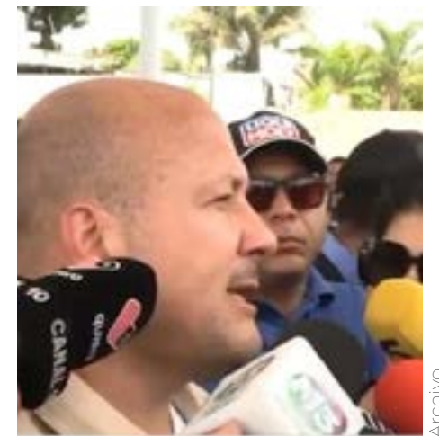
El mandatario lamentó el accidente ocurrido en Celaya.

Las autoridades locales de Guanajuato desplegaron sus equipos de emergencia para atender la situación. Ellos están a cargo del incidente. De momento es la información con la que contamos.