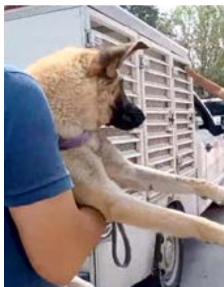
El can presentó quemaduras en sus patas.

Con esta inauguración, el municipio reafirma su compromiso de seguir invirtiendo en infraestructura y tecnología, trabajando de la mano con la sociedad y los tres niveles de gobierno para asegurar un entorno seguro y confiable para todos.