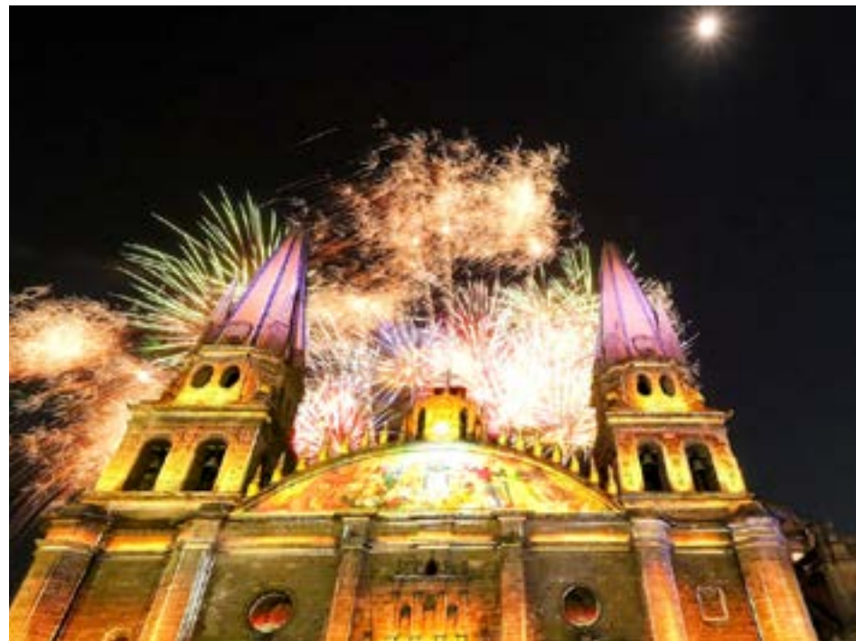
El Estado celebra con orgullo el auge que vive su sector turístico.

El Estado recaudó una derrama económica de 50 mil 277 millones de pesos gracias a esta labor de promoción conjunta con municipios y la iniciativa privada