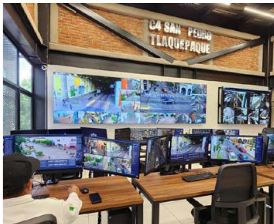
Gobierno de Tlaquepaque

Cuenta con áreas operativas clave, como una sala de crisis; una armería; una sala de capacitación con capacidad para 100 personas y una cabina de