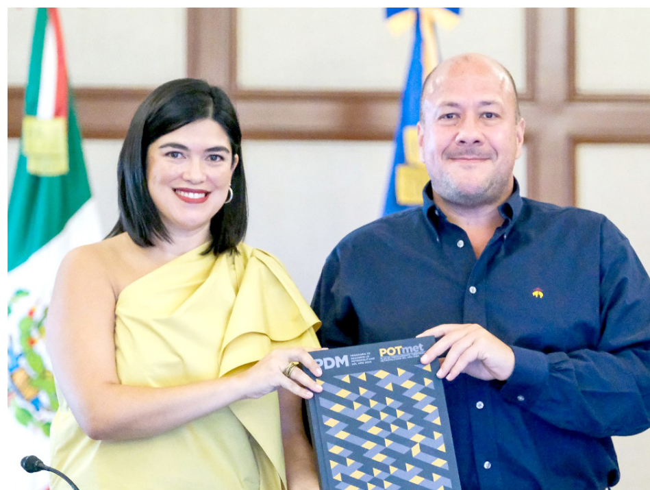
El nuevo plan establece un equilibrio con un crecimiento urbano ordenado.