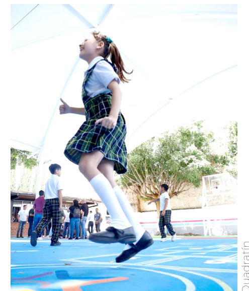
Las adecuaciones tuvieron un costo de 3 mdp.

«No se trata solo de una escuela bonita, sino de un lugar donde los niños y niñas de Guadalajara puedan crecer y aprender en las mejores condiciones. Esta escuela es un claro ejemplo del compromiso que tenemos con la educación», mencionó.