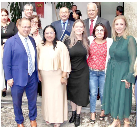
Sostuvieron que es un derecho que cualquier jalisciense pueda ejercer el voto.