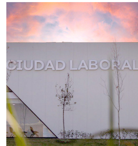
Serán seleccionadas cuatro mujeres.

busca lograr reparaciones del daño, y hemos retenido reparación del daño que son simbólicas para la sociedad, y algunas en reparación del daño, que tienen que ver más con afectaciones matrimoniales; por ejemplo, hablamos de Siapa, una sola persona reparó el daño con 5 millones 600 mil pesos, una sola persona, y otra empresa en una carpeta diversa, también cerca de 6 millones de pesos. Entonces nada más para una dependencia, yo pienso que se habrán logrado algunos 15 millones de pesos en una sola dependencia, para el siapa que es la que más ha recibido en reparaciones".