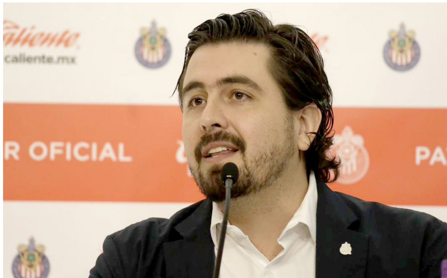
Amaury Vergara revela que ya no es tan fácil que un jugador sea contratado por su club.

Recordó la importancia que tiene en su equipo las fuerzas básicas. “Chivas puede necesitar refuerzos en diferentes momentos, por supuesto que sí. Cuando los necesitemos y los encontremos, los traeremos, pero también es muy importante considerar que Chivas tiene que darle oportunidad a su cantera. Entonces, si hay un refuerzo que Chivas necesita, está ahí afuera y cumple con el perfil y las condiciones que