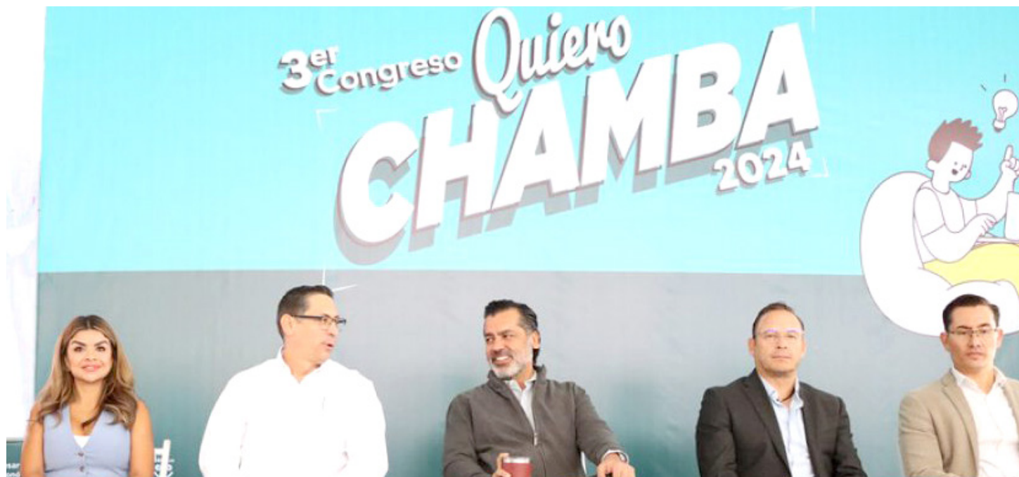
El Congreso se desarrolla en Paseo Alcalde, a un costado de Plaza de Armas.

“En Guadalajara se tenía que hacer algo diferente, y esto que hoy estamos inaugurando es muestra de ello. También las empresas nos tuvimos o se tuvieron que reinventar, encontrar la manera de cómo ser más atractiva para los trabajadores, y, sobre todo,