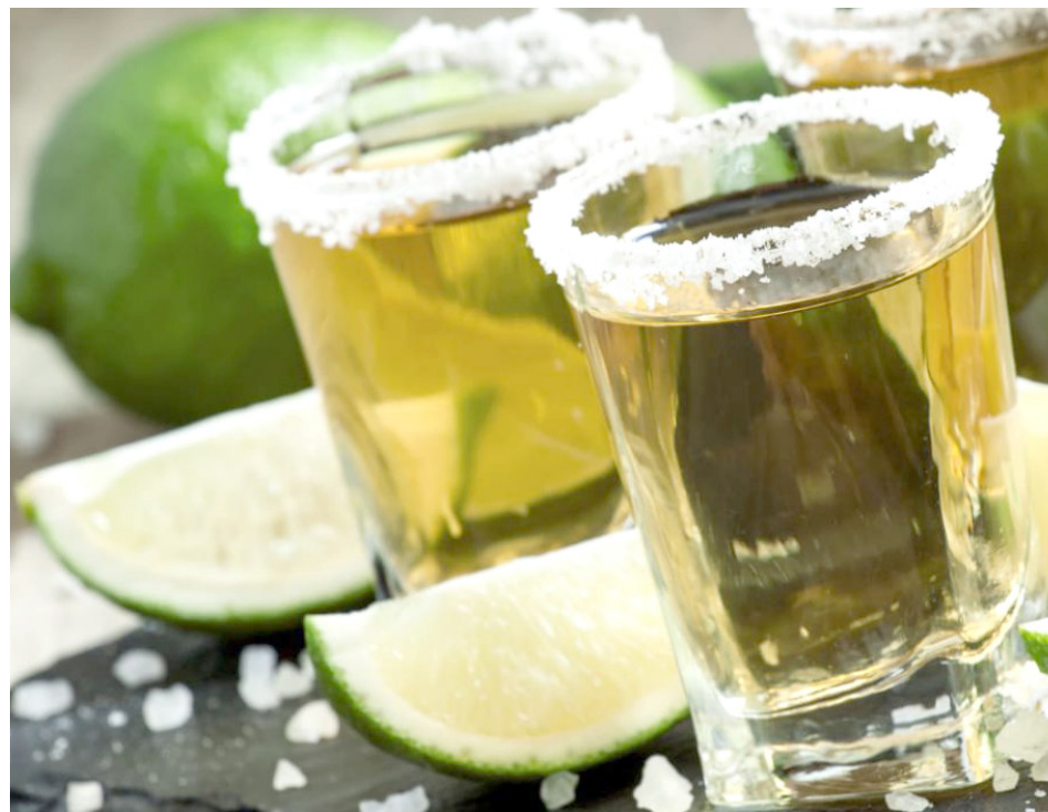
El Consejo Regulador del Tequila ya solicitó apoyo a la Sader.

El director del Consejo Regulador del Tequila informó que son más de 88 mil piezas de agave exportadas