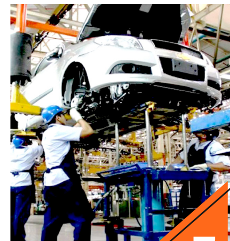
La industria automotriz busca insumos locales.

El titular de las industrias maquiladoras y manufactureras de occidente admitió que existe preocupación en estos sectores por lo que está ocurriendo con la Reforma Judicial, teme que esto vaya a frenar nuevas inversiones por falta de certeza en el país.