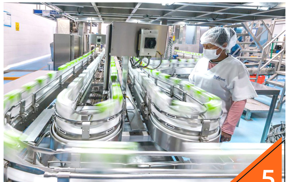
Gobierno y empresas aseguran que hay respeto al estado de derecho.

“Jalisco se distingue porque aquí se apuesta al crecimiento sostenido y a la seguridad jurídica, a través de un ecosistema donde los derechos están protegidos y donde existen estrategias transexenales claras para enfrentar cualquier reto que surja a nivel nacional. Las instituciones locales, sólidas y bien estructuradas, son fundamentales en la consolidación del estado como un referente en México”, firman Industriales de Jalisco, Coparmex, Index, CMIC, Cámara de Comercio y mucho más.