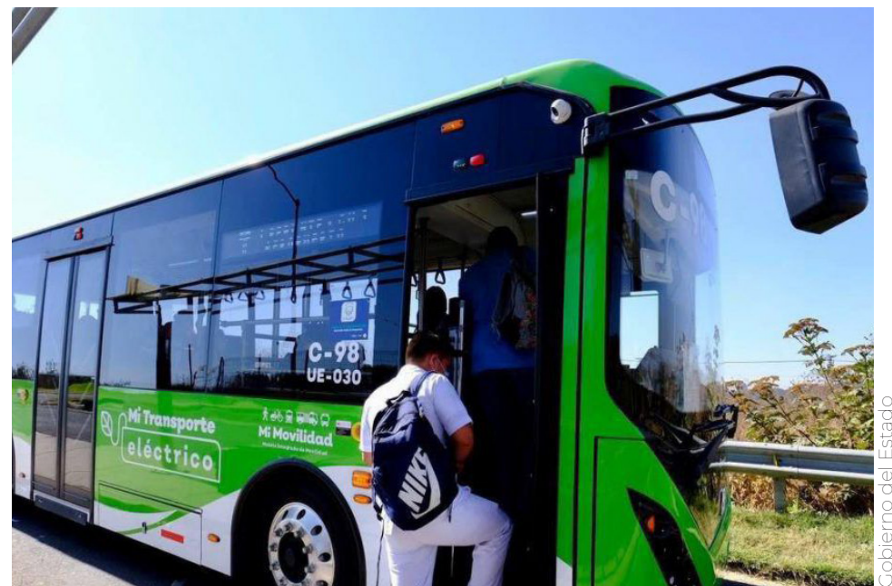
Gobierno del Estado

En el caso de Mi Transporte, y en el mismo contexto de los cierres viales que se llevarán a cabo dentro del polígono de los festejos patrios, las rutas C109, C139, C140 Parques de Tesistán, T14B-C02 Agua Blanca-Indígena y T11B-C01 se modificarán de la siguiente manera: La ruta C109, que viene de La Minerva