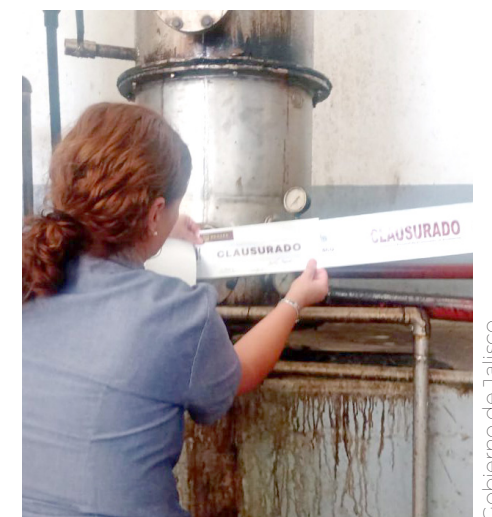
La Proepa detectó el mal manejo de sus vinazas.

Aunado a lo anterior, la tequilera, no acreditó haber presentado ante la Secretaría de Medio Ambiente y Desarrollo Territorial (Semadet) para su validación y registro, el plan de manejo como gran generador de residuos, ni contar con la bitácora para registro de volumen, tipo de residuos generados y su forma de manejo a la que fueron sometidos, entre otras irregularidades.