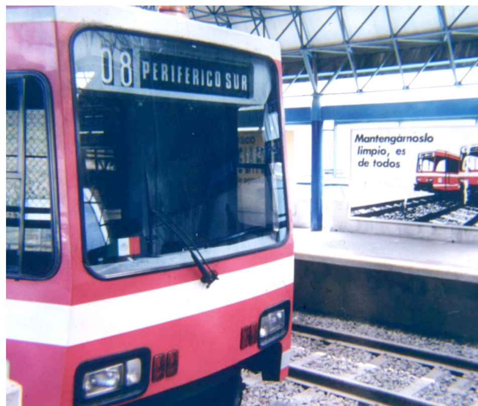
Fue en 1989 cuando se llevó a cabo la culminación de la Línea 1 del Tren eléctrico.