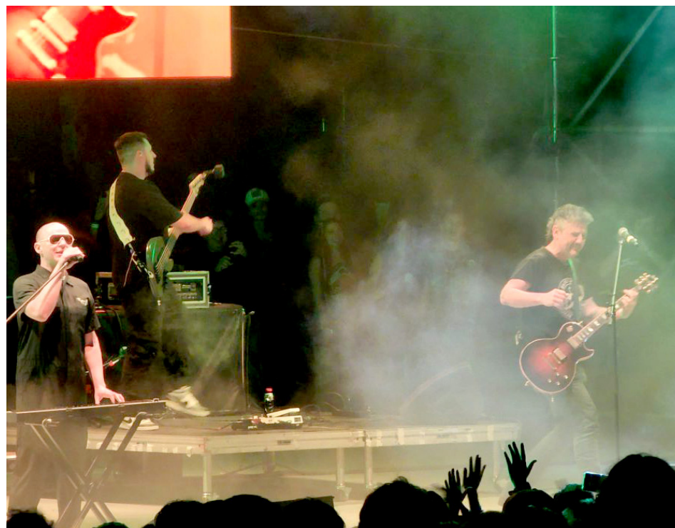
Al evento acudieron alrededor de 8 mil 200 personas.

Además de buena música, los asistentes pudieron disfrutar de una muestra de cerveza artesanal y una variedad de opciones gastronómicas