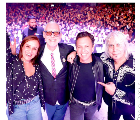
El gobernador electo acudió junto a su familia.

Desde las tres de la tarde, quienes se dieron cita en este lugar disfrutaron de cerveza artesanal y alimentos como lonches de pierna, donas, carnes en su jugo, tortas ahogadas, entre otros.