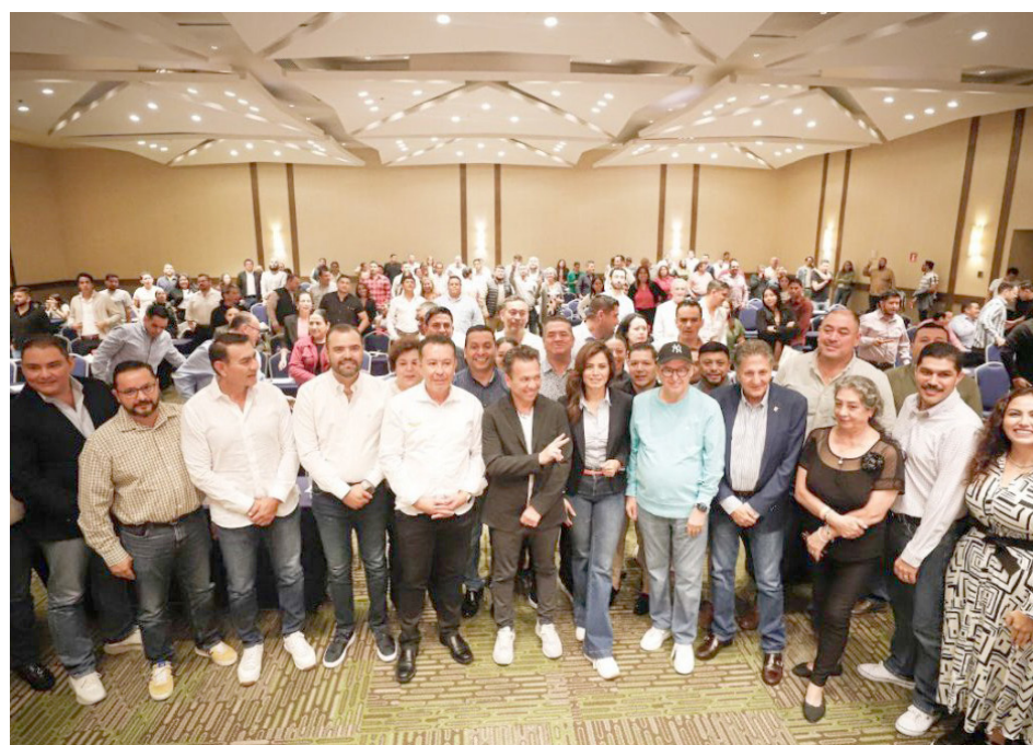
El presidente de MC en Jalisco explicó que deben ser gobiernos cercanos a la gente.

A este taller asistieron alcaldes electos, síndicos, secretarios generales