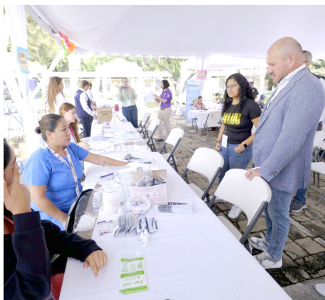
Se realiza en las instalaciones del Centro de la Amistad Internacional.