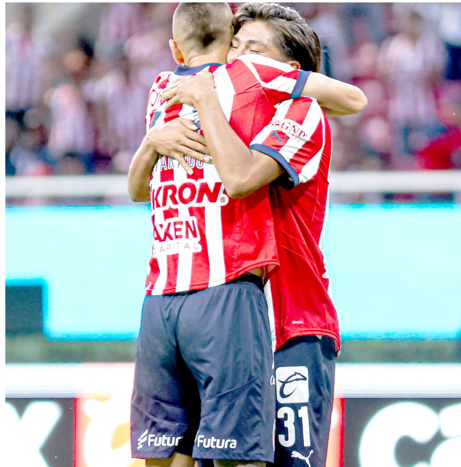
El contundente 5-0 sobre la cancha del Estadio Akron fue una fiesta para los aficionados.