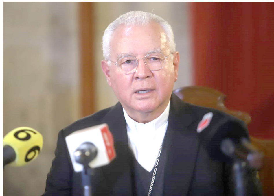
El Arzobispo de Guadalajara dijo que esta es una realidad muy dolorosa.

Lo que es más doloroso es que la gente que tiene familiares desaparecidos no sienta un interés efectivo, dijo el purpurado jalisciense