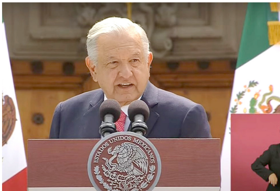
Citó que, en el periodo de Calderón, un rico ganaba 35 veces más que un pobre.

Al rendir su sexto y último Informe de Gobierno, el presidente de la República resaltó los logros de su gobierno, destacando la disminución de la pobreza