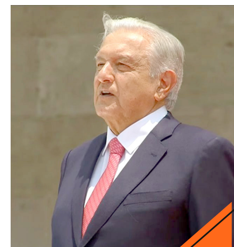
Destacó que se usa más la inteligencia que la fuerza.

Finalmente, el presidente reconoció que el caso Ayotzinapa es una asignatura pendiente.