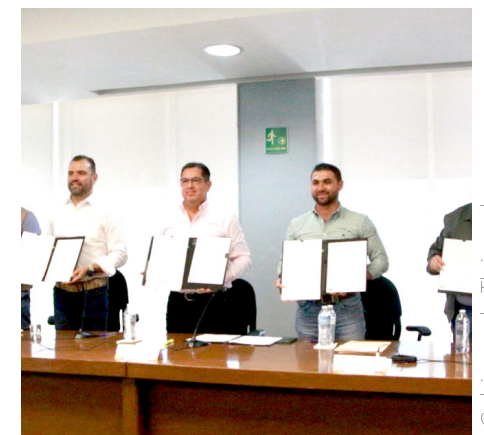
Se realizó la una firma de convenio para contar con los equipos.